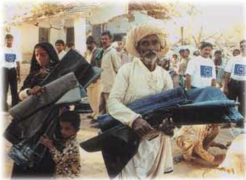
Peavarju vajavad katastroofiohvid saavad Euroopa Liidult hädaabi.

EL suunab toetusrahad abivajajateni Humanitaarabi Ameti (ECHO) kaudu. Alates selle loomisest 1992. aastal on ECHO aidanud likvideerida tõsiste kriiside tagajärgi rohkem kui 100 riigis üle kogu maailma, viies nii kiiresti kui võimalik abivajajateni hädavajalikkude tehnikat ja hädaabivahendeid. Oma enam kui 500 miljoni euro suurusest aastaeelarvest rahastab ECHO mediti-