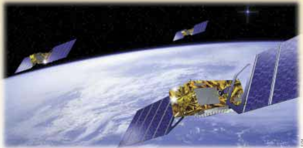
Galileo tiirlemas ümber Maa.

Galileo süsteem, mis peaks hakkama toimima 2008. aastal, hakkab pakkuma alternatiivi USA globaalse asukoha määramise süsteemile (GPS), olles sealjuures täpsem. Galileod on plaanis kasutada peamiselt sõidukite ja teiste transpordiliikide asukoha geograafiliseks määramiseks, teadusuuringute läbiviimiseks, maakorralduslikel eesmärkidel ning katastroofide seireks. Süsteem hakkab teenima ka valitsuste huve, kuid sellisele rakendusviisile on juurdepääs ainult liikmesriikidel.