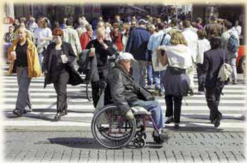
Inimõigused kehtivad kõigile.

Peale selle kehtestab EL madalamad imporditariifid riikidele, mis järgivad Rahvusvahelise Tööorgani satsiooni sätestatud peamisi töötingimusi ja -norme.