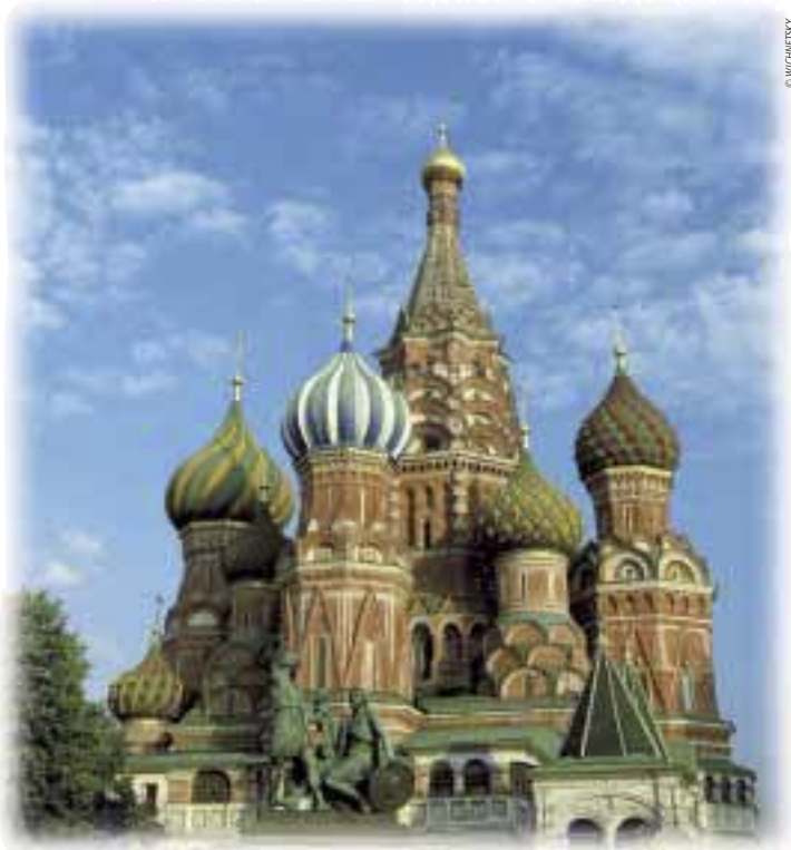
Venemaa on Euroopa Liidu suurim naaber.

liikmeks, on neil vaba juurdepääs ELi turule ning nad saavad ELilt toetust siseriiklike reformiprogrammide läbiviimiseks. Järgmise sammuna on neil võimalik hakata pidama ELiga läbirääkimisi stabiliseerimis- ja assotsieerumislepingute üle, nii nagu seda tegid enne ELi liikmeks saamise taotlemist Horvaatia ja endine Jugoslaavia Makedoonia Vabariik.