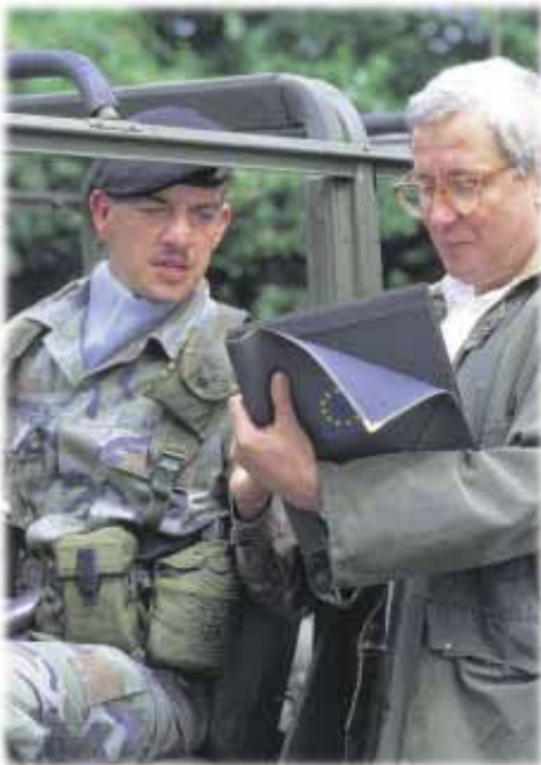
Euroopa Liit on nüüd võimeline saatma kriiskolletesse oma rahuvalvajaid.

Aastate jooksul on mitmel korral proovitud ÜVJP otsuste vastuvõtmist sujuvamaks muuta. Võtmeotsused tuleb aga endiselt vastu võtta ühehäälselt, mis oli keeruline, kui ELis oli 15 liiget, ja on veelgi keerulisem 25-liikmelises