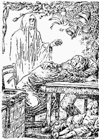
{Царь Голод стоит за спиной рабочей семьи. (Das Kleine Blatt).

Здесь мы подходим к огромной важности для рабочего класса проблеме социального законодательства, которое должно обнять все виды охраны труда. О том, какие существуют формы социального обеспечения в области безработицы, болезни, старости, инвалидности, ма-