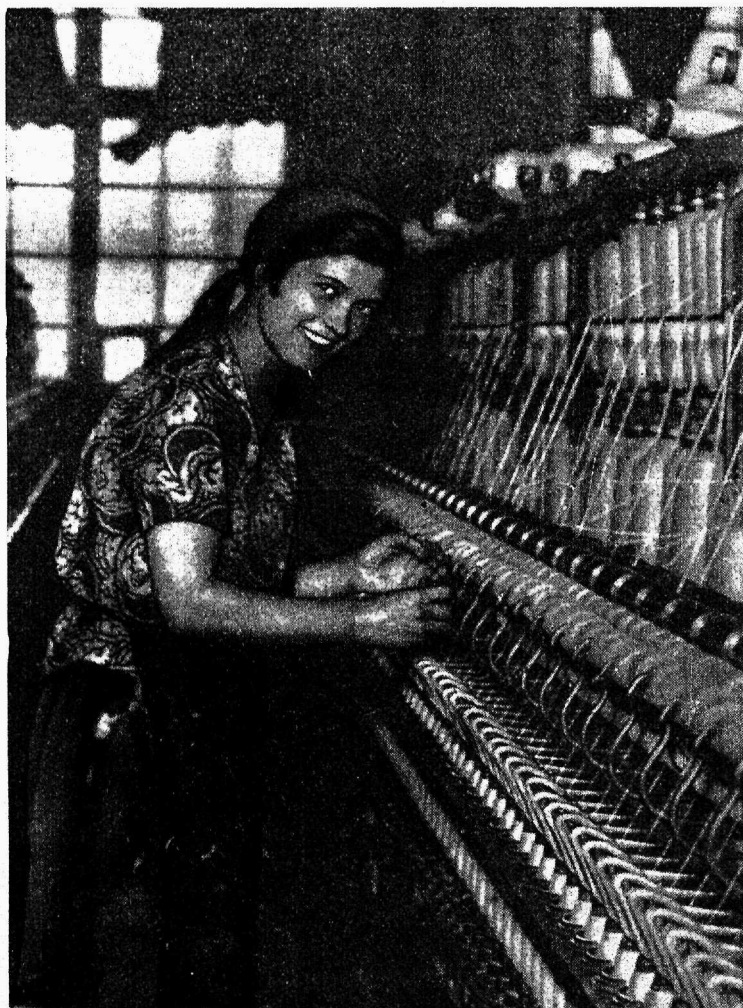
Фотоэтиюд Н. Петрова

СОДЕРЖАНИЕ: 1) Капитализм, рабочий класс и социальное законодательство — А. Узай. 2) Социальная политика и Союз Эст. Больничных Касс — А. Линномяги. 3) За социальное законодательство — Л. Югансон. 4) Основы социального страхования — Д-р А. П. Штейнберг. 5) Вредные моменты в обстановке труда — Д-р Н. А. Вигдорчик. 6) Страхование рабочих на случай болезни в Эстонии. 7) Смертность и болезненность в текстильной промышленности. 8) Гигиена труда. 9) Зароботная плата. 10) Охрана труда. 11) Безработица. 12) Труд и техника. 13) Иллюстрации.