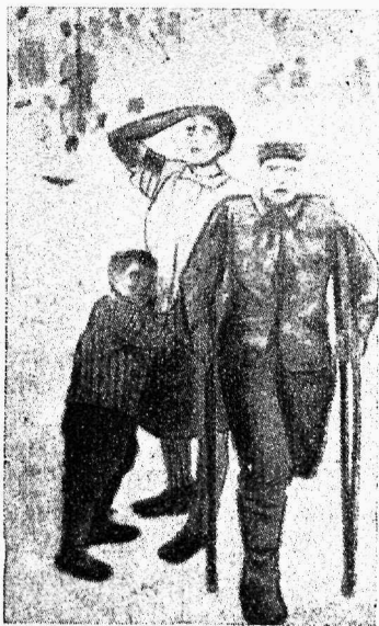
Ф. Богородский. Европа после мировой войны.

Значение социального страхования, как фактора улучшения быта, материального и культурного положения рабочего класса, растет с каждым днем.