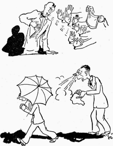
Спаси Господи нас от чихателей! (Gesundheit).

представляет из себя дериват целлюлозы с прекрасным блеском, но в