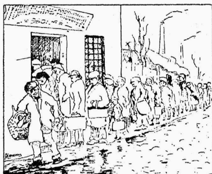
У пещеры „Зеленого Змия“.

Малолетние от четырнадцати до шестнадцати лет могут быть заняты работою в текстильн. про-