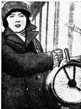
Женщина во флоте У штурвального колеса.

Средства больничных касс образуются: 1) из взносов участников и приплат владельцев предприятий; 2) из