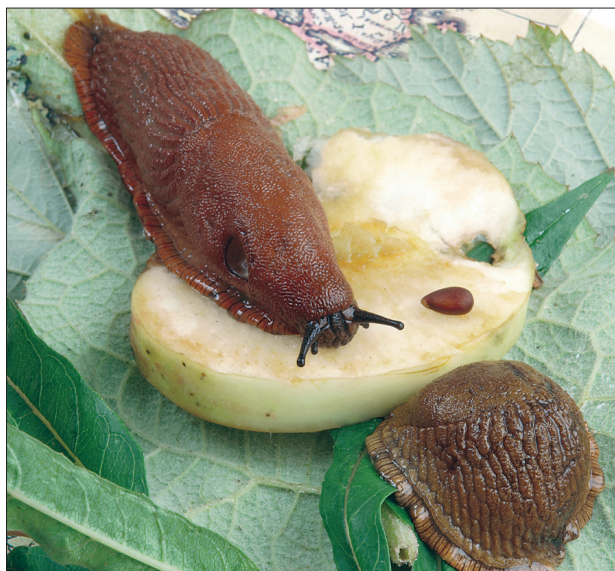
Hiljuti ühest aiakeskusest leitud tapjanälkjad. Üks maiustas õuna kallal, teine tõmbus pildistamise ajaks kerra, aga hiljem ajas end taas sirgu. Väljasirutatult on tigu umbes 12 cm pikkune.

Juuresoleval pildil olevad hiigelnälkjad, kes toodi Targu Talita toimetusse, leiti hiljuti ühe aiapäri istikuplatsilt. Aednike sõnul on aplaid kahjureid seal varemgi märgatud, eriti isukalt sõid nad näiteks brunneraid ja hosta-