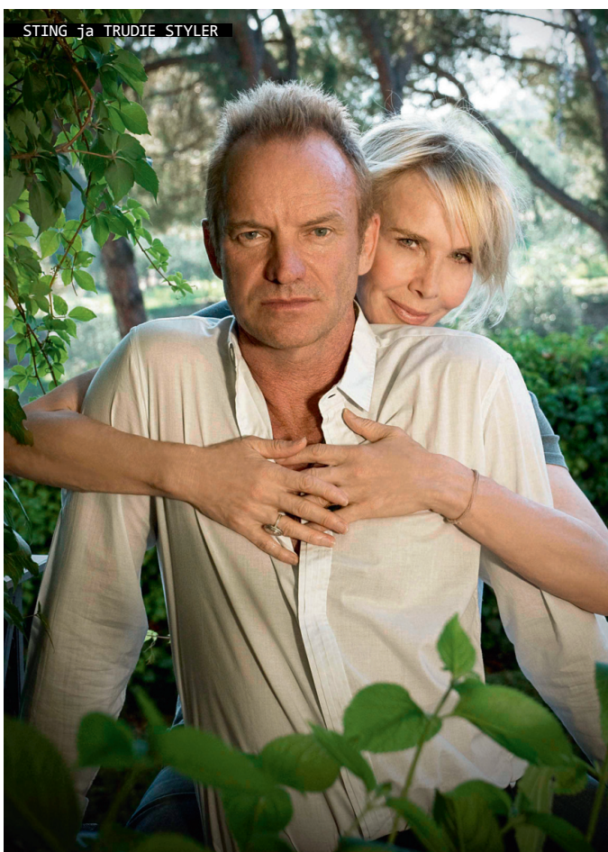
STING ja TRUDIE STYLER