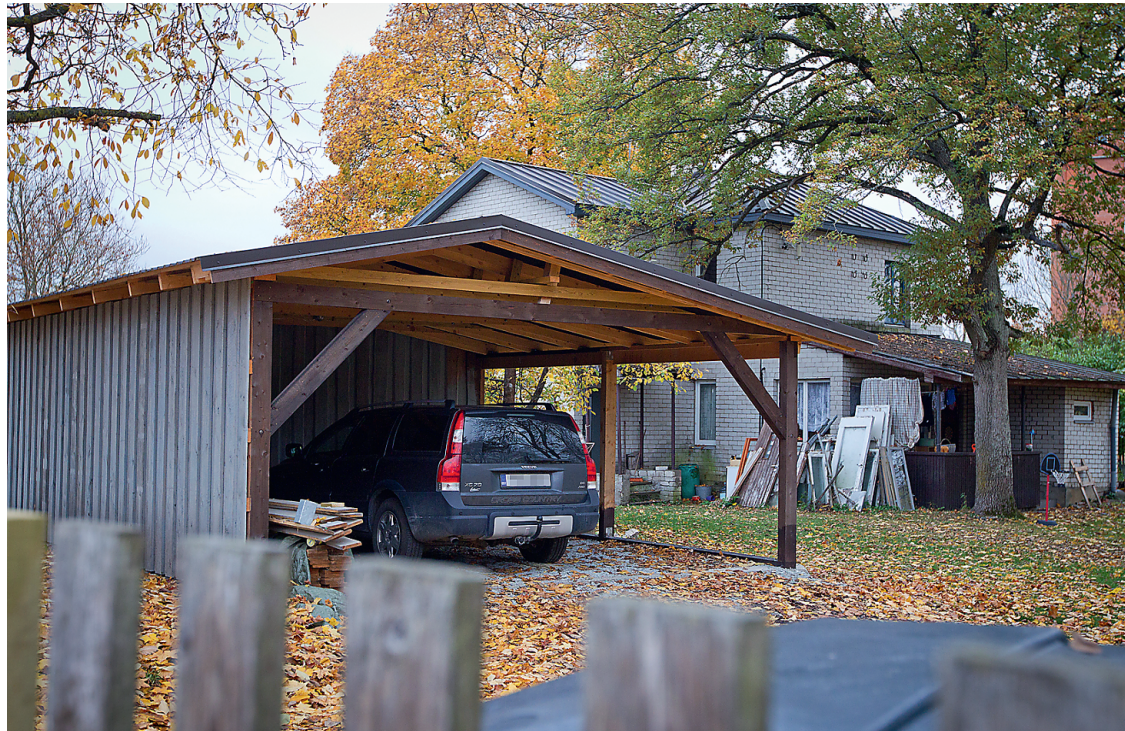
VARJUALUSE plussideks on loomulik ventilatsioon ja pinnas, mistõttu jäävad ära probleemid näiteks lumesulamisveega.