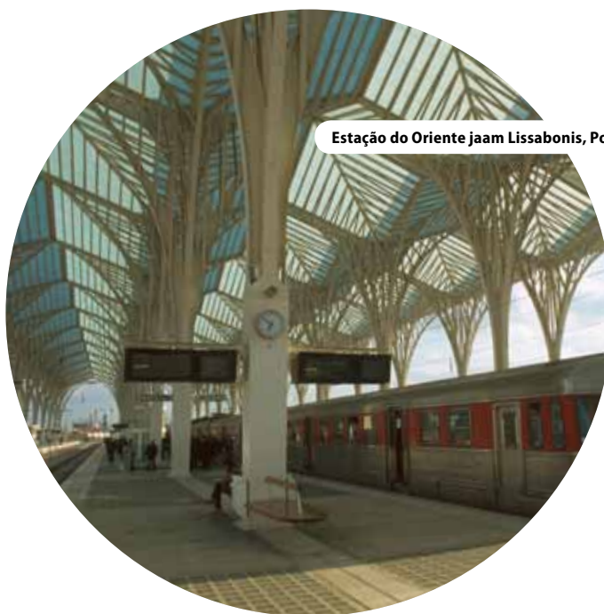
Estação do Oriente jaam Lissabonis, Portugalis

” integreeritud lähenemisviis on raske ülesanne ka baastasandil töötajatele ”