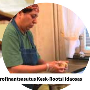
Mikrofinantsasutus Kesk-Rootsi idaosas