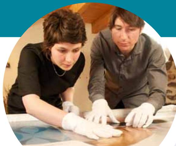
Kiire lairibavõrk Auvergne'is, Prantsusmaal

Videod: http://ec.europa.eu/regional_policy/sources/video/regiostars2010/genk_fr.wmv