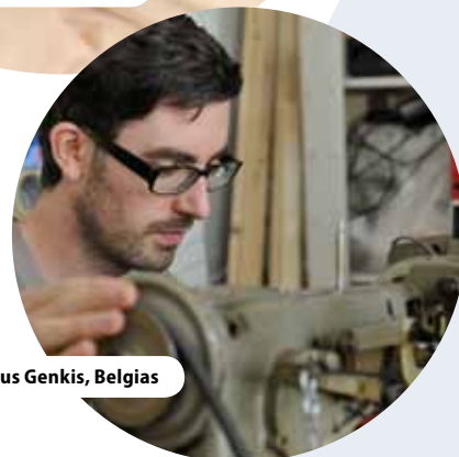
C-Mine'i keskus Genkis, Belgias