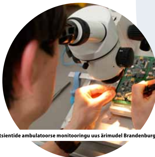
Patsientide ambulatoorse monitooringu uus ärimudel Brandenburgis, Saksamaal