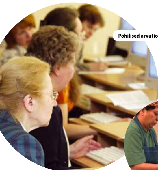
Põhilised arvutioskused Leedu e-kodanikule