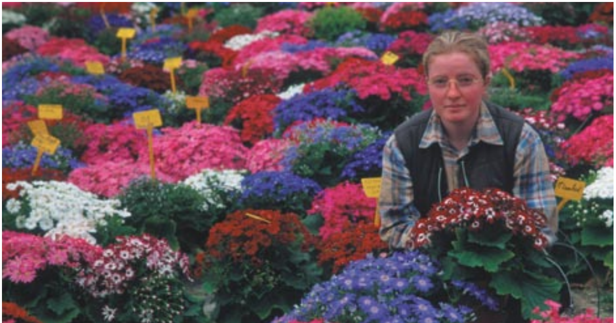
ERDFi poolt kaasrahastatud aiandusalane teadus- ja arendustegevus Barfleur's, Alam-Normandias Prantsusmaal.

Kelle abistamiseks on ühenduse fondid ette nähtud? Kuidas teavitatakse avalikkust struktuurifondidest finantseeritavatest projektidest? Millised on komisjoni ettepanekud Euroopa kodanike nõustamise ja nende osalemise julgustamise suhtes? Milles seisneb regionaalpoliitika peadirektoraadi roll selles pikaajalises protsessis?