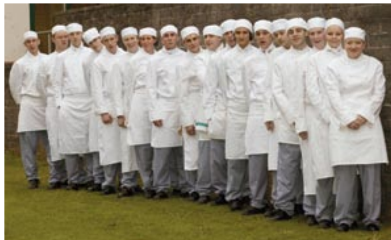
Noori peakoka õpilasi ootab suur tulevik.