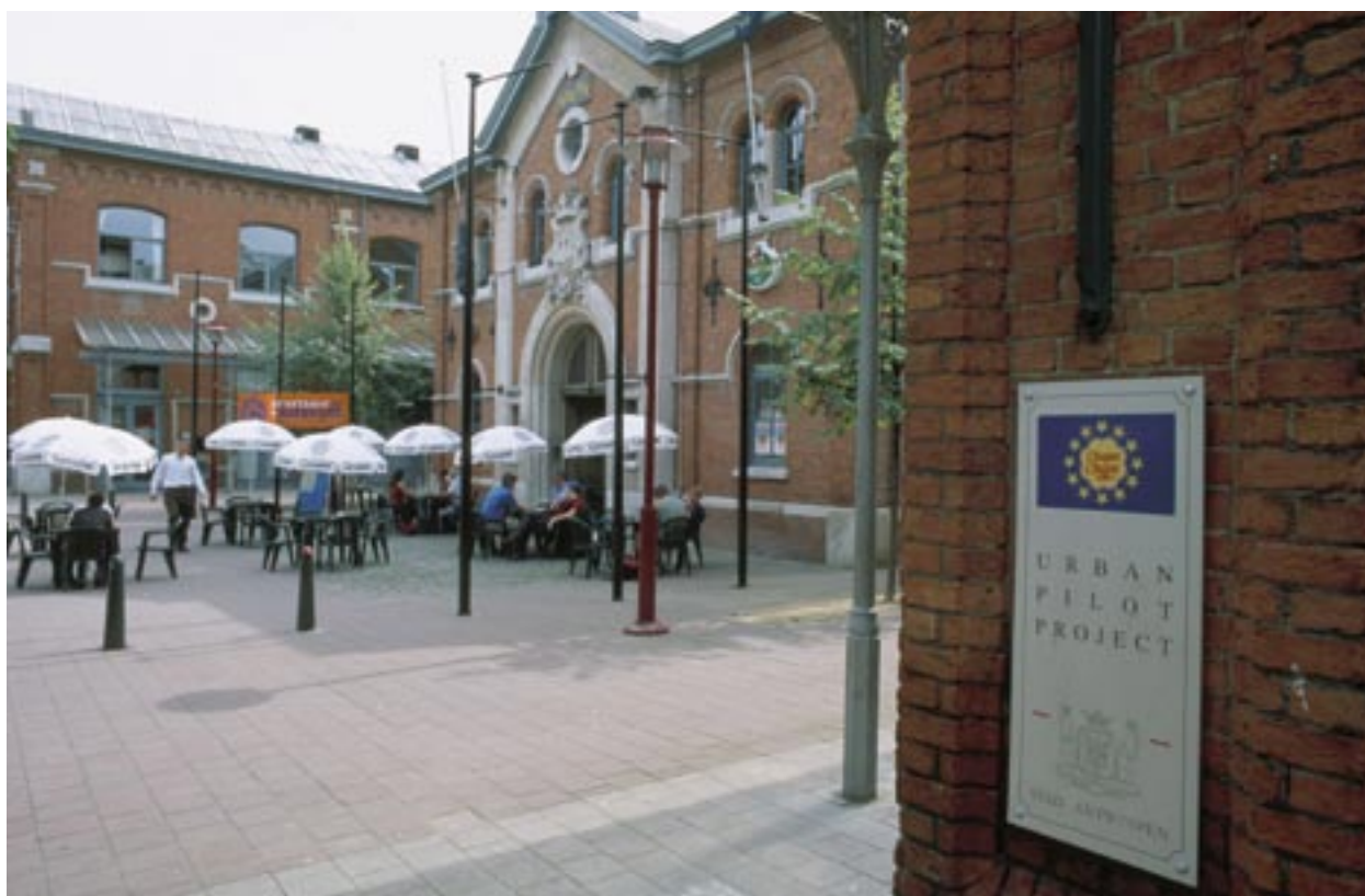
NOA keskus Antwerpenis, Belgias, osutab teenuseid 15 väikeettevõttele koos ümbruskonda teenindava kohvikuga.

Riiklike ja regionaalsete suhtluskorralduse ekspertide koostöö võimaldab parendada struktuurifondide suhtluskorralduse efektiivsust, tõsta projektiettepanekute arvu ja kvaliteeti ning teadlikkust Euroopa Liidu ja selle ühtekuuluvuspoliitika kohta.