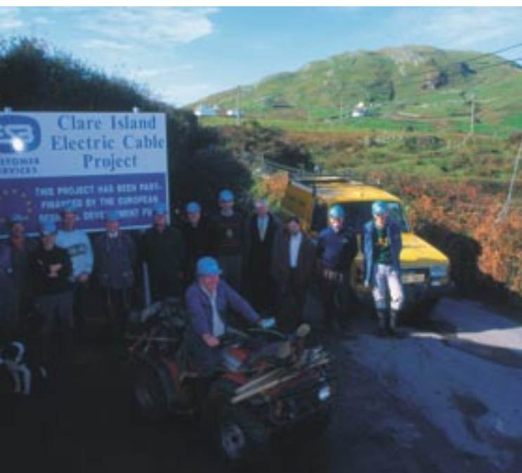
Clare saare elektrifitseerimine Mayo krahvkonnas Iirimaa.

Kõik need tingimused on osaks pikaajalises protsessis, mis lisaks Euroopa fondide kasutamise tõhustamisele on samuti suunatud kodanike sidemete tihendamisele ühenduse institutsioonidega ning Euroopa Liidu demokraatlike aluste konsolideerimisele.