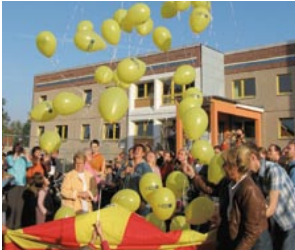
Lastesõime avamine Leipzigi URBAN II piirkonnas, Saksamaal.