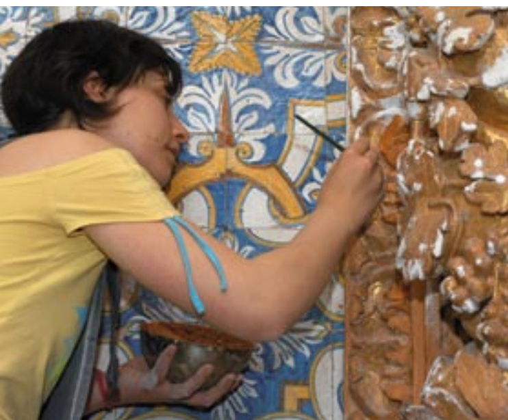
Romaani fresko restaureerimine Sousa orus, Portugalis.

Need kolm elementi leidsid kinnitamist komisjoni poolt 3. mail 2006 vastu võetud „Rohelises raamatus” (Green Paper). Selle dokumendi keskseks teemaks on arvamuste ja ettepanekute kogumine Euroopa kommunikatsioonipoliitika päevakorra väljatöötamise suhtes. See lähenemine on kooskõlas komisjoni poolt 13. oktoobril 2005 avaldatud dokumendiga „Demokraatia plaan D, dialoog ja arutelu” („Plan D for Democracy, Dialogue and Debate”) julgustamaks kodanike aktiivsemat osalemist Euroopa arengusuundade arutamisel. Plaan D kujutab endast esimest etappi pikaajalises protsessis Euroopa Liidu demokraatlike aluste konsolideerumisel ning nende kinnistamisel kodanike väärtushinnangutes ja ootustes.