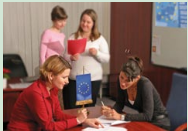
Ungari NDA suhtekorraldusrühm töötamas.