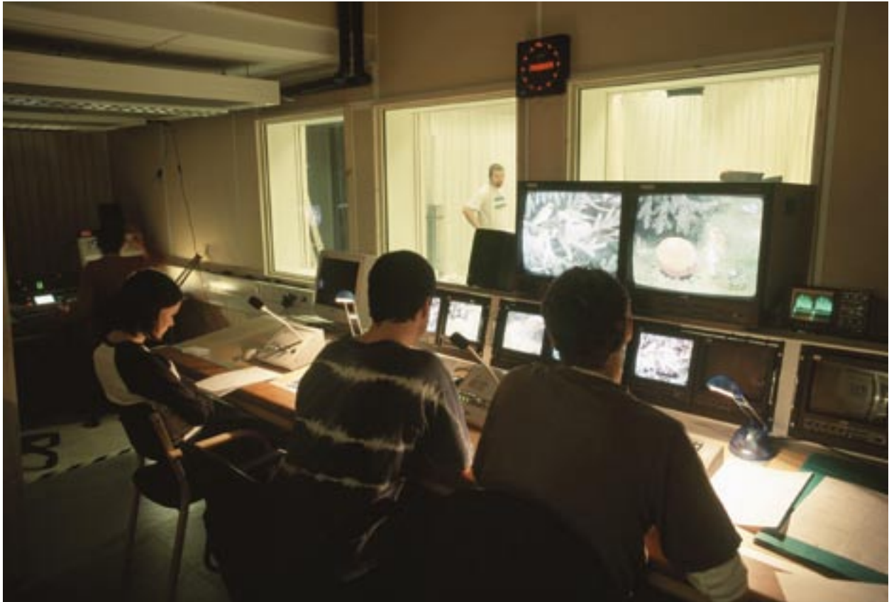
■ Digitaal tehnoloogiaalane haridus: TV-töötajate väljaõpe Västernorrlandis, Rootsis.

Uued eeskirjad perioodiks 2007–2013 näevad ette teavitamiskava koostamise, kus üksikasjaliselt kirjeldatakse mis tahes võimaliku tühniku täitmiseks vajalikke teabe- ja tutvustusmeetmeid. Selles tuleb samuti kindlaks määrata kõikide erinevate osalejate rollid ja vastutus. Igas korraldusasutuses määratakse teabemeetmete rakendamise eest vastutav isik teabevahetuse parendamiseks liikmesriikide ja komisjoni vahel teavitus- ja tutvustusmeetmete osas. Selleks on komisjoni käsutuses INFORM ülesandega viia kokku korraldusasutustes kommunikatsiooni eest vastutavad ametnikud.