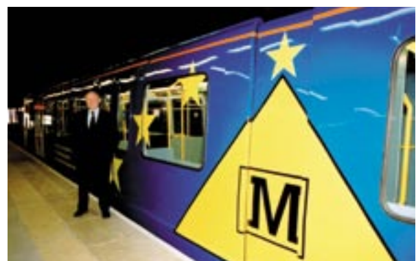
Mitmel vagunil Suderlandi uues metros Inglismaal on kasutatud ELi värve.