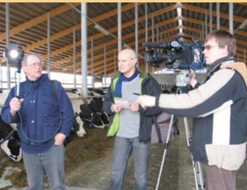
Reportaaži filmimine Läti talus.

Mõlemal saatel on suurepärased reitingud. Selle alustamisel 2005. aastal jõudis raadiosaade 10%-ni kõigist raadiokuulajatest ehk 45 000 kuulajani ning 2006. aasta lõpuks kuulas seda 7,3% ehk 35 400 inimest. TV-programmi vaatas 2005. aastal 25% TV-vaatajatest ning 2006. aastal tõusis see näitaja veelgi, kuni 33% ehk 230 000 vaatajani. 2006. aasta lõpuks oli riigitelevisionis ja raadios kokku esitatud 99 raadio- ja 41 TV-programmi. Igaühel on võimalus osaleda meelikõitvas Eurobussi reisis või keerata Euroopa fondide võtmeid Euroopa fondide veebilehel www.esfondi.lv , klõpsates paremal asuvat TV või raadio ribareklaami leheküljel http://www.esfondi.lv/page.php?id=698 .