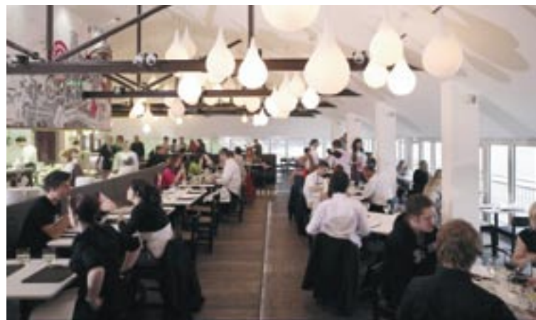
Kliendid nautivad „Fifteenis” kõrgkokakunsti.