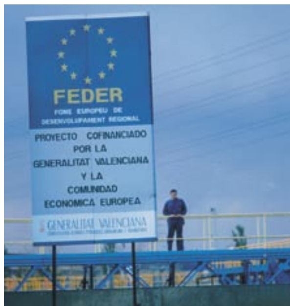
ELi fondide reklaam Hispaanias.

abisaajate nimekirja kandmiseks. Need nimekirjad koos projektide nimetustega ja neile iga tegevuse jaoks eraldatud riikliku toetuse summadega kuuluvad avaldamisele vastavalt nimetatud määruse artiklile 7.2.(d).