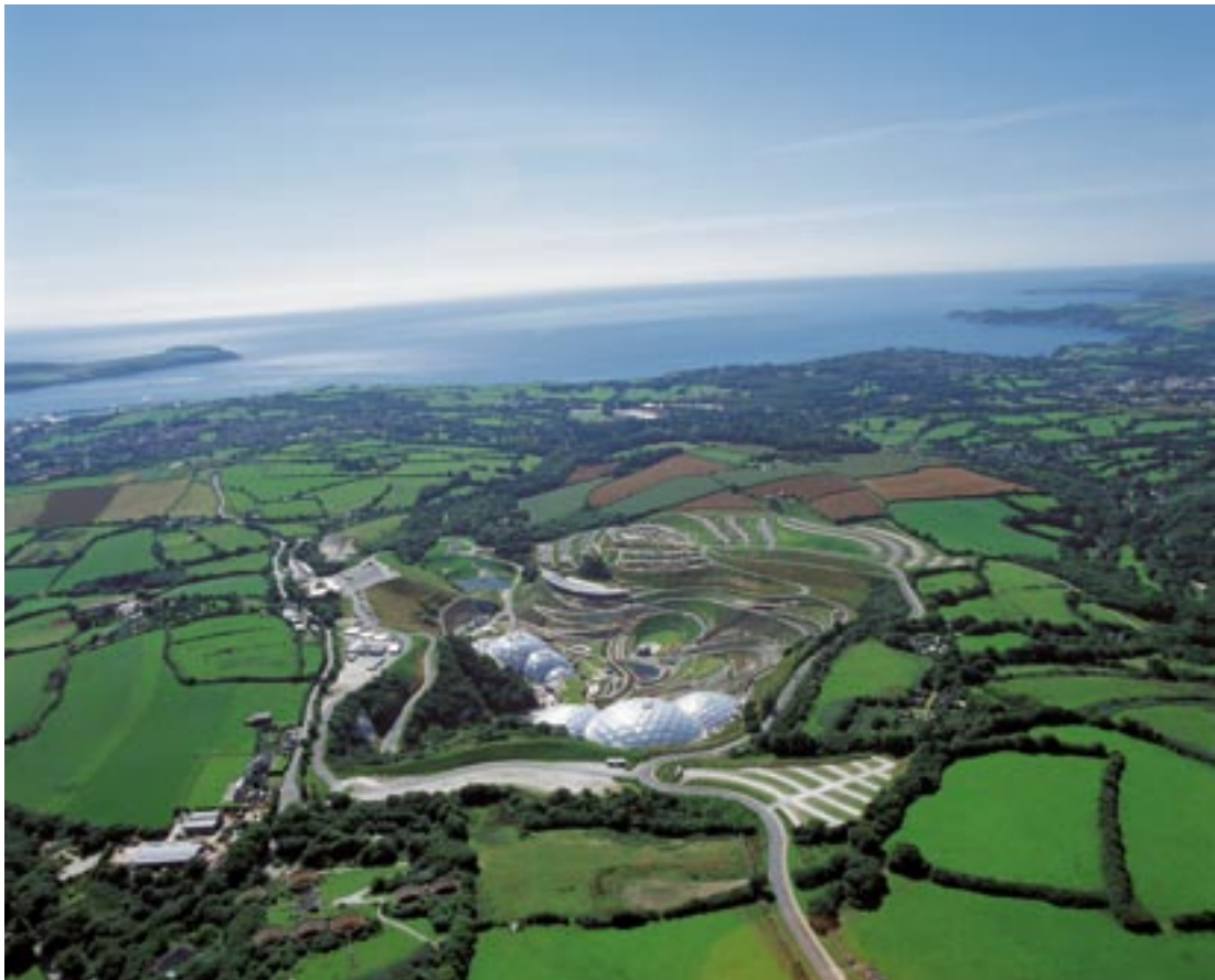
Eedeni projekti panoraamvaade St Austelli lähedal.

Cornwalli ja Scilly saarte regioon kui sihtala 1 raames abisaaja aastatel 2000–2006 ja konvergenksi sihtala raames abikõlblik aastateks 2007–2013 elab üle tõelist sotsiaalmajanduslikku taassündi. Kriisiseisundis, peamiselt oma põhiressurssidest ja turismist sõltuvast maapiirkonnast on Inglismaa „Finistere” teostamas üleminekut teadmispõhisele majandusele, teadvustades avatuse, mitmekesisuse, innovaatika ja kvaliteedi väärtusi.