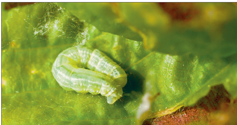
Hariliku külmavaksiku röövik.

kud võrgendi abil puudelt maha ja poevad mulda nukkuma. Järgmise põlvkonna liblikad kooruvad septembris-oktoobris. Emased jätavad munad talvituma võrse tipus pungade lähedusse või harunevate okste vahele.