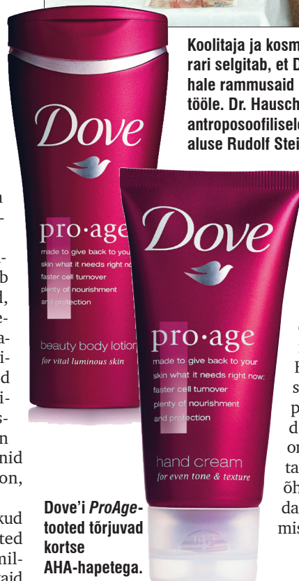
Dove'i ProAge- tooted tõrjuvad kortse AHA-hapetega.