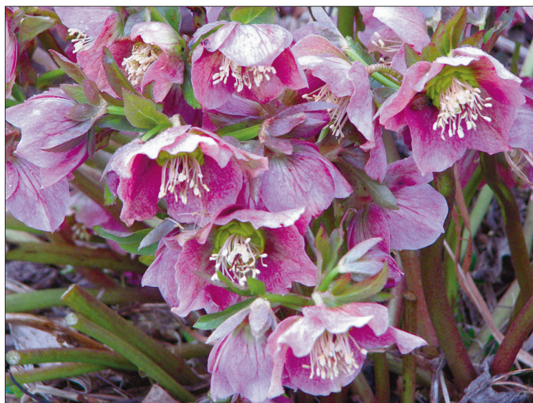
Aed-lumeroos 'Red Lady'.

hed. Olenevalt liigist moodustub südasuveks lehtedest 25–45 cm kõrgune tume- või sinakasroheline kompaktne puhmik, mis säilitab oma kauni välimuse lumeni.