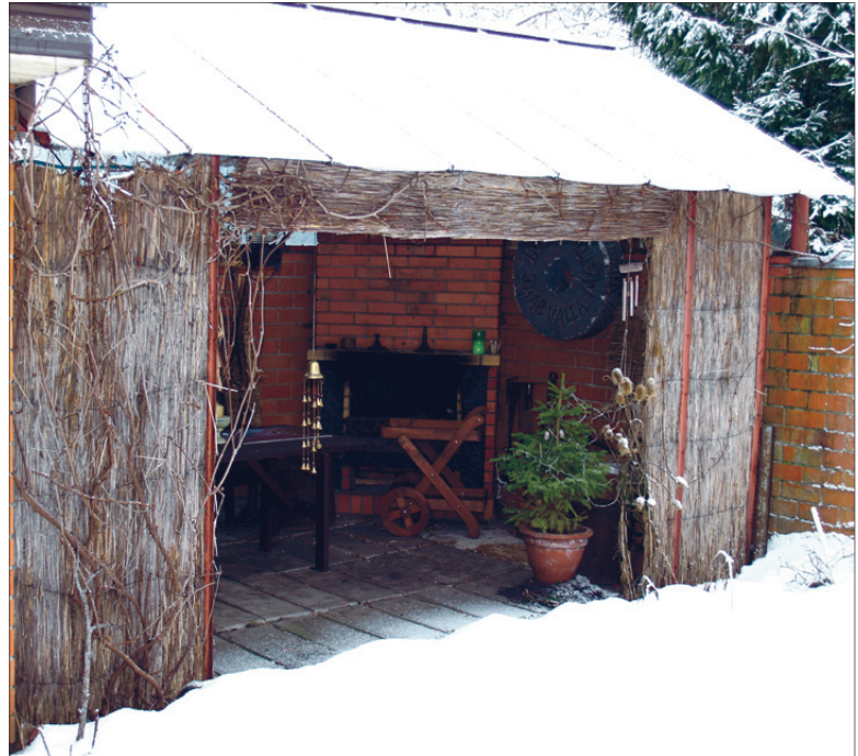
Talvel moodustub varjualusesse puhkenurka omamoodi oaas, kus võib hangede keskel kaminatule ees nautida paukuvat pakast.

Katusega lehtlaterrassi avaus (4 x 2 m) sai algul ette presentkattega eesriide, et kamin ning lauadtoolid talvel lume alla ei mattuks. Siis aga märkasime, et sellisel teatrilava eesriidel pole suuremat mõtet, kuna mere poolt tulevad tuisuhood millegipärast terrassile ei tunginudki.