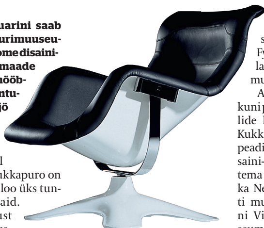
1964. aastal disainitud tugitool Karuselli.

1933. aastal sündinud Yrjö Kukkapuro on Soome disainiajaloo üks tuntumaid esindajaid. Tema loomingust moodustab suurema osa istemööbel. Esimest korda nii suures mahus Eestisse toodud mööblinäitusel eksponeeritakse üle 60 erineva tooli: esindatud on nii kontori- kui ka söögilauatoolid, samuti tugitoolid, diivanid, unikaalsed prototüübid