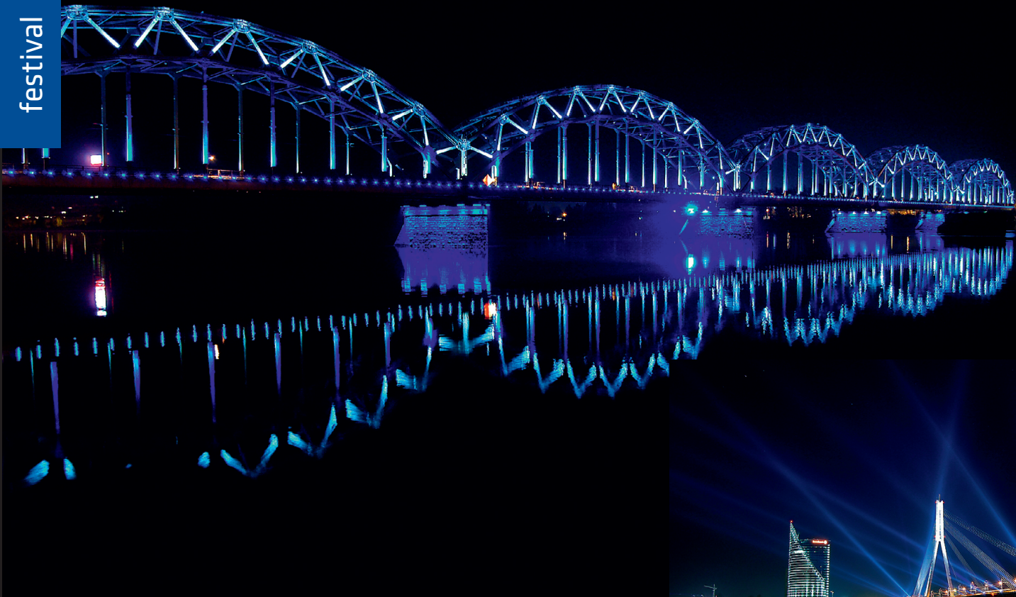
Valgusfestival "Staro Riga" ehk "Sära, Riia".