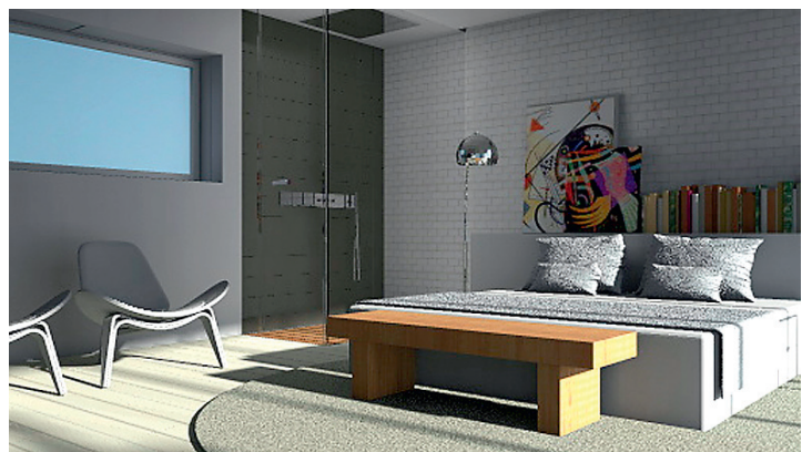
← Voodile valitud pleed ja padjad ning ruumi paigutatud toolid ja maalid kannavad endas kodust atmosfääri.