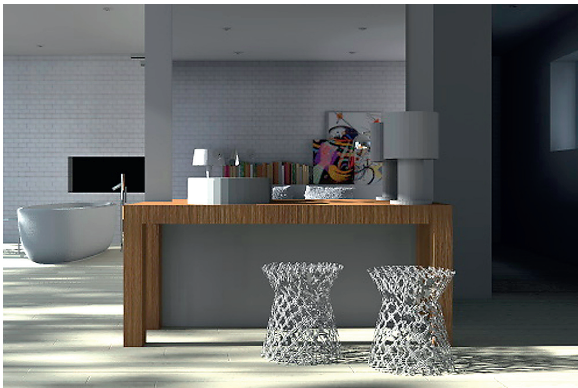
← Minimalistlik mööbel lubab sooleerida ruumil ja valitud sanitaartehnikal.