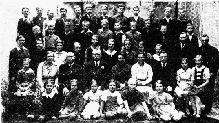
Tallinna Linna 18. algkooli IV kl. õpilasgrupp 1938. a.