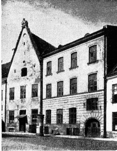
Tallinna Linna 18. algkool, Lai tn. 25.