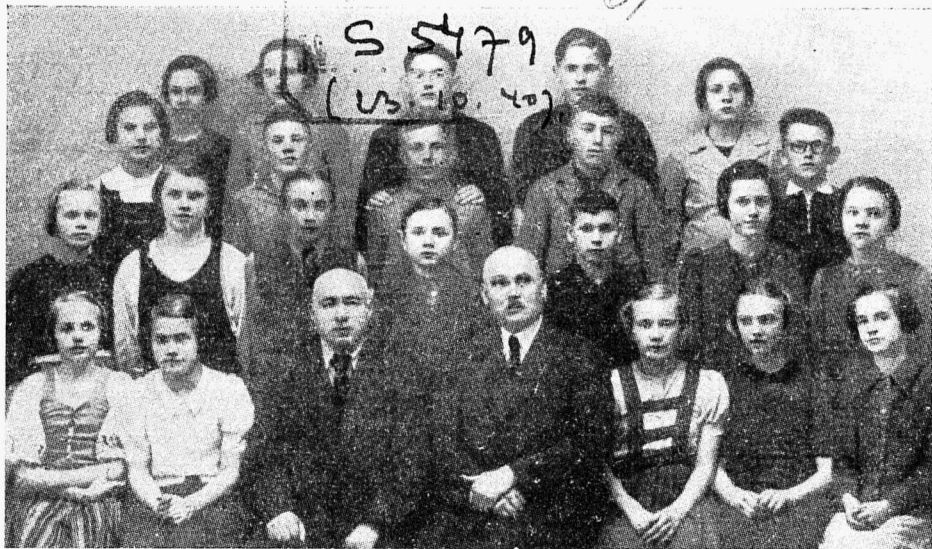
Tallinna Linna 18. Algkooli V kl. õpilasgrupp 1939. a.