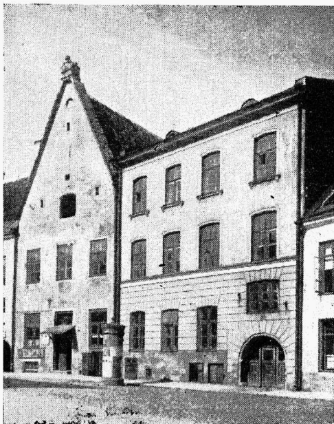
Tallinna Linna 18. Algkool, Lai tn. 25.