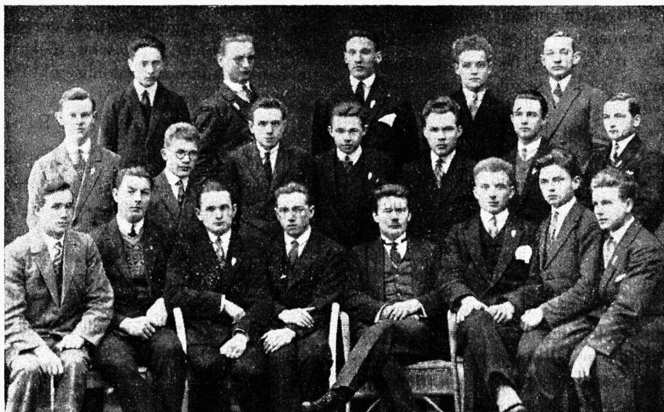
Õpilaskonna juhatus ja tegevusorganite juhid a. 1927./28.

Liikmeid üle saja. Olles suurem ja huvipakuvam ring koolis, on ta töö laiaulatuselisem ja mitmekesisem kui teistes ringides. Korraldas „Kalevi“ uisuteel õpilasohtuid; korraldab kooli võimlas iganädalalisi võimlemistunde ja kursusi. Väärivad tähelepanu vehklemiskursus ja täpsed ning distsipliinirikkad harjutustunnid. Hääks abinõuks ringile ta eesmärke saavutamisel on ta keskpärane tagavara spordivarustist. Ringis on rõhku