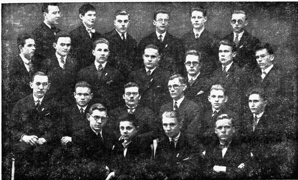
Õpilaskonna juhatus ja tegevusorganite juhid 1929.130. õppeaastal.

Esimesel koolipäeval pääle pühi vaevalt muud tehti, kui »Miilangut« loeti, sirviti, vahiti. Mitte ainult pingi all, ka avalikult, pingil, sest õpetajategi huvi »Miilangu« vastu oli ilmne. Võrreldi eelmise numb-