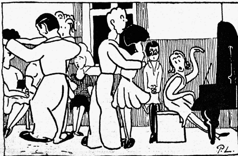
Tund, kus kunägi keegi ei puudu.