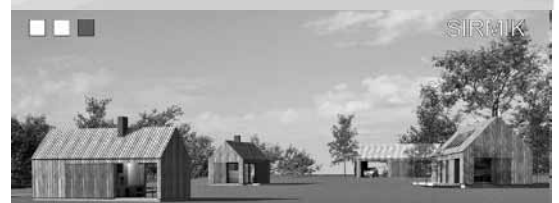
Ülevalt: „Adaptatsioon”, „Akupunktuur”, „Ranna-Niidu”, „Sirmik”.