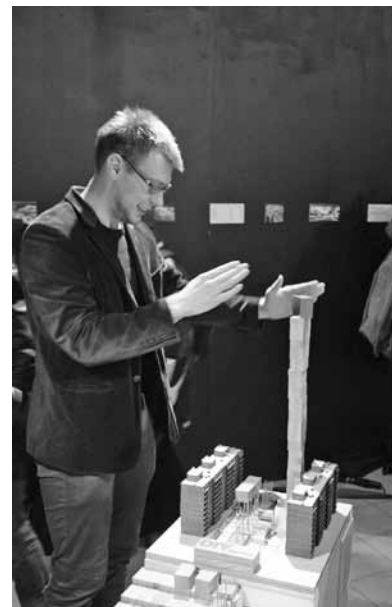
Aastanäitus „LASN”.

Näituse kataloog hinnaga viis eurot on müügil EALi kontoris.