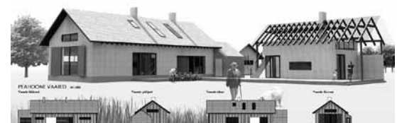
Ranna - Niidu