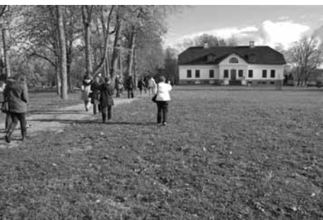
Maakonnapäev Raplamaanal.

12. oktoobril 2012 toimus EALi järjekordne maakonnapäev, mis viis seekord huvilised Raplamaanale.