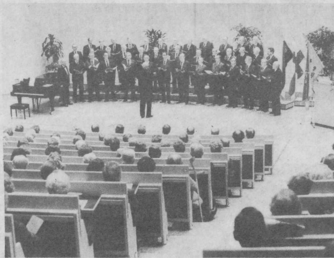
◆ Esinemine Joensuus

Menukate kontsertidega esineti Lappeenranta, Imatra, Joensuu, Lieksa, Nurmese ja Kajaani esindussaalides, lisaks veel arvukatel