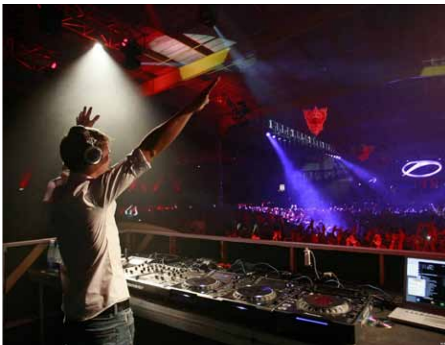
DJ tööpostil – Armin van Buuren.

CD tulek pööras pea peale muusikatööstuse tollase ärimudeli ning paradoksaalsel kombel on sama juhtumas ka nüüd, kui CDde müük on tasapisi hääbumas ning enustuste kohaselt võivad neist juba kolmekümne aasta pärast saada kollektsionääride silmis tuhandeid dollareid väärt unikumid. Helikandjate ajaloo viimaseks suureks