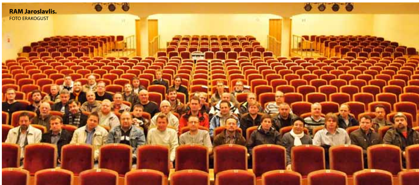
RAM Jaroslavis.