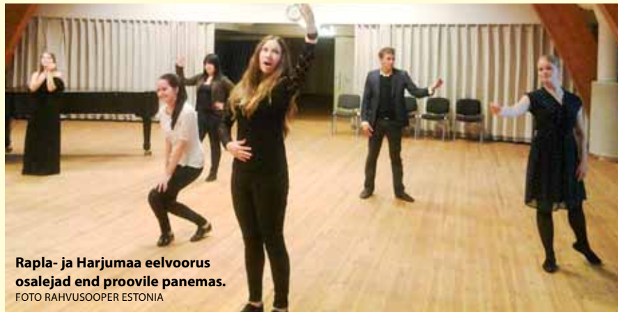
Rapla- ja Harjumaa eelvoorud osalejad end proovile panemas.