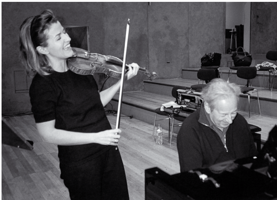
Anne-Sophie Mutter ja André Previn.

misel kaoks paljudel lastel võimalus muusikat õppida. Saksamaal on riiklike muusikakoolide õppemaks eraturundidest palju odavam, kuid paljudele soovijatele neis kahjuks kohti ei jätku. Kui niigi kallimate eraturundide hind tõuseks veel viiendiku võrra, jääksid paljud lapsed muusikaharidusest ilma. Saksamaal üldiselt pooldatakse, et iga laps saaks pilli õppida ja kasvõi algelise muusikalise hariduse, uus käibemaksuseadus töötaks selle põhimõtte vastu.