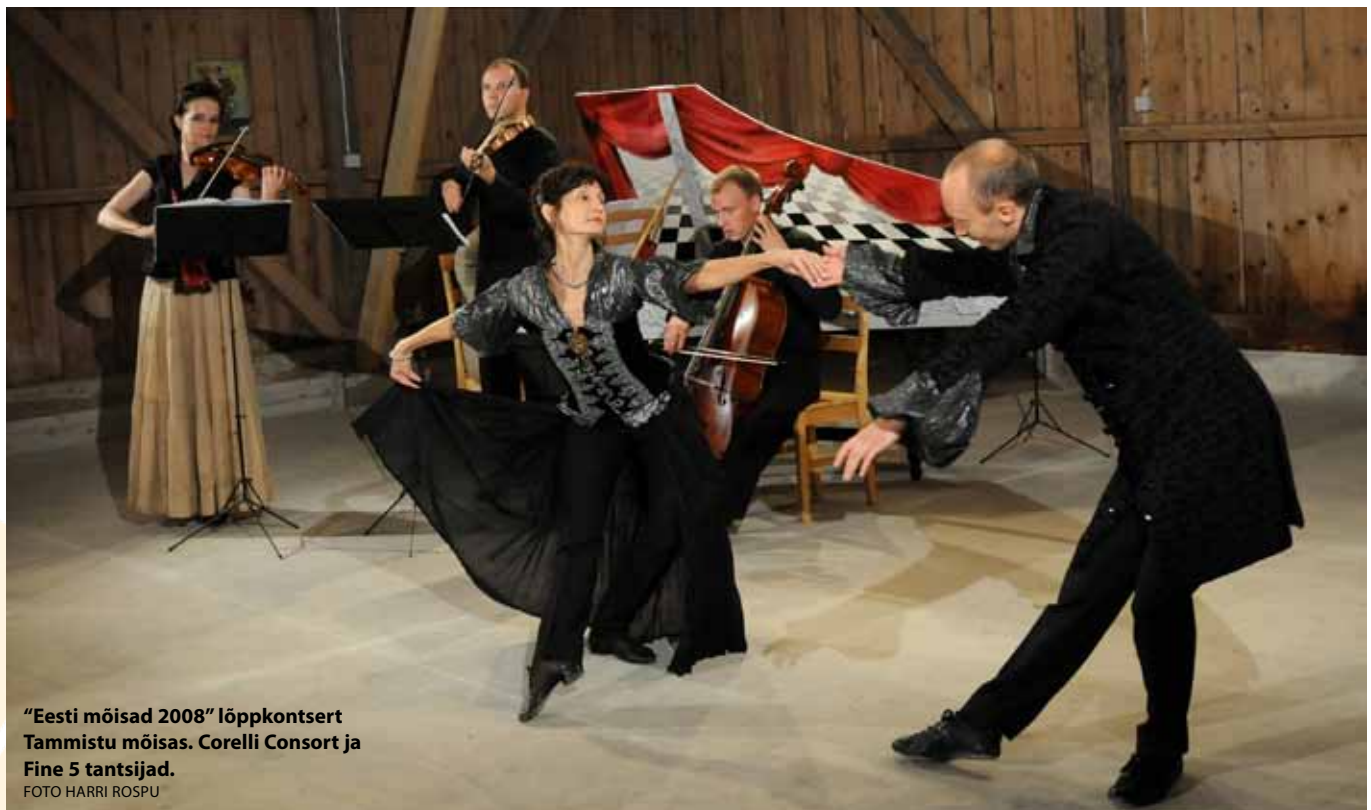
"Eesti mõisad 2008" lõppkontsert Tammistu mõisas. Corelli Consort ja Fine 5 tantsijad.

Me tahame panna kokku ajaloolise tausta laiemalt, nagu umbes sel ajal, kui mõisad ehitati, võis muusika seal kõlada. Need hooned on ajalooliselt seotud muusika, loomingu ja mõtletegevusega. Just sellise vaimesuse ma tahaksin muusika kaudu esile tuua.