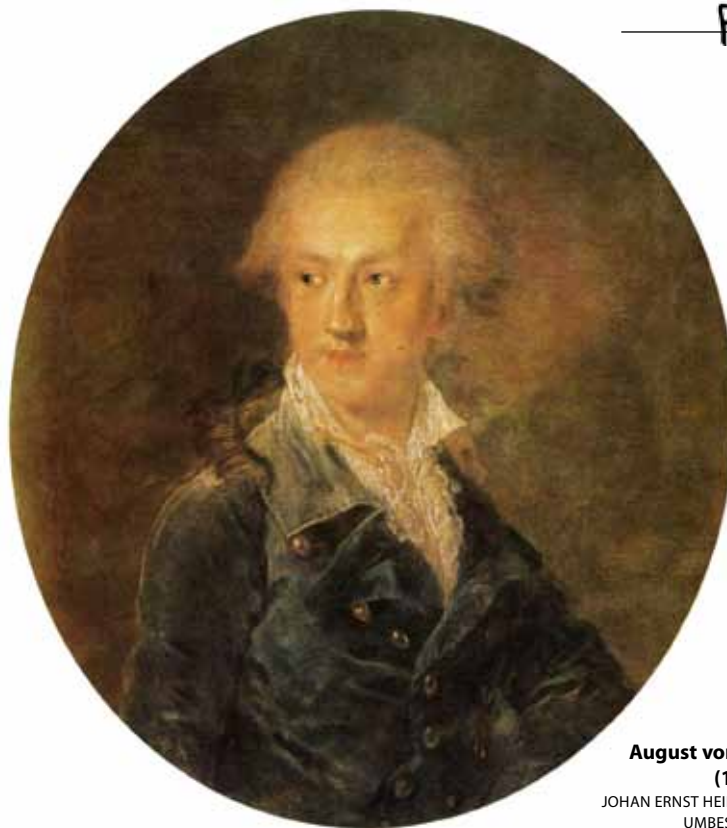
August von Kotzebue (1761–1819) JOHAN ERNST HEINSIUSE MAALIL UMBES 1800. AASTAL.