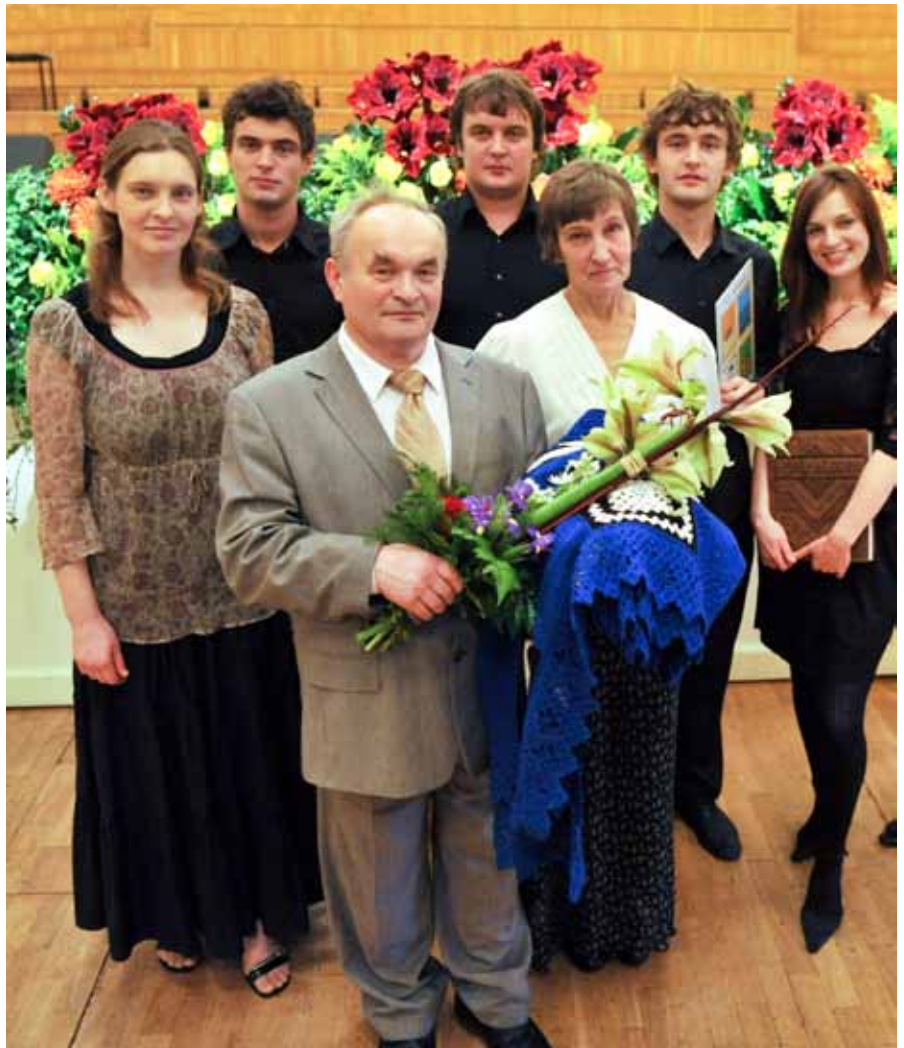
Abikaasa ja lastega aasta isa tseremoonial.