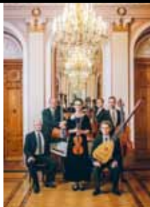
Corelli Consort

Tellimine: AS Express Post Maakri 23A, 10145 Tallinn Tel 617 7717, www.tellimine.ee Tellimisindeks 00679 Otsekorraldus 1,47 eurot number Aastatellimus 21,50 eurot Muusikaõpetajatele ja -õpilastele aastatellimuse soodushind 17 eurot. Soodushind kehtib ka pensionil olevatele muusikaõpetajatele. Tellimine: ia@ema.edu.ee, herje@ema.edu.ee, 6 416 016, 55 56 18 94