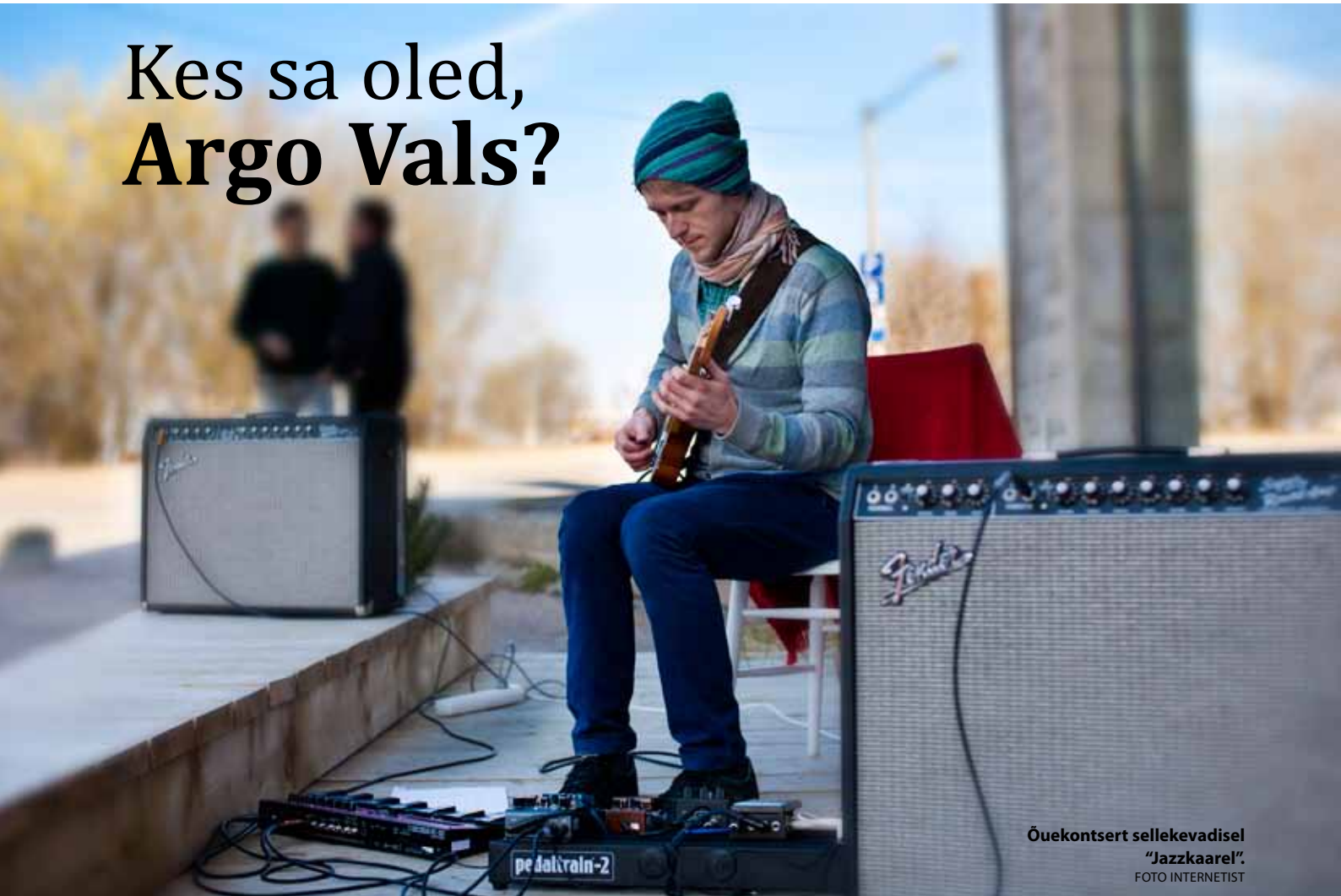
Õuekontsert sellekevadisel "Jazzkaarel".