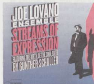
Streams of Expression. Joe Lovano.