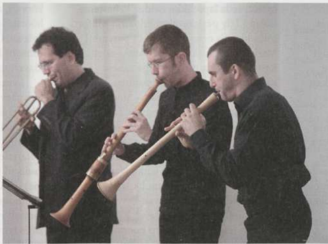
Muusikalised "detektiivid" ansamblist Collinetto andsid lisaks haaravale kontserdile ka sisuka loengu vanadel pillidel mängimisest ja käsikirjade uurimisest.

Tartu vanamuusika festivali hommikused loengud esinejatel on vaat et veelgi sisukamad kui kontserdid. Sattusin Itaalia ansambli Collinetto loengule, kus muusikud avasid ise detailselt ja huvitavalt nii ansambli allikmaterjale kui ka erinevaid vanade käsikirjade interpreteerimise viise. Lähemalt sai tutvuda kõikide instrumentidega, mida öhtusel kontserdil võis kuulda, ning ka instrumentaaliilidega, mis iga pilli partiisid iseloomustas. Vaatasime slaide vanadest reprodetsioonidest, mis kujutasid musitseerimist 15. sajandi püüdel ja linnas. Muusikud rääkisid põnevalt oma "detektiivitööst" vanade materjalide elustamisel: keegi pole ju kuulnud, kuidas vanad käsikirjalised noodid tegelikult kõlasid, teoreetikud ei kirjeldanud praktikuid, vaid tegelesid teadusega. Ometi olid 15. sajandil mõned mängijad väga kuulsad, ja enamikus ansamblites oli kolm mängijat – pluss veel üks liige, kes tegi massaaži! Mõnest käsikirjast on leitud ka märkmeid muusika juurde käiva koreograafia kohta. Ansambel Collinetto esinebki Itaalias sageli koos tantsijatega, samuti käib muusikute professioni juurde tantsude tundmine ja oskamine. Ainult tantsutuba olekski veel vanamuusika festivali juurde osanud soovida. Aga ehk mõni teine kord?