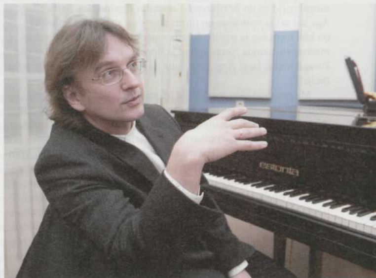
Peaa siin Tartus oma missiooni ära tabama.

Minu arvates on inimese elus kindlad hetked, mis muudavad saatust. Oli hetk, kui ma esimese klarneti kätte sain ja sellega mitte midagi ei osanud teha, see oli umbes neljandas klassis. See oli ühe peretuttava klarnet, tollal ma ise mängisin puhkpilliorkestris. Mulle meeldis väiksena, kui puhkpilliorkester kusagil mängis. Jooksin alati sinna ja võisin lõpmatult seista ja vaadata. Ükskord oli kõrvalmajas matus ja kui orkester mängis, siis mina olin kisanud, et emaisa, tulge ruttu, ja olin nii õnnelik, et orkester mängib. Niisiis, 28.