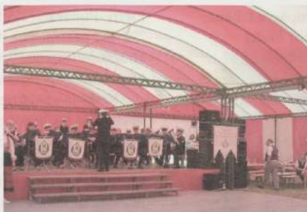
Tallinna Tuletõrjeühingu orkester festivalitelgi laval mänguhoos.