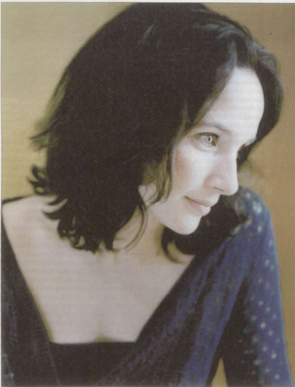
Héléne Grimaud – ehe ja ainulaadne.

Grimaud' jaoks ei tähenda kirjutamine muusika reetmist. Muusika ja kirjandus on talle sellesama kanga välis- ja sisekülj.