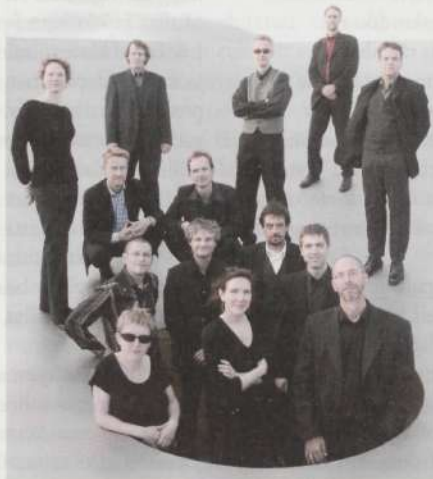
Ansambli musikFabrik hoogne mäng klappis suurepäraselt vitaalse juubilariga Mauricio Kageli loominguga.

Viimastel aastatel on Kagel siiski tegelnud ülekaalukalt n-õ puhta (või peaaegu puhta) muusikaga, kus teatralsete