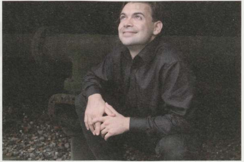
Horvaatia pianist Dejan Lazic oli festivali põnev üllataja.