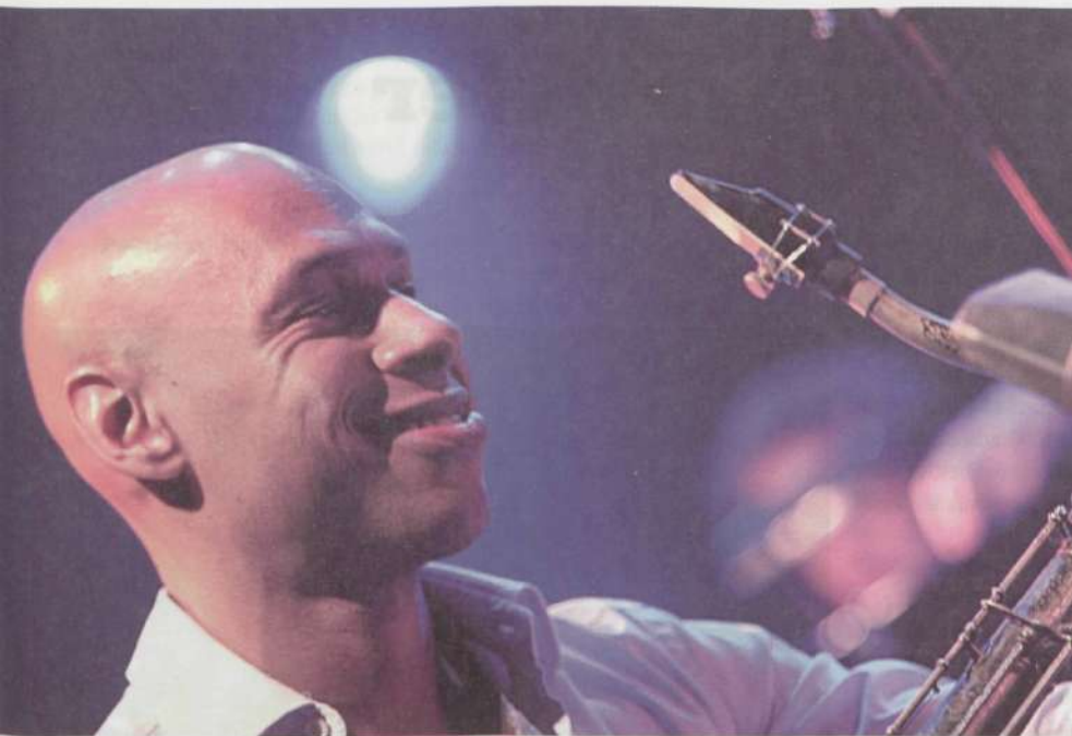
Joshua Redman tenorsaksiga