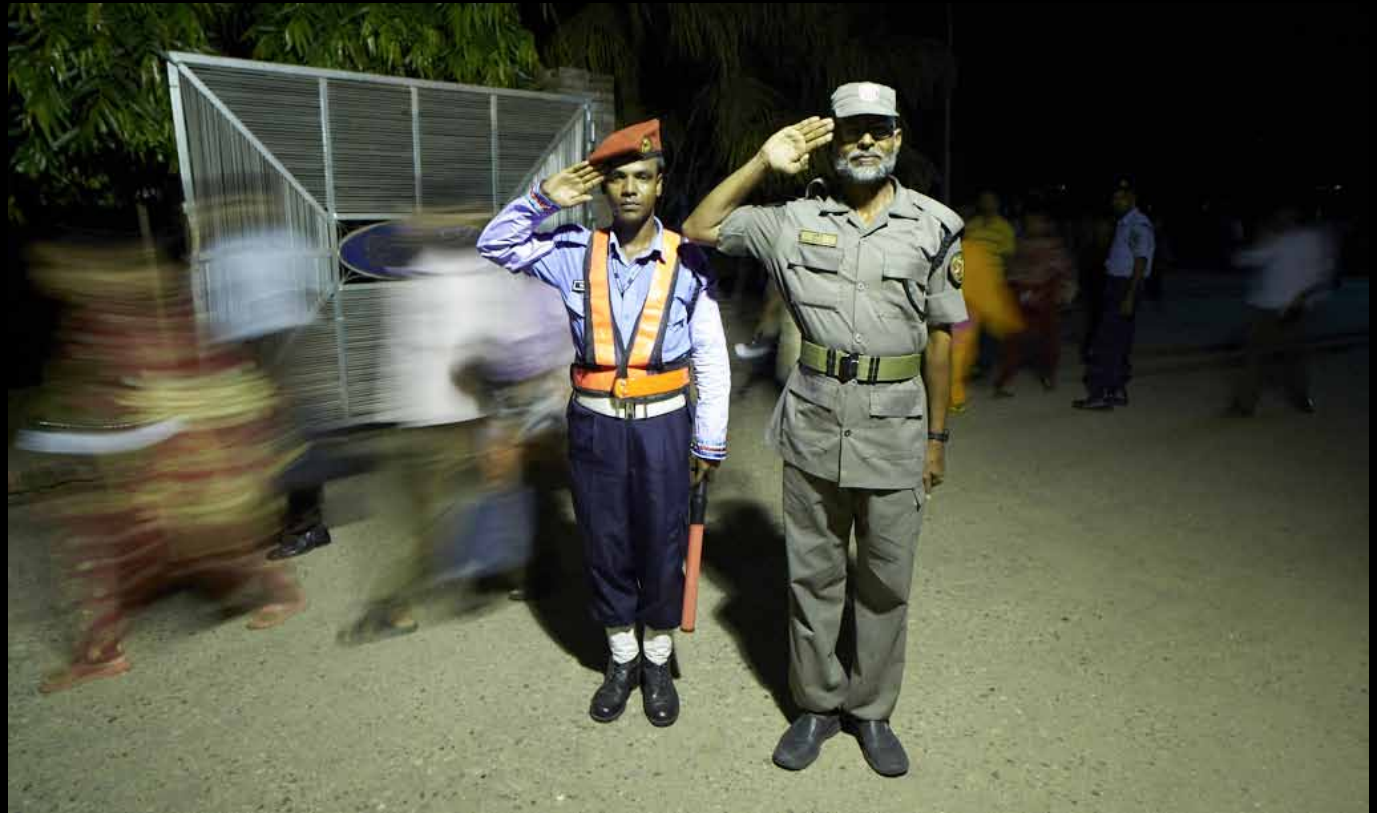
TEKSATEHASE PAEAESLAS (PUNKT)