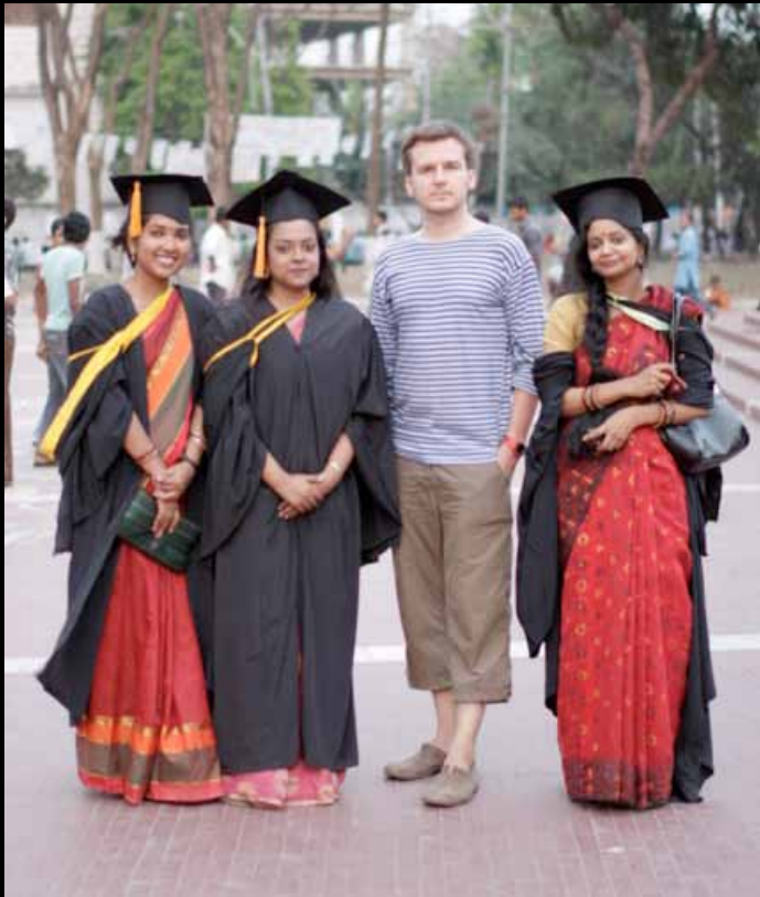
KILMI VAAERIKATE NAEITSIKUTEGA (PUNKT)