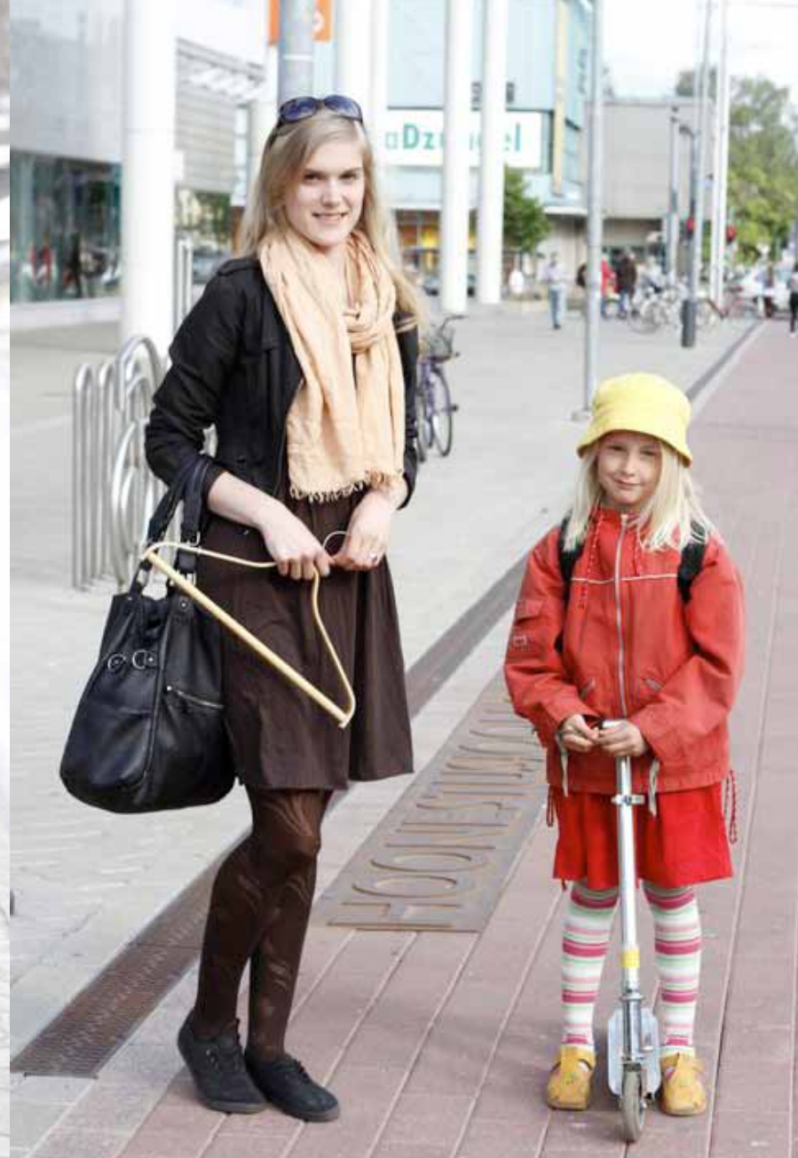
õed LAANE RETi (17) ja IIRIS (6) Kesklinn