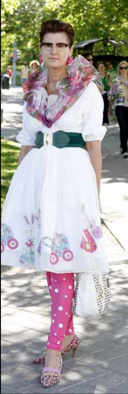
AILI (49) Kesklinn