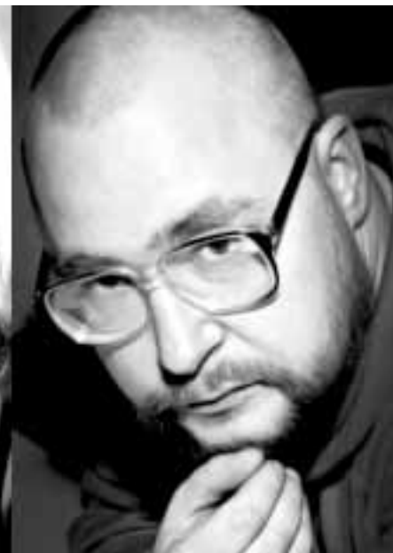
ANDRES KEIL FOTOGRAAF Pimik