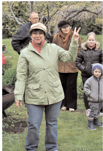
Tallinna koguduse Alfa-kursuse kümnenda aastapäeva tähistamine 26. mail 2013.