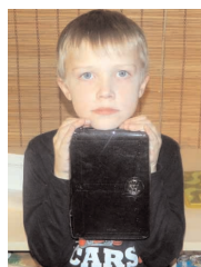
Joel Korea-keelse Piibliga

Pärast 2010. aasta kevadet, kui isa käis Põhja-Korea piiril, olen igal õhtul palvetanud selle pärast, et Põhja-Korea võiks saada vabaks. Ühel päeval tuli mul mõte saata Põhja-Korea presidendile Piibel – lootuses, et kui ta selle saab, siis hakkab ta seda lugema, temast saab kristlane ja ta lõpetab kõik need vägi-