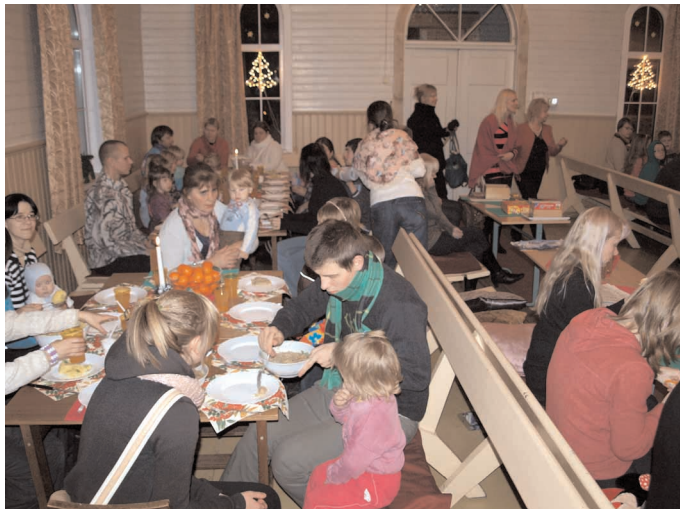
Jõululõuna Rakvere koguduses.

Käime koos peamiselt viiest Rakvere kogudusest ja järjest kõigis neis kirikutes, oleme õppinud üksteist tundma, armastama ja järjest rohkem keskenduma sellele, et tunnustame üht Päästjat ja Kuningat, meie Jeesust Kristust ja