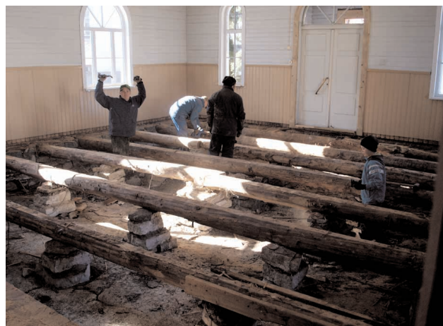
Kevad on Rakvere koguduses möödunud põrandaehituse tähe all. Ajakirja ilmumise ajaks on töö juba valmis.

Vana põranda üleskiskumisel oli tore meestevägi kohal. Praegu peame teenistusi tagatoas ja parajad virnad asju on kõigis ruumides. Aga asi edeneb. Õnnistust armsale vennale Loksa kogudusest, kes selle töö on ette võtnud ja seda täie pühendumisega teeb.