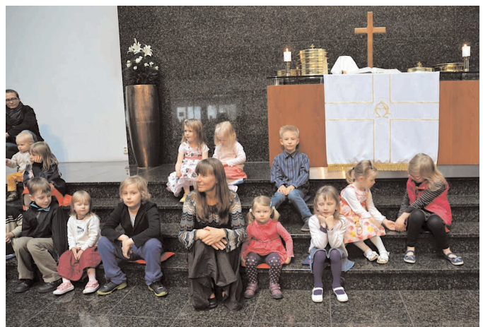
Tallinna pühapäevakooli lapsed