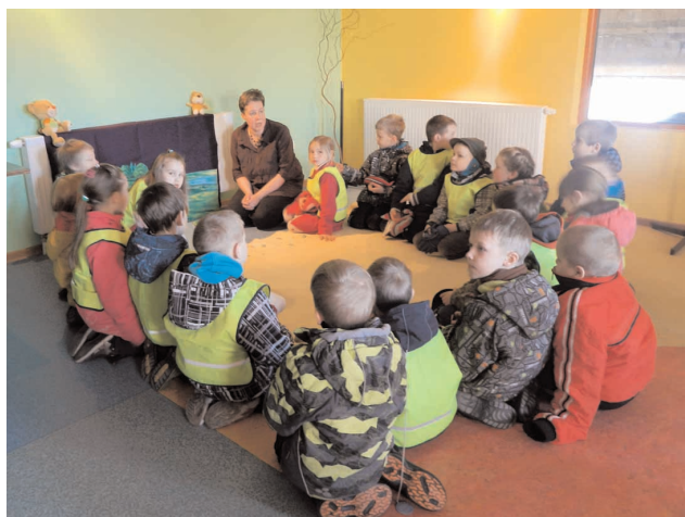
Võru Päkapiku lasteaia Hampeli rühma lapsed suurel neljapäeval kirikus külas, pühade lugu kuulamas.