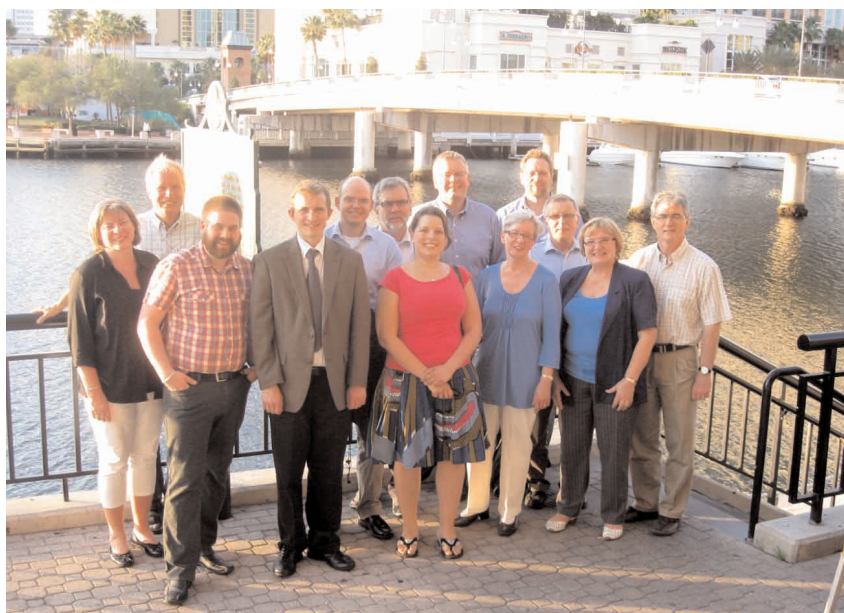
Põhjamaade ja Baltikumi delegaadid 2012. aasta peakonverentsil.

Pärast öhtusöögipausi kogunesime juba töiste asjade juurde, millest üks esimesi oli konverentsi töökorralduse reeglite kinnitamine. See võttis paraku oluliselt rohkem aega, kui selleks arvestatud oli, seega lõpetasime päeva ilma selguseta reeglite osas ja pidime uuel hommikul (kolmapäeval) pärast piiskoppide, ilmikute ja noorte pidulikke avapöördumisi konverentsi poole taas reeglite teemaga jätkama. Viivituse tõttu läks ühtlasi sassi kogu kolmapäevane päevakava ja seadusandlikud komisjonid pidid kiirustades oma juhid ära valima, et jääks veel piisavalt aega neid järgmise päeva hommikul algavateks töökoosolekuteks ette valmistada. Ühtlasi lühendati oluliselt pealelõunasse planeeritud erilist osa – niinimetatud “pühasid kõnelusi” ( holy conferencing ) väikestes gruppides. Nende kõneluste mõtteks oli lihtsalt ja inimlikult vestelda selliste kaalukate ja pingeteketavate teemade üle nagu metodistlik identiteet ja inimese seksuaalsus. Kavatus oli küll hea, aga ajalise surve tõttu tekkis mitmesuguseid pingeid ja paraku ka rahulolematust.