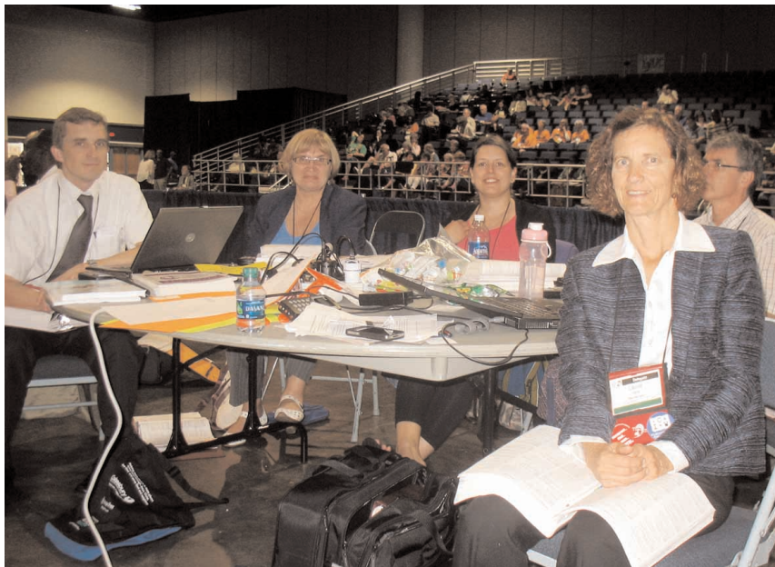
EMK delegaadid peakonverentsi suures saalis.

Ülestõusmise murrangu Jumal, see peakonverents pole mitte meie oma, vaid sinu oma. Ainult sinu tahe on määrav. Vii meid kokku nendega, kellega sina tahad meid sellel päeval kokku viia. Aseta meid oma töösse, lase meil osa saada sinu valust. Lase meil välja minna sinu nimel või teelt kõrvale hoida sinu nimel, kogeda sinu nimel edu või sinu nimel lüüasa-