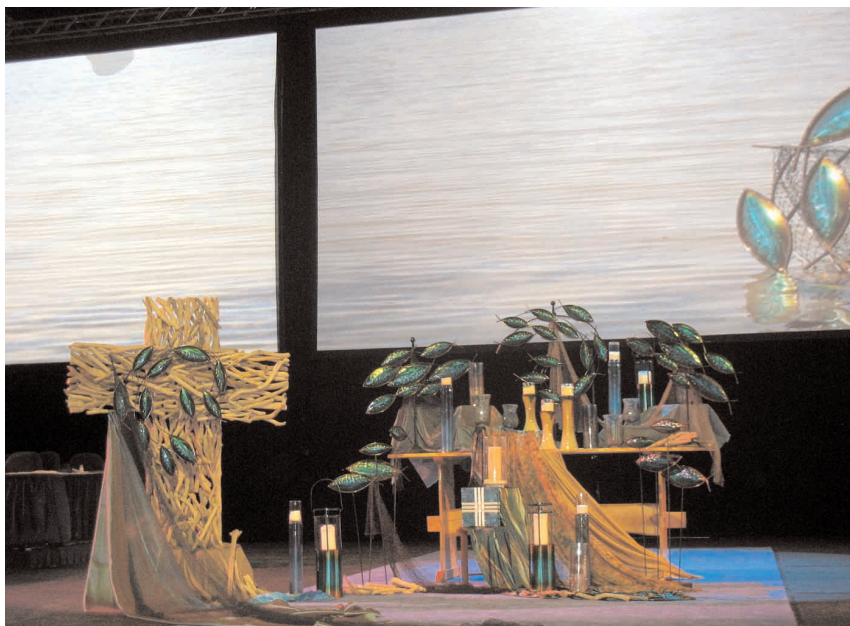
Peakonverentsi jumalateenistused olid väga detailselt ja loominguiliselt ette valmistatud – kasutati rohkesti mere ja veega seonduvaid sümboteid.

Pühapäev oli konverentsitöös hingamispäev, oli võimalus külastada mitmeid kirikuid või lihtsalt iseenda