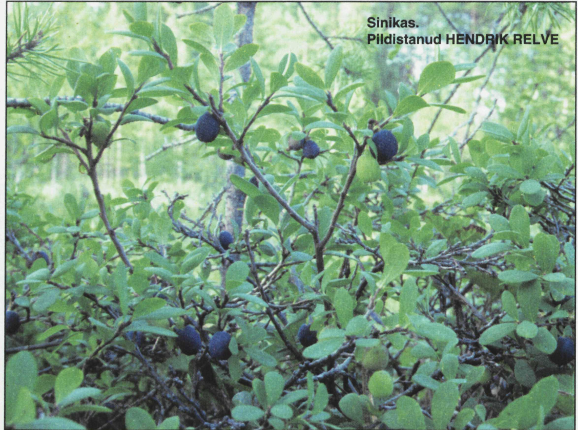
Sinikas. Pildistanud HENDRIK RELVE

Pole aga teada ühtegi juhtumit, kui sinikatest oleks saadud tervisehäireid pärast seda, kui marju on kasvõi kergelt kuumutatud. Sinikamarjadest valmistatakse maitsvaid ja tervislikke moose, mahlu ja kompotte. Hoidiste maitse kipub vaid vesisevõitu olema. Seepärast sobib hoidiseid teha segus teiste marjadega, näiteks mustikatega. Sinikatel on samasugune tervist parandav mõju nagu mustikatel – nad aitavad kõhuhädade korral.