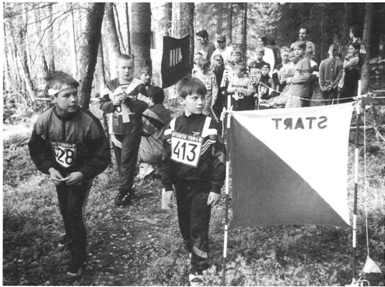
Orienteerumine on huvitav ja emotsionaalne ala. Fotol: Poisid Otepää Kevade stardikoridoris 1998.aastal