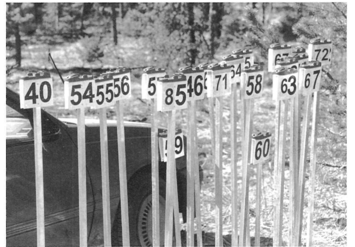
Millal on Eesti Orienteerumisspordi sünnipäev?

Seega on protokolliraamatust fikseeritud, et vabariikliku spordikomitee ruumes moodustati 8. juunil 1959 Eesti orienteerumisspordi-alast tegevust juhtiv organisatsioon, mida asjaosalised ja