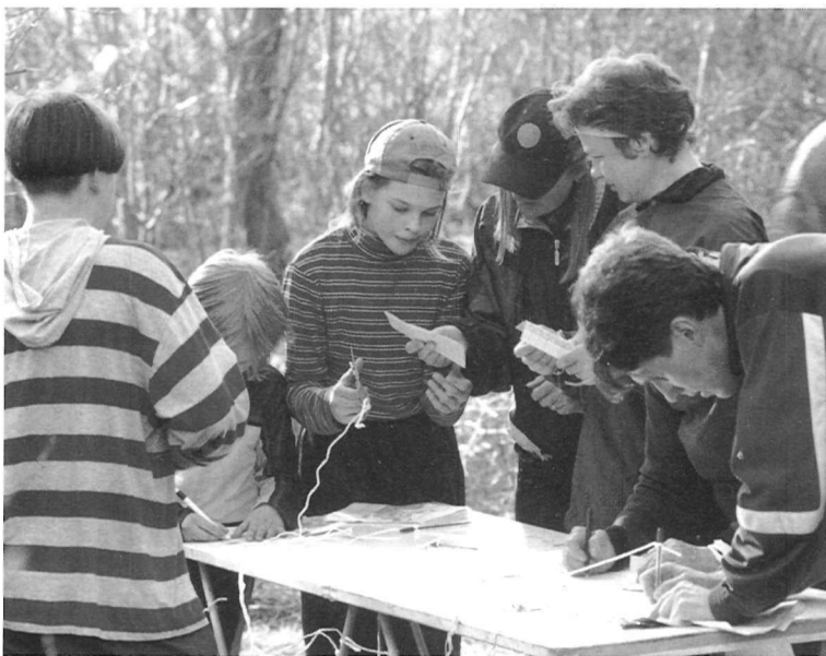
Esmatutvuseks orienteerumisega sobivad ka kõik päevakud. Fotol: Fragment Tallinna neljapäevakust osavõtjate stardieelsetest askeldustest

olid mõned koolid ise küll kaartidest huvitatud, kuid ei suutnud väidetavalt leida raha (NB! 50% ehk 1445 krooni) tasumiseks. Minu arvates oli põhjus lihtne: miks peaks kool kulutama õppevahendite eelarvest raha õppekaardi valmistamiseks, mis toob ju ka õpetajatele kaasa lisakoormust, kuna tuleb õpilastele ka kaarti ja selle lugemist õpetada. Lihtsam oli selle raha eest koolile osta näiteks palle - palliviskamist oskab ju niigi iga koolilaps. Õpetaja mureks ja vaevaks jääb vaid pallide kätteandmine. Seega koolikaartide valmistamise mure ja kaardiõpetuse organiseerimine õpilaste hulgas jäi suuremal osal EOLi liikmesklubide aktiivsemate noortejuhendajate kanda. Ja kes