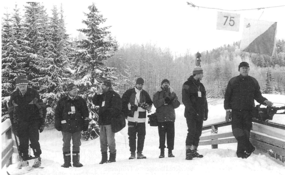
Vaatepunkt tegi teatesõidu ajakirjanikele ja publikule põnevaks vaatamänguks.

Möödunud talve hakul, kui Kääriku MK-etapi korraldajad võistluspaigas põgusalt kokku said et sellega tutvuda ja plaane pidada, oli rahustav näha, et võistluskeskus oli Kääriku suusaastadioni näol 90% valmis. Pane vaid püsti tulemuste tablo, riputa üles reklaamplagud ja võibki stardi lahti lasta. Võrdlus suvega, kus korraldajatele anti ette lage ja tuuline põld ning välja ehitada tuli mitu stardi- ja finišikohta, oli drastiline.