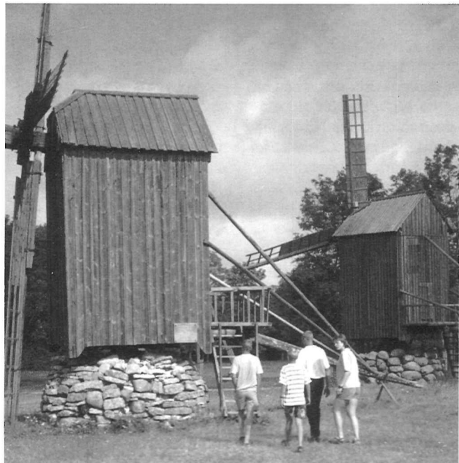
Saaremaale tulek on suurem ettevõtmine, sestap ei tulda siia pelgalt võistlema. Fotol: Turistid uudistamas Angla tuulikuid suvel 1998.