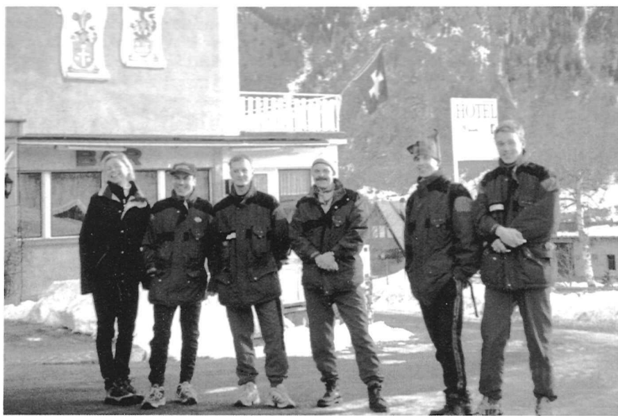
Talvekoondis Šveitsis MK etapil 24. jaanuaril 99