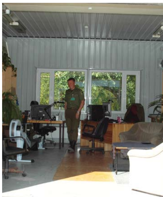
Kordoni ülem ja asetäitja on end kordonihoone valmimiseni sisse seadnud garaaži

Kagu Piirivalvepiirkonna piirivalveametnikuna võin väita, et meie ametnike tänane teadmiste pagas ja tehnilised lahendused on muutunud paremaks. Sellega kaasneb ka inimlik olmetingimuste parandamise soov. Eks jah, kitsaskohti leidub kõikjal ja nende likvideerimisega tegeletakse tasapisi, kuid sihikindlalt. Selleks on meie ametkonnas tublid ametnikud, kes ratsionaalset kriitikat arvesse võttes arendavad välja märkimisväärseid ja positiivseid lahendusi. Lihtne on osutada sõrmega igasse ilmakaarde ja kiruda mõtlematult, et kõik on halb ja ebameeldiv.