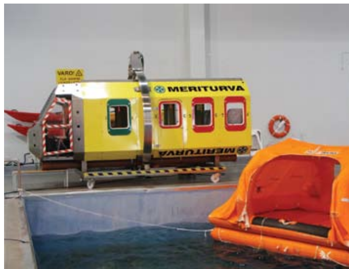
HUET helikopter, mille abil treenivad kopterimeeskonnad

Üldjoontes ei pea meie pinnaltpäästjate taseme või varustuse pärast häbi tundma, pigem oldi huvitatud, kust oleme hankinud ühe või teise asja. Muret peaks meile valmistama noorte pilootide lennutundide arv võrreldes