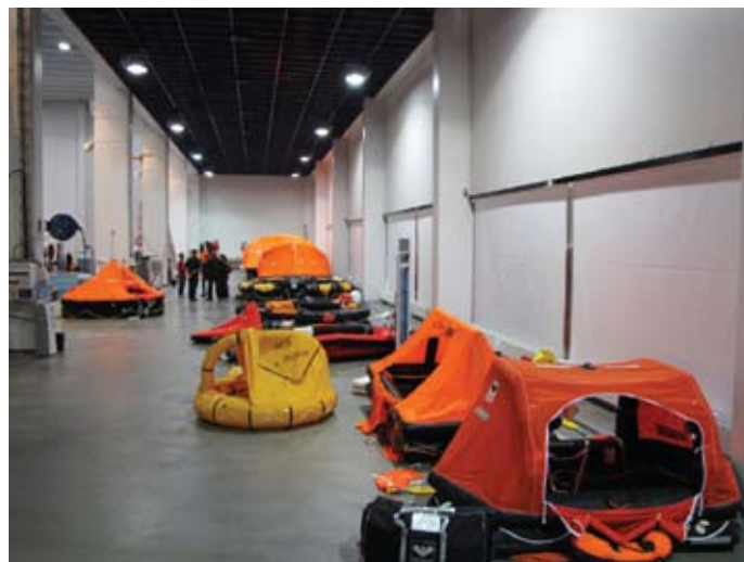
Väljapanek erinevatest päästeparvedest Meriturva koolituskeskuses

Pärast esimesel päeval toimunud saunaõhtut kadus võõristustunne ja õhtusöögiks poronkärhistyst süües asuti juba tööasju