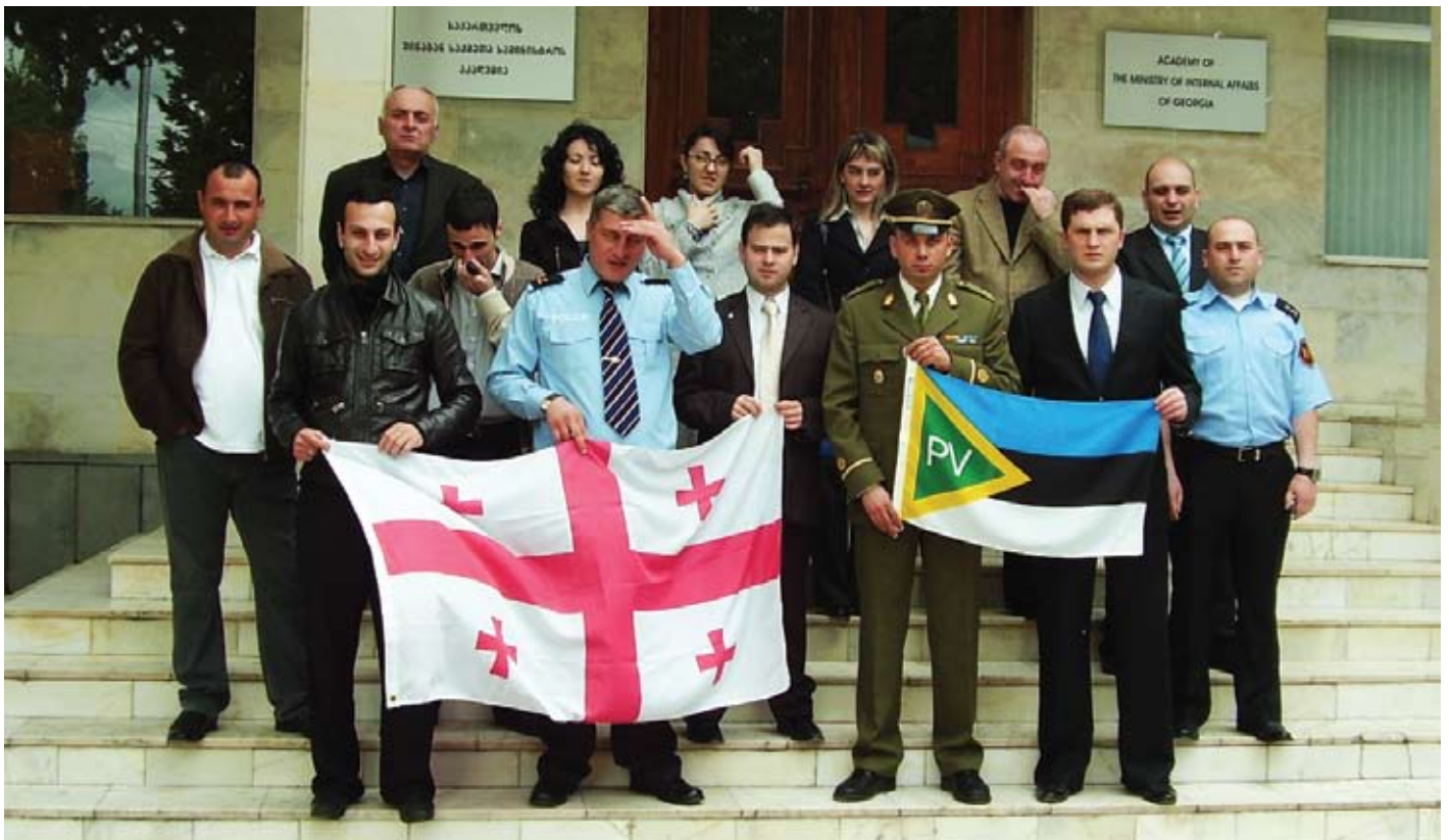
Esimese kursuse lõpetamine

Materjal, millega töötada on lai: sõiduk, sõiduki dokumendid, isik, kes transpordib ja tema dokumendid. Vaja ära tunda muudetud tehasetähis, muudetud dokumendid ja muudetud andmekandjad. Et võltsingud ära tunda. on vaja tootjate andmeid, kontakte välismaal, et konsulteerida ja teada saada sarnastest juhtumitest ja hiljem õppena edasi anda kolleegidele.