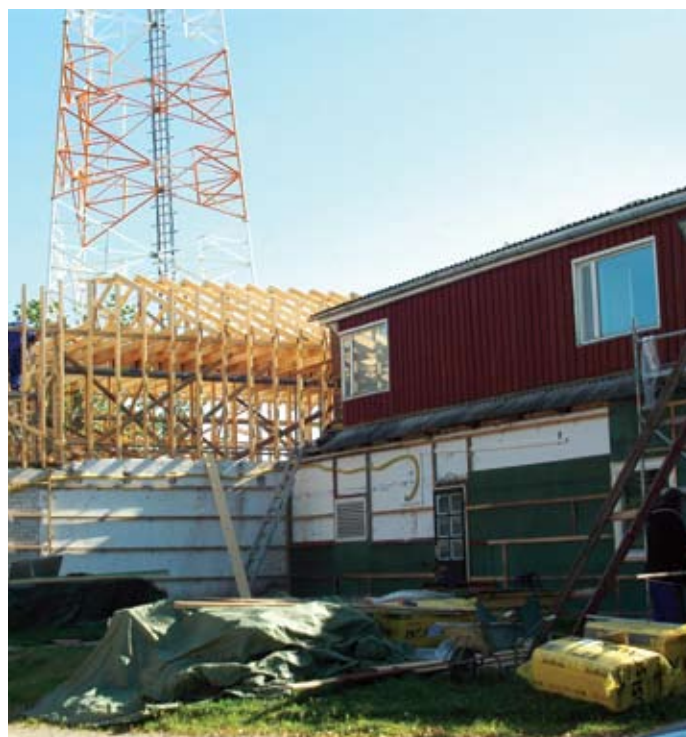
Mehikoorma kordoni renoveerimistööd lõppevad detsembris

Siinkohal ongi rõõm tõdeda, et piirkonna järjepidevast soovist lähtudes ja välispiirifondi (VPF) toetuse kaasabil on Kagu Piirivalvepiirkond ühe hoone renoveerimisega taas muutumas paremaks ja uhkemaks. Jutt käib Mehikoorma piirivalvekordonist, mis paikneb Tartumaal Meeksi vallas Mehikoorma külas kaunil Lämmijärve kaldal ning on vaatevälja poolest sama märkimisväärne kui hoone ajalooline kirkus.