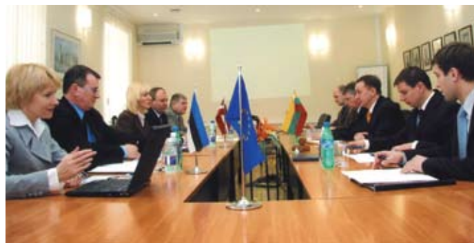
Rahvusvahelise koostöö argipäev – visiidid ja kohtumised. Balti riikide piirivalvete kolmepoolne kohtumine

Täna on piirivalve masinapark väga esinduslik, aga tol ajal oli Võrus kasutusel vana Niva: „Juhi kõrval istudes pidi porisel teel sõites käigukangist eemale hoidma, sest autos oli auk ja sealt võis pori sisse pritsida. Uksed vajusid ka siis lahti, kui tahtsid. Ühelt öiselt käigult tulles märkasid, et sõidame tihedas udus, aga mõne hetke pärast selgus, et udu tuleb kapoti