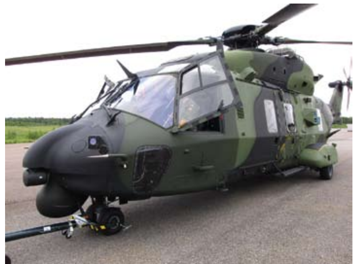
Soome maaväe helikopter NH-90, mille labadest tulenev õhuvoog raskendab pinnaltpäästjate tööd

Hispaaniat esindas Inaeri firma pinnaltpäästja, kelle firma osutab kahe S-76 Sikorsky tüüpi helikopteriga kahest