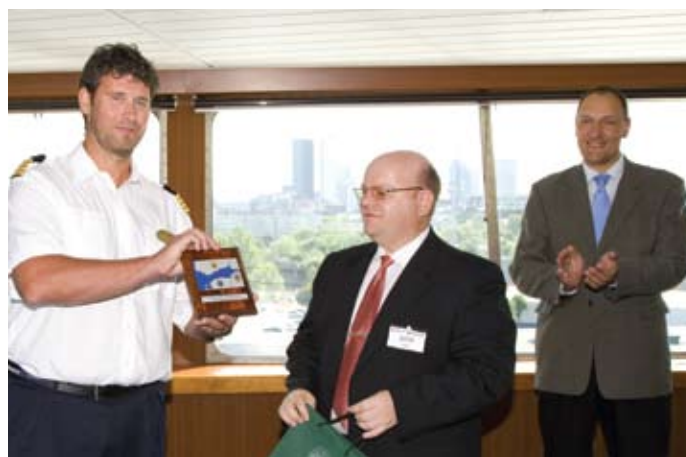
Victoria I kapteni tänamine