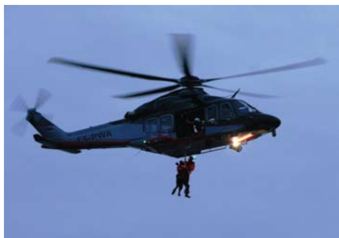
Pildid 5.09. toimunud õppuselt „Liivi laht 2009“