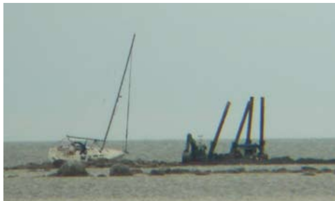
Madalikule sõitnud Santa Rita päästmine juunikuus

Lisaks jahtide ja kaatrite meeskondade merehädast päästmisele tuli piirivalvuritel otsida ka merel kaduma läinud ujujat ja lohesurfarit. Mitmel korral anti teada mere kohal õhku lastud punastest signaalrakettidest, millele Lääne Piirivalvepiirkond reageerib alati kui reaalsele ohuolukorrale merel. Tänavu osutusid kõik saabunud teated punaste raketide kohta küll valeteadeteks, kuid valeinformatsiooni tõttu kulutasid piirivalvurid päästeotsinguid teostades mittevajalikeks meresõitudeks ilmaaegu mitmeid tunde.