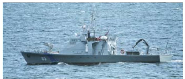
PVL-103 Pikker meeskonnale jääb eredamalt meelde osalemine merepäästeõppusel GULF SPEAR 2009

„Tallinna piiripunkti informeeriti Narva piiripunktist, et öösel tuli üle piiri kaks Kongo vabariigi kodanikku eesmärgiga külastada Eestit. Narva piiripunkti piirivalvurid kahtlesid isikute ütlustes. Meie piiripunkti passikontrolör nägi hommikul tööle sõites neid kahte isikut lennujaama poole suundumas liinibussis ja talle tundusid isikud samuti kahtlased,“ kirjeldas Parviainen, „Tööle jõudnud, mainis ta seda vahetuse vanemale. Vahetuse vanem läks terminali asja uurima ning Kongo kodanikke