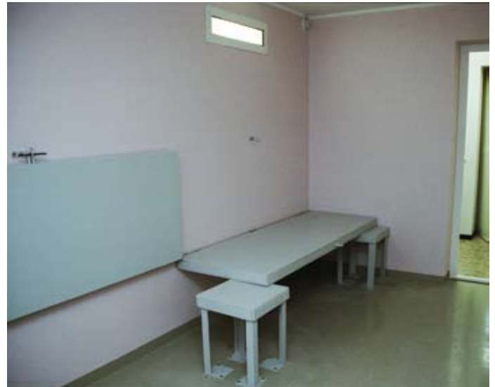
Väraska kordoni kinnipidamisruum

Kambris peab olema tagatud isiku julgeolek. Viimane eeldab kinni peetud isiku üle piisava järelevalve teostamist kas visuaalse jälgimise või videovalve kaudu. Samuti peaks kinni peetaval isikul olema võimalik ise ametnikega ühendust võtta.