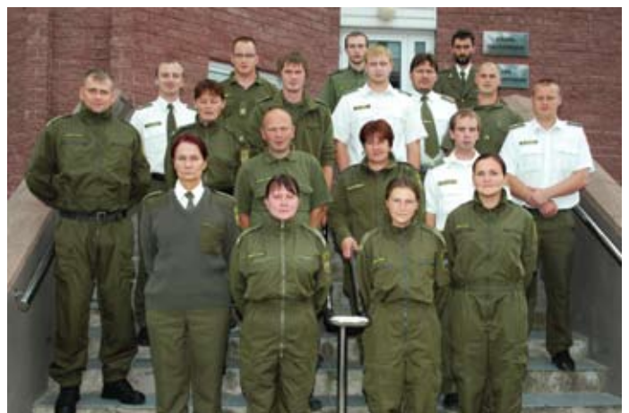
Sõidukite identifitseerimise kursusel osalenud koos Kagu Piirivalvepiirkonna ülemaga

paindlikkust ootamatute olukordade lahendamisel ning piirkonna ja struktuurüksuste juhtkonna suurt toetus koolituse läbiviimisel.