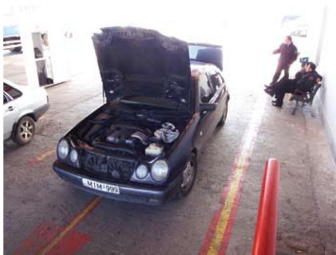
Koolituse oluline osa on praktika