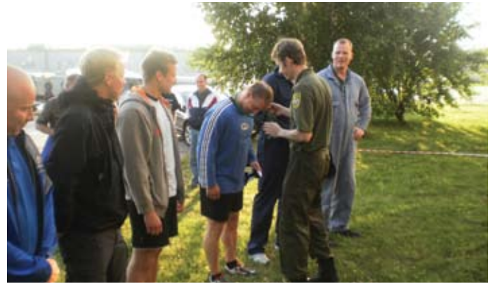
Võit Nokia kummikuvistes läks Merikarhu meeskonnale