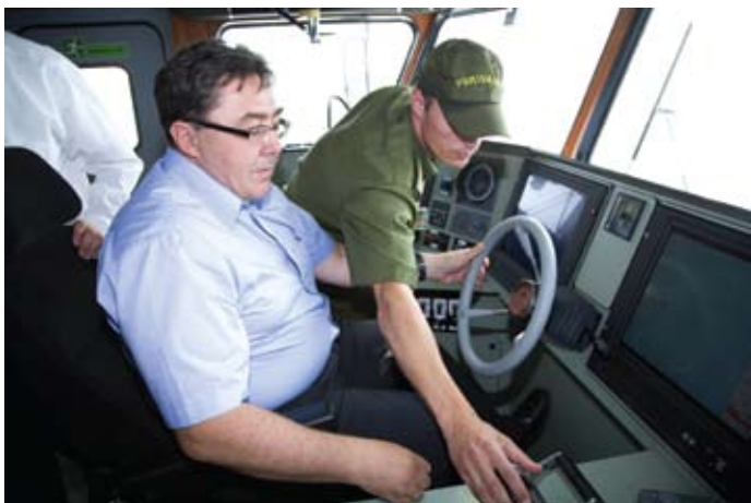
Soome Piirivalveameti ülem tutvus põhjalikult piirivalvelaevaga Valve