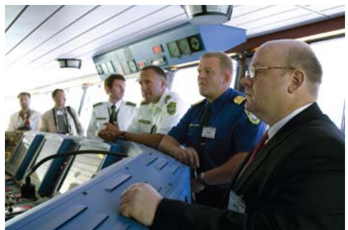
Ootusärev hetk enne õppuse algust

Hästi planeeritud ja läbi viidud õppus, millele antakse adekvaatne hinnang, võib esile tuua puudused planeerimisel, heita valgust nõrkadele kohtadele teenistuses, kaasatavates jõududes ning osutada valdkondadele, kus läheb vaja täiendavat väljaõpet või ressursi.