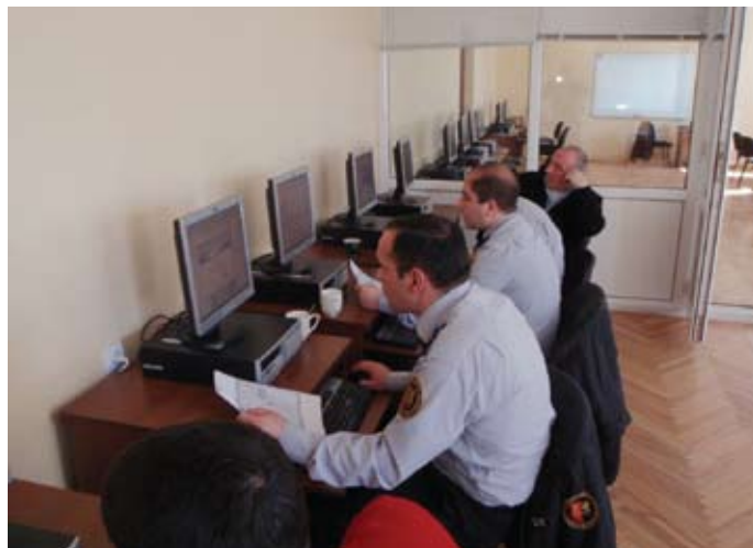
Käimas on usin õppetöö

Projekti koostamisel püüdsime vältida vigu, mida ise