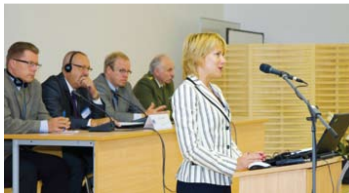
Lääne-Balkani riikide piirivalvete kordoniülemate seminari avamas

1991. aastal läks Lindsaar rotatsiooni käigus tööle kriminaalpolitseisse ja nii jõuab jutt korraks puudutada ka hetkel