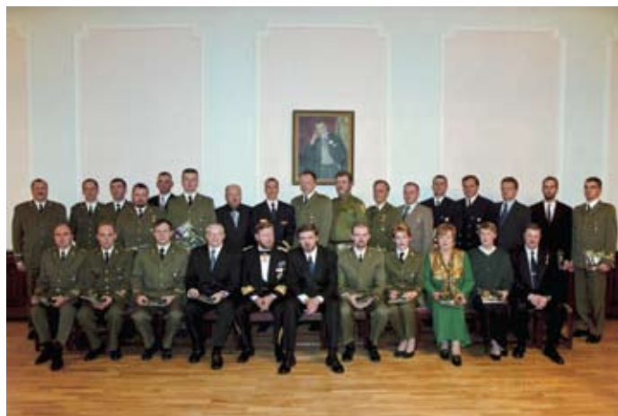
Piirivalve teeneteristide saajate ühisfoto 1998. aastal