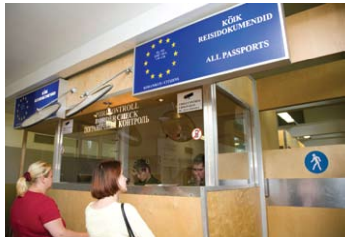
Narva maanteepiiripunkti jalakäijate terminal (pilt on illustreeriv)