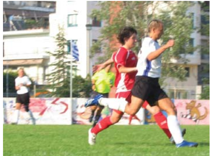
Jalgpall on usalduse, füüsiliste võimete ja oskuste summa

Eelmisel aastal liitusin ma piirivalve võrkpalli võistkonnaga ja võtan võimalusel treeningutest osa. Võrkpall on ka võrratu, aga jalgpall on minu jaoks ikkagi number üks.