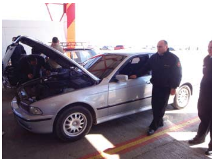
...praktika ja veelkord praktika