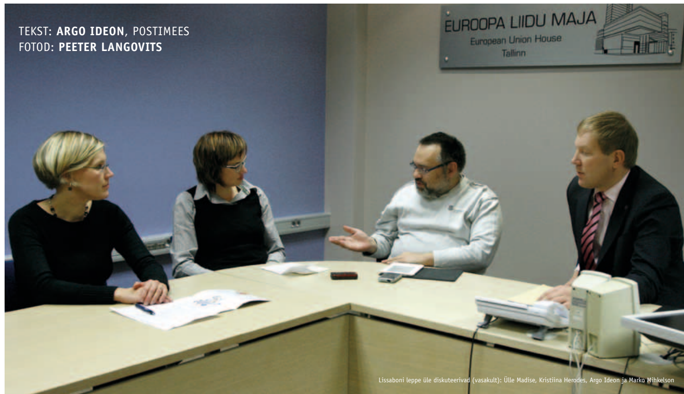
TEKST: ARGO IDEON, POSTIMEES