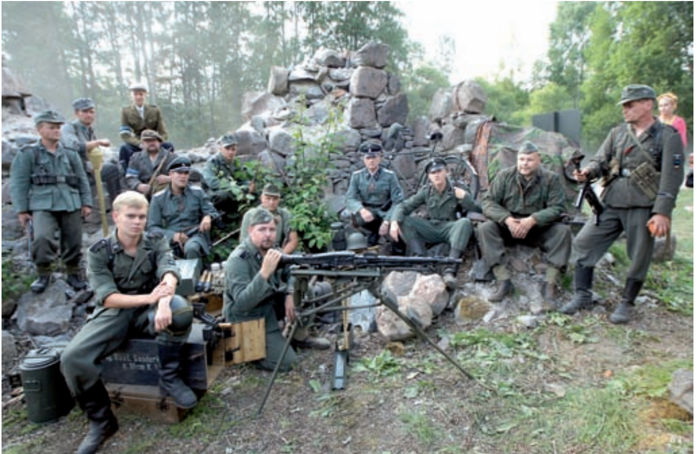
Erna retke 2006 teisel päeval lavastas ajalooühing Frontline Kautla baaslaagris olijatele näidislahingu Teise maailmasõja aegsete Vene ja Saksa armeede varustades. 1940. aastate algul võõras mundris Eesti metsades sõdinud eesti mehed ei saanud loota, et kriitilisel hetkel sõidab metsateele pitsataks ja pöösasse ulatatakse lisamoona.

Ei maksa unustada, et Eesti võistkondadel on niigi määratu eelis välisvõistkondade ees. Nad on kodus ja kodusel maastikul, mille on suuteline peaaegu pähe õppima iga vähegi põhjalikumalt asjasse süvenev võistleja. Ma ei kahtle, et Eesti võistkonnad on tugevad. Ja loodan