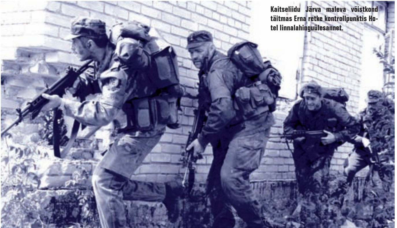
Kaitseliidu Järva maleva võistkond täitmas Erna retke kontrollpunktis Hotel linnalahinguülesannet.