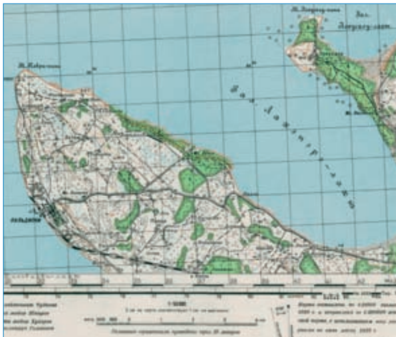
Joonis 2. Osa Nõukogude Liidu kindralstaabi topograafilisest kaardist 1:50 000; kaardileht 0-35-13-B (Paldiski), kirjastatud 1939. aastal (kaarti on vähendatud 42%ni).

Geograafiliste atlaste, maakaartide, topograafiliste plaanide jms materjalide trükis avaldamine oli täielikult GUGK monopol. Sellealane järelevalve oli pandud omaette mõjukale ametkonnale – NSV Liidu Ministrite Nõukogu juures asuvale Trükistes Riiklike Saladuste Kaitse Peavalitsusele (lühidalt GLAVLIT). Kehtis trükiste tsenseerimise ja kirjastamise piirangute eeskiri (vt lisatud loendit), mis välistas geograafilisel andmestikul põhinevate graafiliste materjalide avaldamise (trükkimise, paljundamise). Väidetakse, et absurdsuse poolest ületasid GLAVLITi piirangud Instruktsiooni TGMS nõudeid, sest neid tõlgendavad ametnikud ei olnud eriti kompetentsed geodeesia ja kartograafia alal (isegi trükitekstis esinevad mõisted, nagu topograafiline kaart, plaan, skeem, kaardivõrk, mõõtkava ja koordinaadid, tekitasid vastureaktsiooni). Paremal juhul otsiti nõuabi