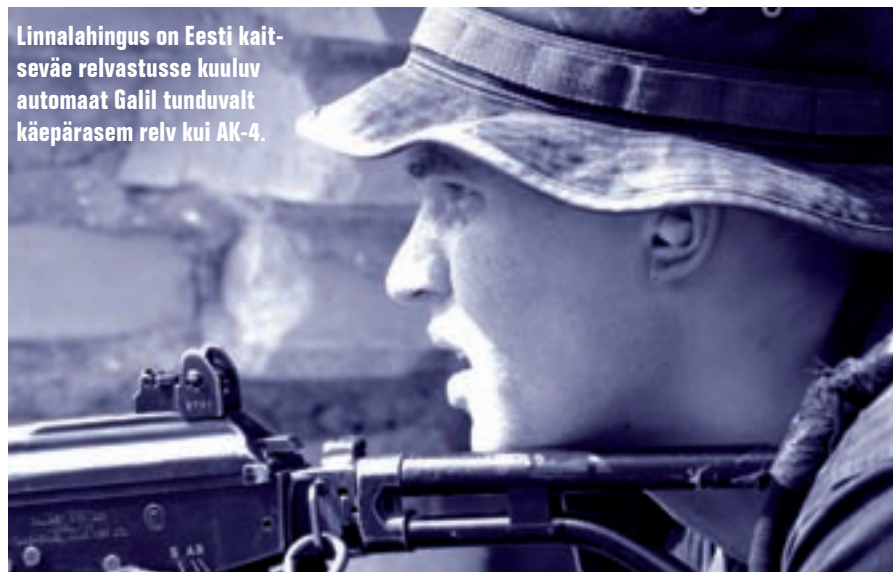
Linnalahingus on Eesti kaitseväe relvastusse kuuluv automaat Galil tunduvalt käepärasem relv kui AK-4.

Üks Scoutspataljoni võistkond, lõpetanud hiilgava soorituse hea ajaga kontrollpunkti Hotel, kommenteeris asja järgmiselt: "Nende kahe pisikese maja jaoks antakse tervelt kümme minutit...! Kas nad arvasid, et hakkame siin sööma või !?" KK!