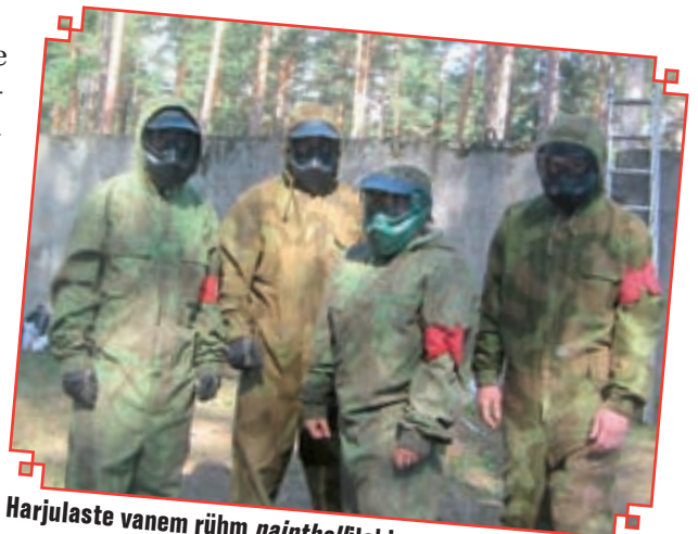
Harjulaste vanem rühm paintball lahinguks valmis.

Järgmised Balti sõjaväemängud on 2007. aastal Leedus Klaipedas, aga kes seal Eestit esindab, seda näitavad kodused jõukatsumised. KK!