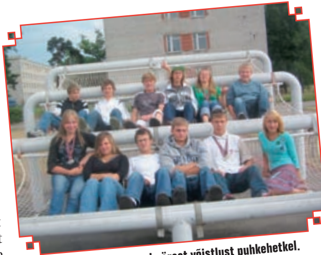
Harju maleva noored pärast võistlust puhkehetkel.

Et ööbimispaik oli Adažist kaugel Riias Läti Kaitseakadeemia ruumides, pidid võistlejad ärkama hommikul kell kuus. Samas oldi tänu varasele tõusmisele ja pikale sõidule võistluste alguseks mõnusalt virged. Võistluste korraldus oli ladus, mõeldud oli pisimategi detailide peale ja päevad möödusid lausa märkamatu, sest neid täitsid va-