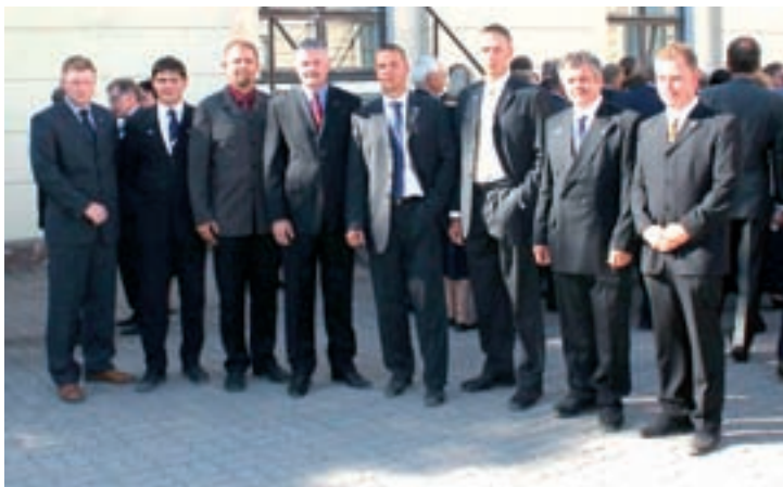
Eesti Reservohvitseride Kogu esindus Soome Reservohvitseride Liidu 75. aastapäeva pidustustel.

Lisaks ametlikule kavale oli Hamina sadamas linnarahvale ja külalistele uudistamiseks välja pandud mitmesugust sõjatehnikat (soomukid, helikopter, sõjalaev, relvad jpm).