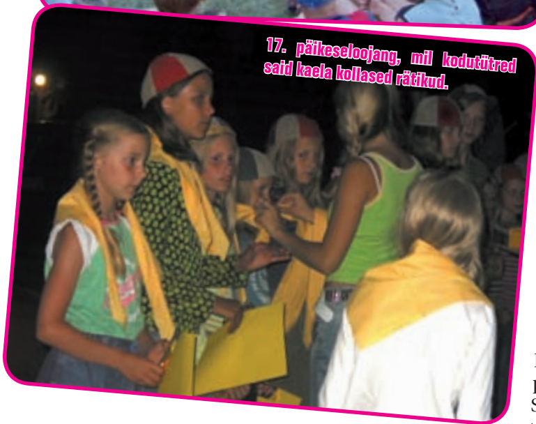
17. päikeseloojang, mil kodutütred said kaela kollased rätikud.

Juulikuu teise nädalalõpu veetsid Tartumaa aktiivsemad noorkotkad ja kodutütred igasuvises suurlaagris Tartumaa tervisespordikeskuses Elvas. Kolm tegusat ööpäeva tipnesid uute liikmete vastuvõtu ja ilutulestikuga viimasel laagriõhtul. Kõik tegevused algavad kotkatervitusega “Oleme sõbrad! Oleme aumehed! Oleme eestlased!” ja lõpevad lubadusega: “Jääme sõpradeks! Jääme aumeesteks! Jääme eestlasteks!”