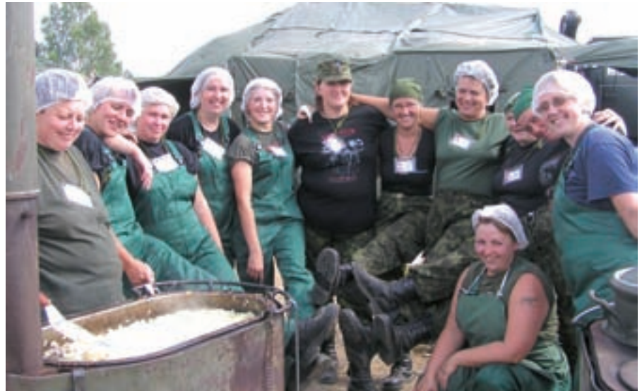
Naiskodukaitse välikokakursuse lõpetanud näitasid end Erna baaslaagris praktikat sooritades suurepäraselt kokkutöötava meeskonnana.

Erna retke baaslaagri köögis tegutses 22 inimest: kaks vahetust toiduvalmistajaid, õpetajad ja eelmise aasta kursuslased, kes olid julgustanud toitu algusest lõpuni ise valmistama ja panid ka oma õla toeks alla. Kogu toidu oleme varemgi valmistanud, kuid seni polnud me võtnud enda kanda vastutust varustamise eest.