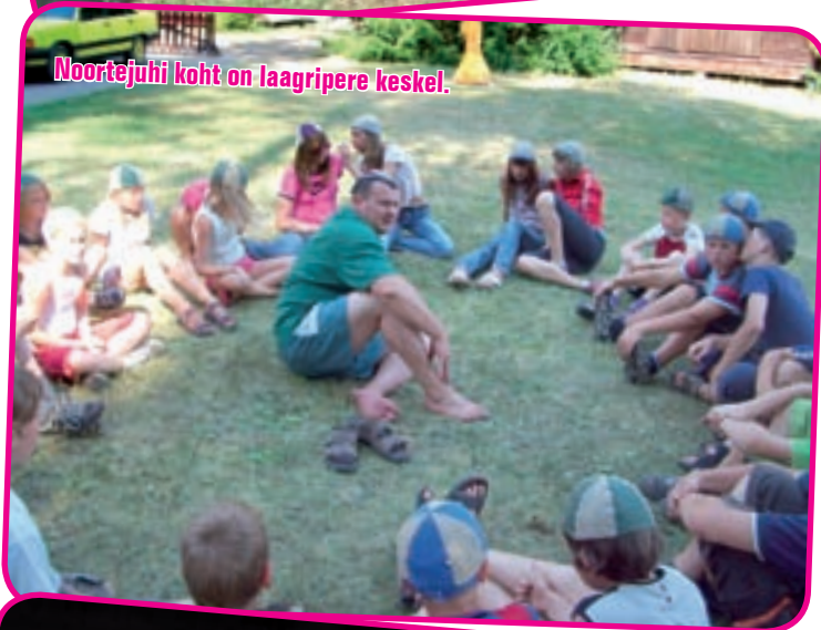
Noortejuhi koht on laagripere keskel.