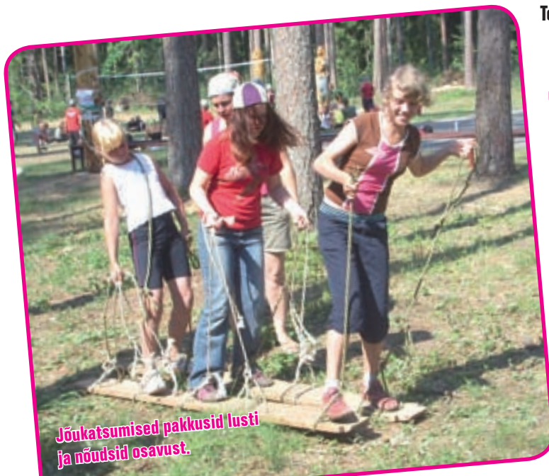
Jõukatsumised pakkusid lusti ja nõudsid osavust.