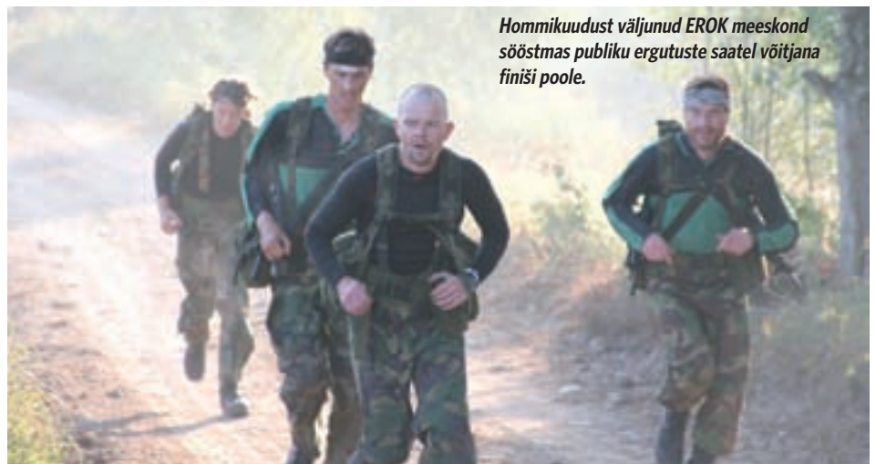
Hommikuudust väljunud EROK meeskond sööstmas publiku ergutuste saatel võitjana finiši poole.

Katsevõistlused pidasime juba aprillis Vanamõisas, mais tegime osalesime orienteerumistreeninguks Otepääl mitmepäevajooksul Ilves-3, lisaks regulaarsed lasketreeningud Männikul.