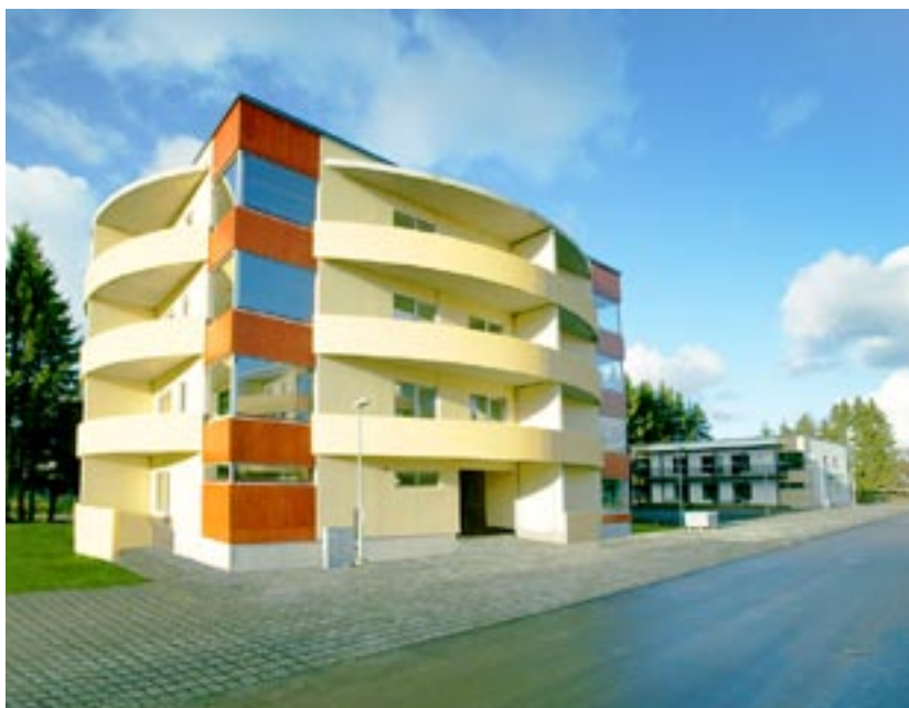
Näide: 2toaline korter, 54,2 m 2 , hind 1 331 449 krooni