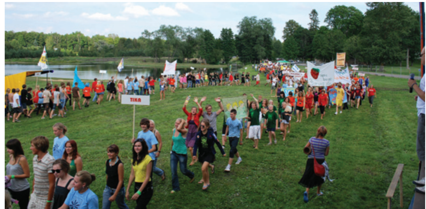
Malevlaste rongäik EÕM kokkutulekul Pilstveres.