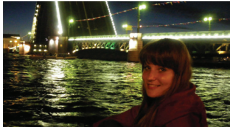
Peterburis on avatava keskosaga 22 silda.