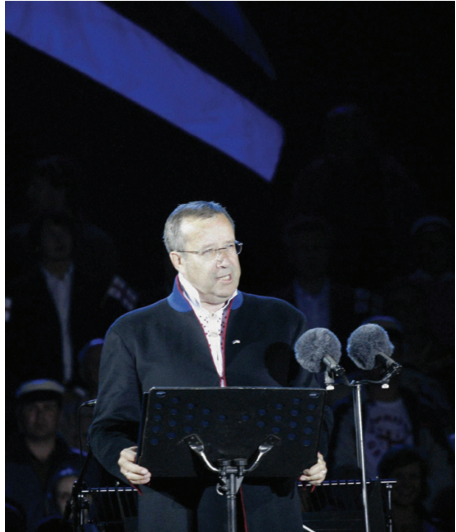
President Toomas Hendrik Ilvese kõnet katkestati korduvalt tormiliste vaheleplaksutamistega.