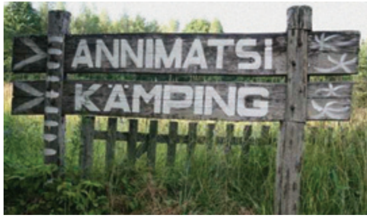
See kõik juhtus seal...

Sel suvel toimusid Eesti õpilaste suvepäevad 23.–25. juulil Annimatsil. Kolme päeva vältel said suvepäevalised osa mitmetest töötubadest, kus asjadest, mis muidu oleks jõudnud prügimäele, valmistati ilusaid ning praktilisi esemeid. Seda tehes õpiti lähemalt tundma erinevate materjalide taaskasutamise võimalusi. Lõbutseti muidugi ka kõikvõimalikul muul moel.