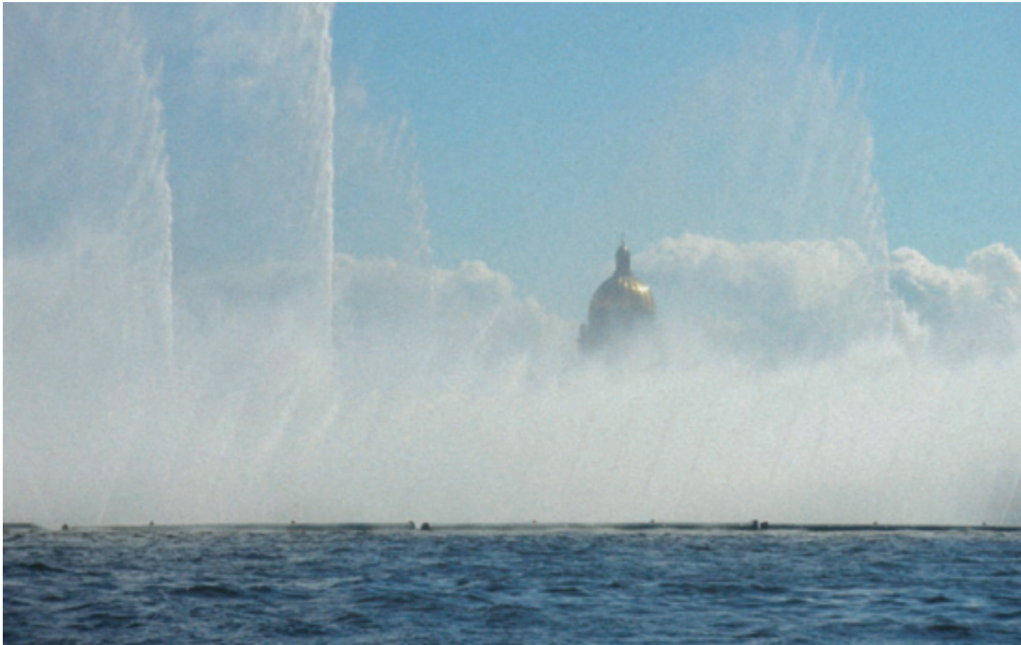
Näib nagu Peterburg lastakse õhku? See on "kõigest" tohtu suur purskkaev.

minna. Tähelepanelik mees märkab seda ja hakkab otsi kokku tõmbama. Lõpetuseks ütleb ta naljatades: „Aga teid, eestlasi, on siiski vähe... Tegelde ikka õige asjaga!”