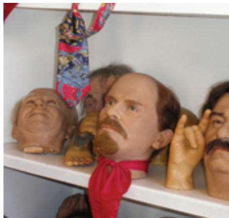
Venemaa endiste suurpoliitikute vahast pead on leidnud omale koha riitulil.