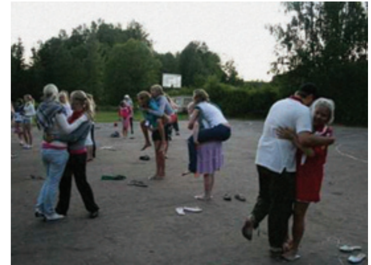
Ka õhtune programm oli vägev.