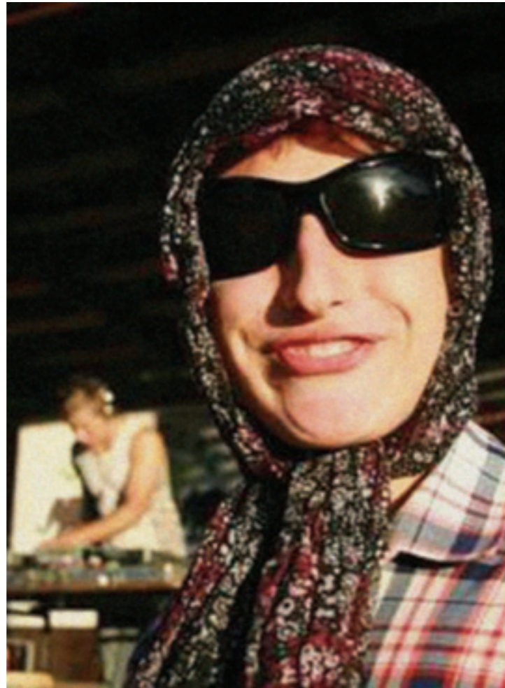
Aga stiilsed olime me igatahes.