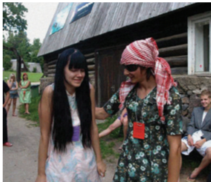
Isegi kokatädid olid meil tasemel.