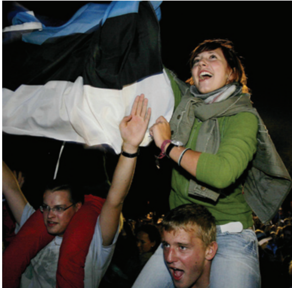
Sini-must-valged emotsioonid tõusid taevani.

Kuid kõige olulisem oli siiski laulmine. Täiesti kirjeldamatu tunne on laulda koos 100 000 inimesega nagu üks mees. See on midagi erilist, mis jääb alatiseks meelde ja ei ole võimalik kogeda ühelgi muul viisil. Nähes neid laulusõnu täna ja mõeldes, mida need võisid tähendada inimeste jaoks 20 aastat tagasi, siis jõuab kohale, kui palju väge võib ühes loos olla. See ongi see, mis pani aluse meie omariiklusele ja mis meid ka 20 aastat hiljem uuesti kokku tõi. •