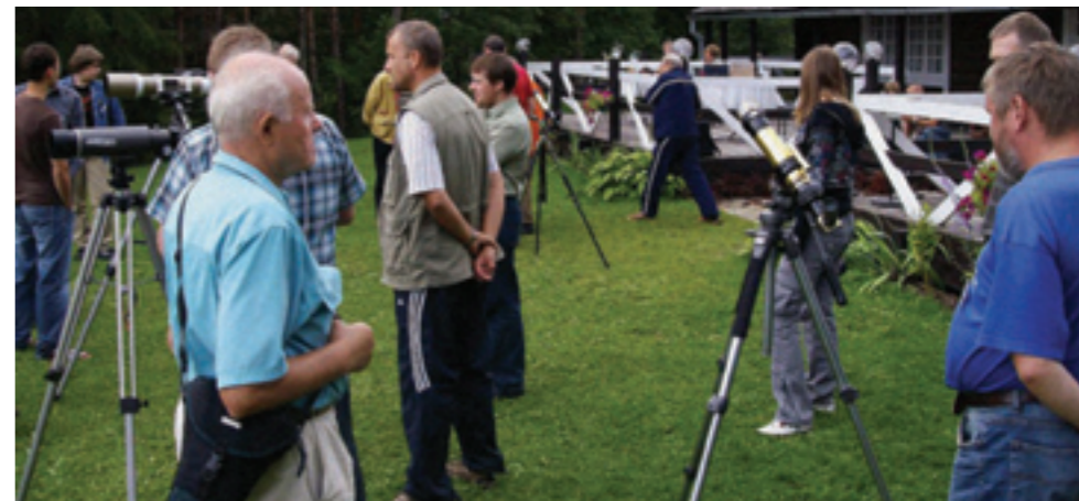
↑ Ebaõnnestunud päikesevaatlused.

Selguse huvides peaksin mainima, et astronoomiahuviliste kokkutulekud pole üldse mitte ainult asjaga professionaalselt tegelevatele inimestele, vaid ka kõigile neile, kellele astronoomia vähegi huvi pakub. Loengutemaatika lihtsustumine viimastel aastatel peaks ligi meelitama igal tasemel tähistae-vahuvilisi, sealhulgas õpilasi, kes on üritusel väga teretulnud. Järgmise aasta astronoomiahuviliste kokkutulek tuleb pisut suurem ja toimub rahvusvahelise astronoomia aasta raames Tõraveres, kus on olemas professionaalne tehnika ja ala suurimad asjatundjad. Kellel on huvi astronoomiaga tegelda või huvi tuleva astronoomia aasta vastu, saab rohkem infot veebiaadressilt www.obs.ee . •