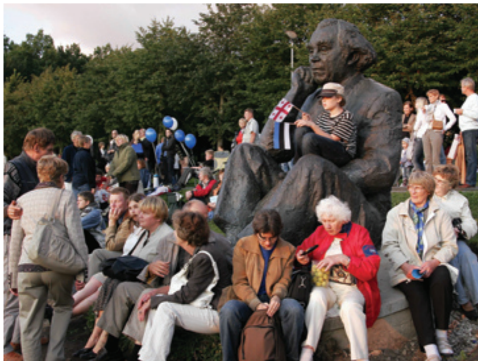
Rahvas kogunes lauluisa Gustav Enesaksa kuju turvalisse rüppe.