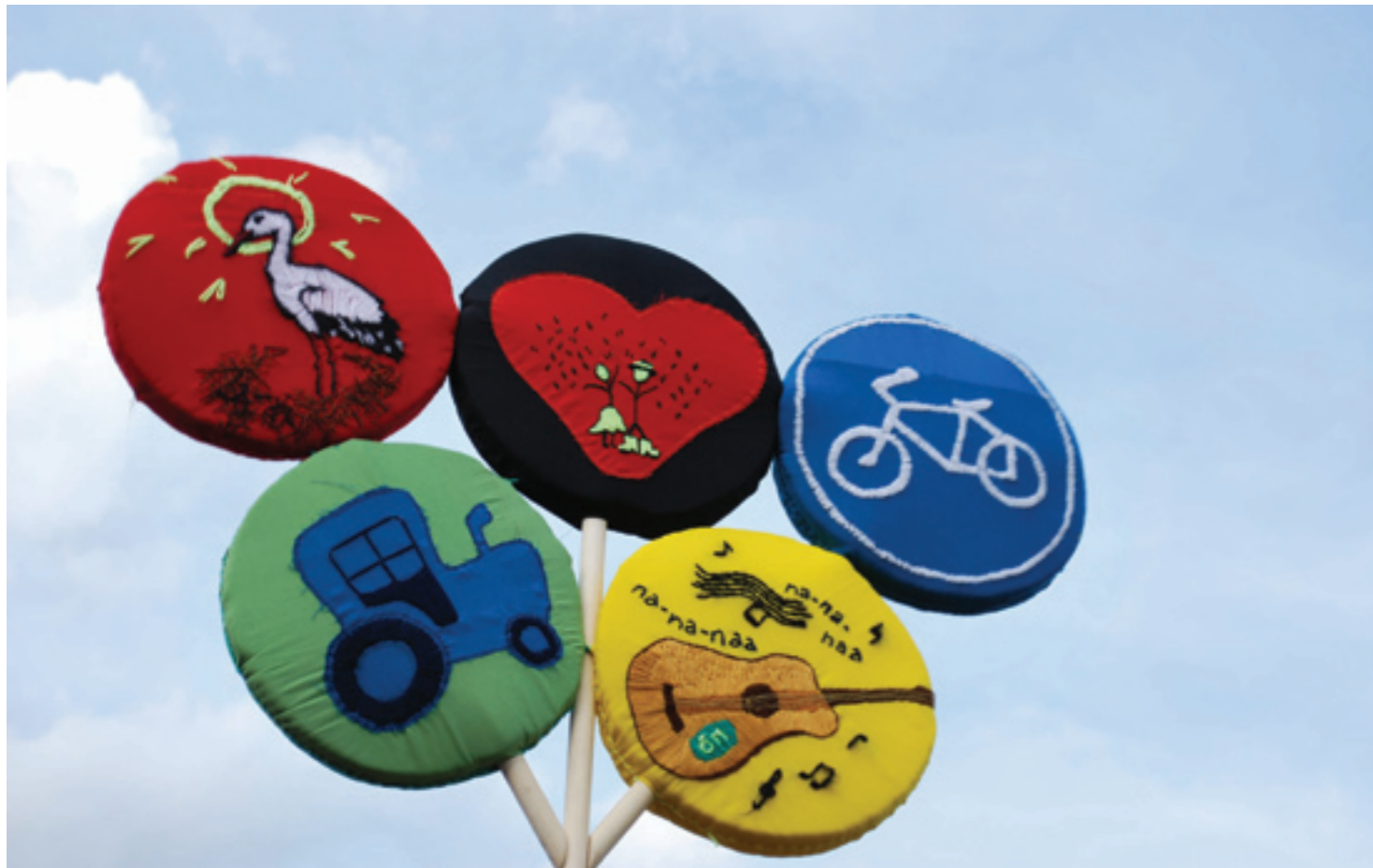
Simuna rühma võidulipp.

Lauluvõistlus on koht, kus igal rühmal on võimalus demonstreerida oma muusikalisust ning esitada teistele oma rühmalaulu.