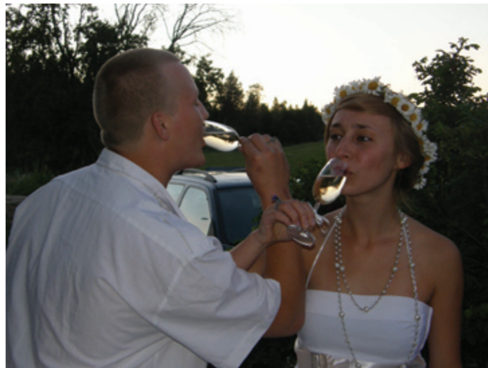
Eesti Üliõpilaste Ehitusmaleva Mõedaku II abielupaar.