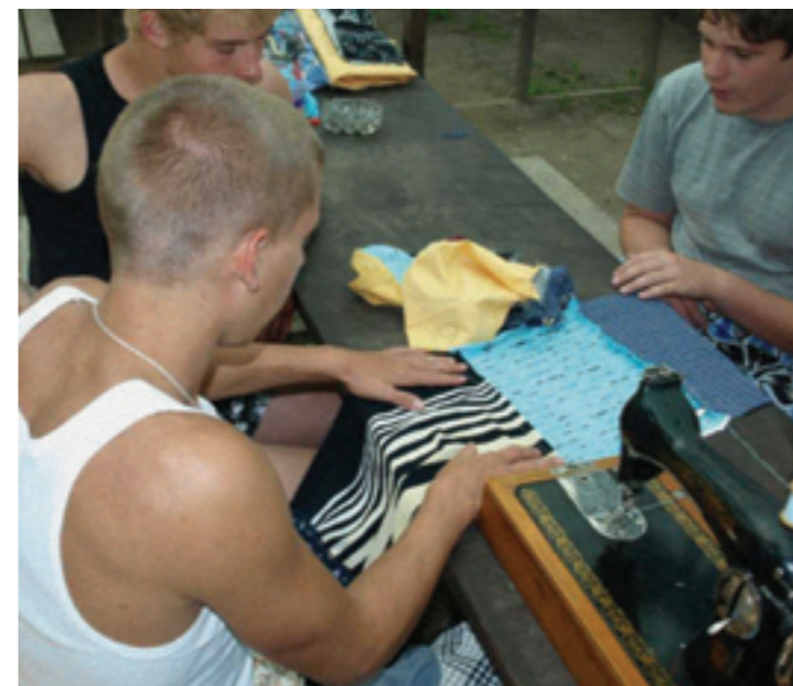
Proovitud sai näputööd — tegime vanast uut.