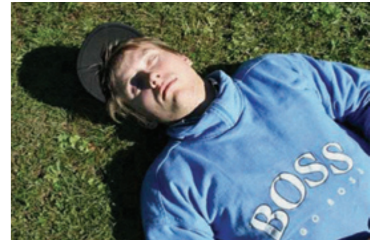
Red Bull annab tiivad, aga meie bull väsis ära.