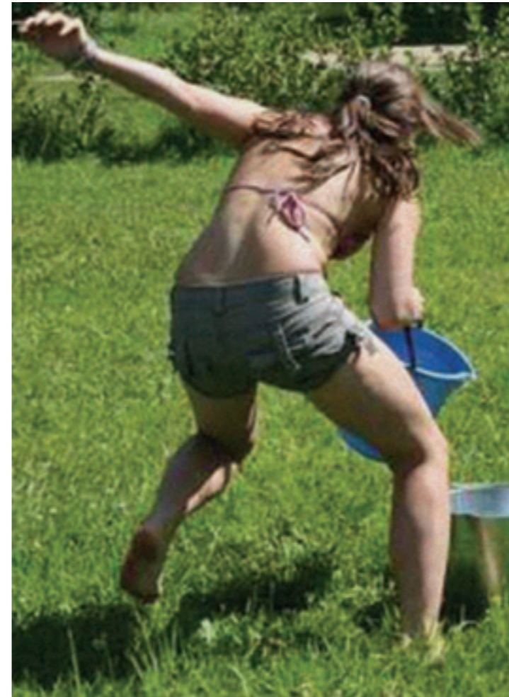
Tegevust jagus, seega igavlema ei pidanud.