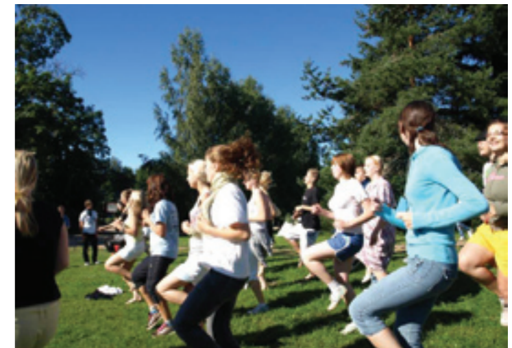
Aga järgmisel aastal oleme taas vormis. Ning ka teie kõik olete oodatud!