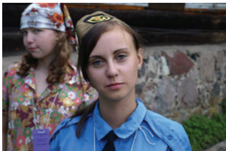
Moepolitsei oli range, aga õiglane.