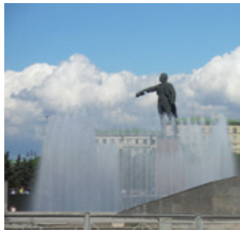
1924 -1991 kandis linn Vladimir Iljitš Lenini järgi nime Leningrad.

astun mõnda suveniiripoodi. Äkki märkan, et on juba lõuna ja peaks hakkama endale sobivat ööbimiskohta otsima. Minu muretsevad vanemad arvavad sama ja peagi saangi emalt sõnumi: „Tõenäoliselt sa endale hostelit ei leia, kuna on kuum hooaeg, nii et tule õhtul