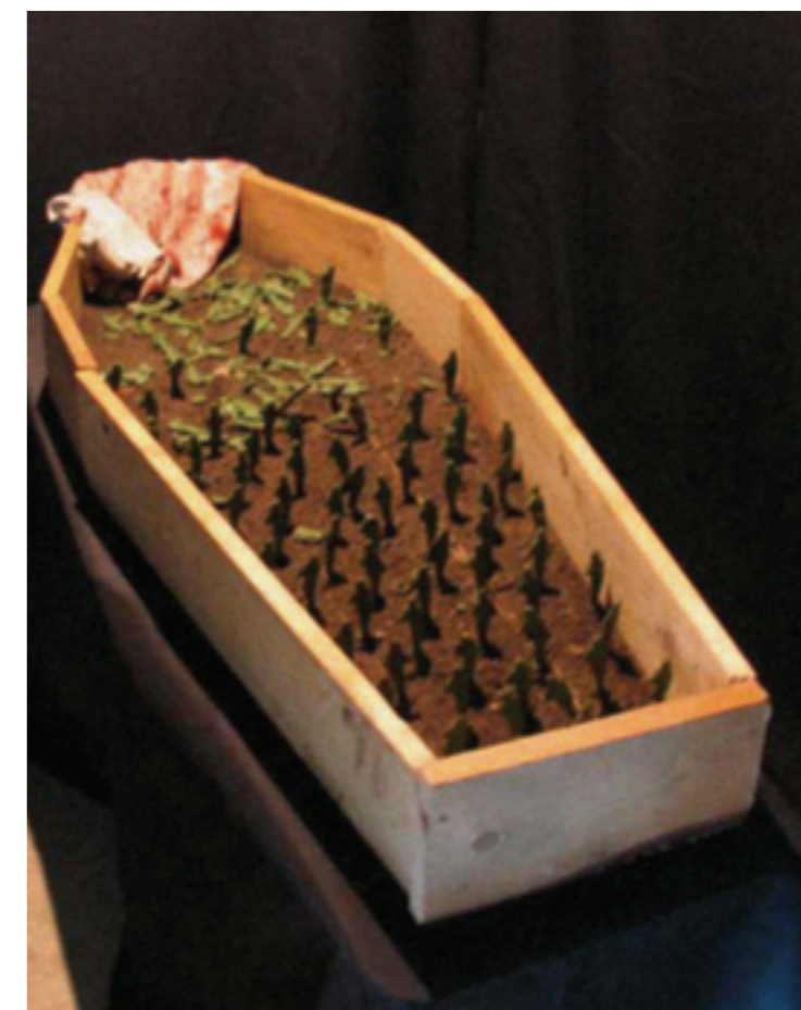
Kunst muinasjuttude ainetel Kristiina Laasiku "Vankumatu tinasõdur"