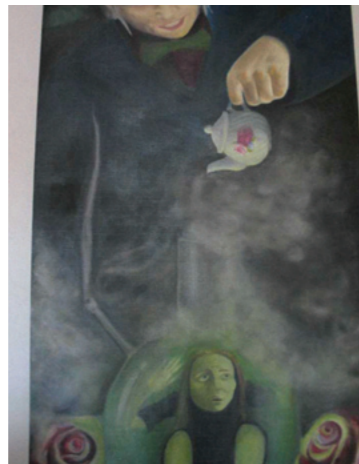
"Minu nimi on Alice"