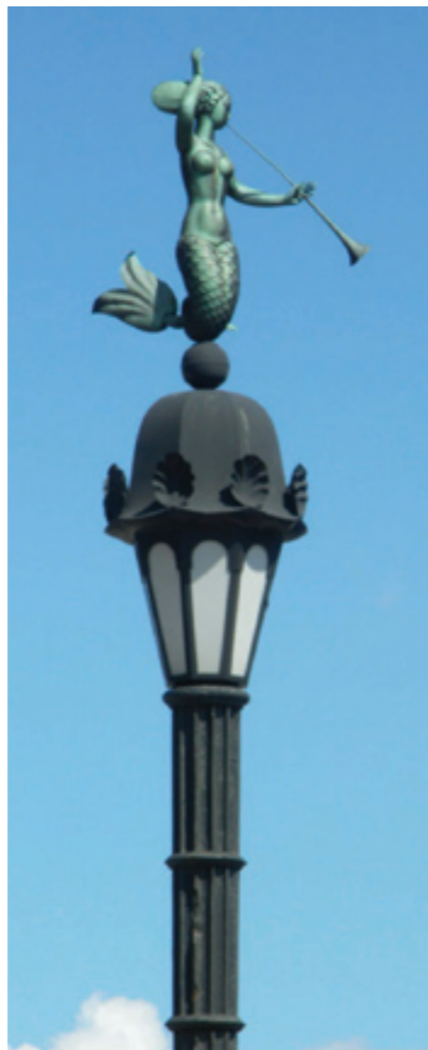
Latemad mängivad Peterburi välisilmes olulist rolli.