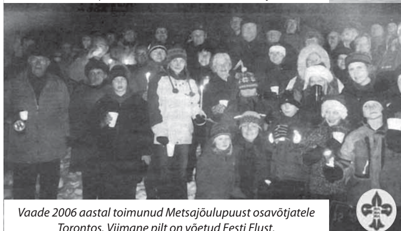
Vaade 2006 aastal toimunud Metsajõulupuust osavõtjatele Torontos. Viimane pilt on võetud Eesti Elust.