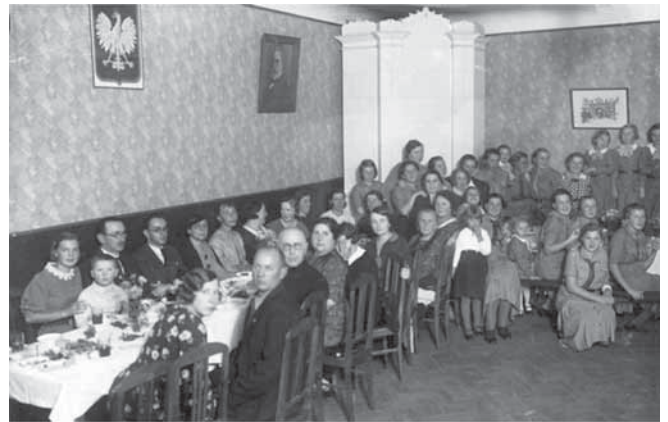
Pidulik 3. mai (= Poola Konstitutsioonipäev – tõlkija) üritus 1936. a.

„Kodanlikus“ Eestis elavad poolakad jagasid paljuski Eesti Vabariigi riigiaparaadiga tihedalt seotud olnud eestlaste, venelaste, sakslaste ja juutide saatust. Kõik aktivistid saadeti välja Siberisse või hukkusid nad nõukogude laagrites.