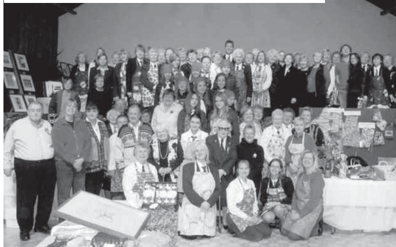
Need kes korraldasid ja viisid läbi Jõululaada. Mõlemad pildid on võetud Toronto Eesti Majas.