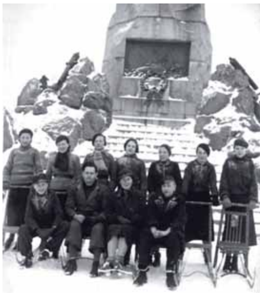
Retk Piritale 1937. a.

Hartserite liikumise viimane üritus on otse ja tihedalt seotud ZNPwE likvideerimisega, mis sai teoks pärast Molotov-Ribbentropi pakti salaprotokollide jõustamist 14. juunil 1940. a. Tänapäeval mäletatakse Eestis seda kuupäeva kui suurte küüditamiste algust.