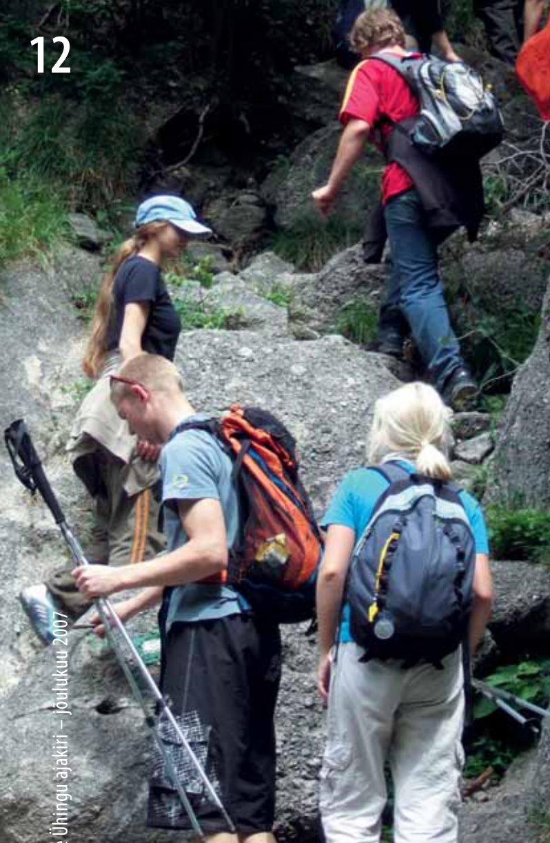
Eesti Skautide Ühingu ajakiri – jõuluku 2007