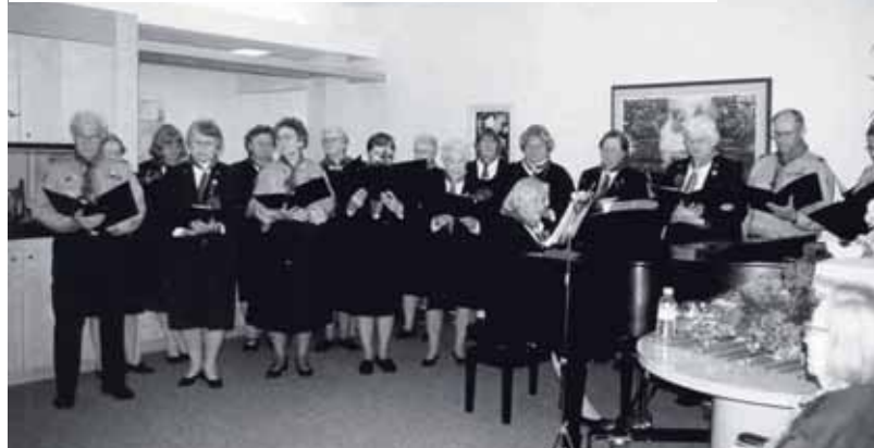
Sõprusring esinemas Ehatares vanuritele aastal 2004.