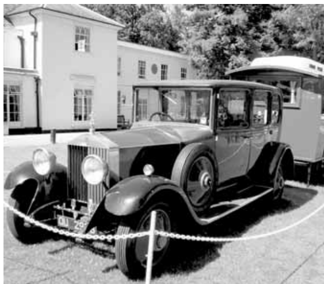
Rolls Royce, mis kingiti B-P-le tema juubeliks. Pane tähele skaudiliiliat auto ninal.

Nii jätkus koolis juba kodumailt koos vanema vennaga alanud tung vennastumiseks loodusega, mis hiljem sai tubli lisa Briti koloniaal-armees teenides.