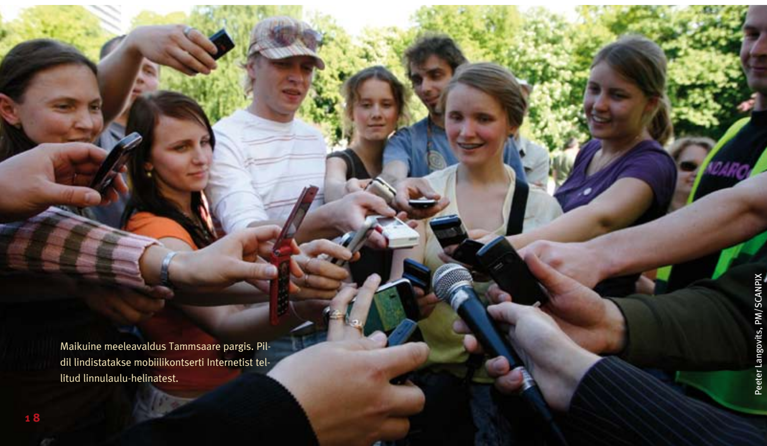
Maikuine meeleavaldus Tammsaare pargis. Pildil lindistatakse mobiilikonseriti Internetist tellitud linnulaulu-helinatelt.