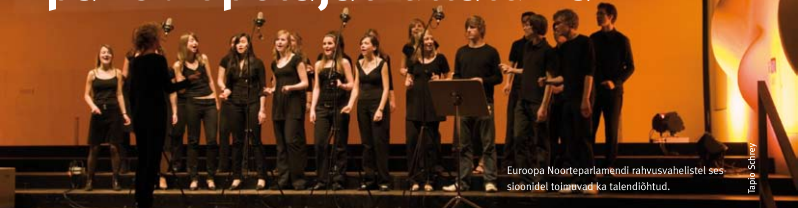
Euroopa Noorteparlamendi rahvusvahelistel sessioonidel toimuvad ka talendiõhtud.