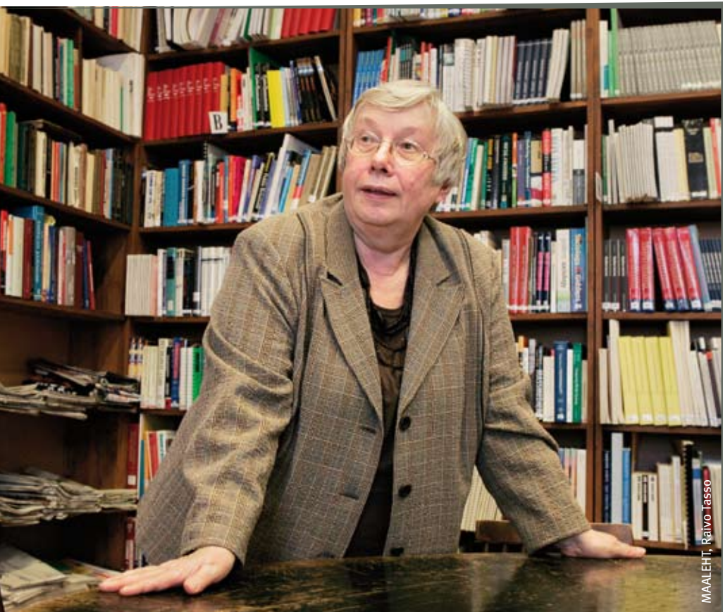
MAALEHT, RAIVO TASSO

Põhiseaduslik kriis Lätis jätkub ja tuleb vaid loota, et valijad võimu kuritarvitanud poliitiku tagasi omavalitsustesse ja parlamenti ei hääleta. Sellega saaks maksumaksja nii referendumite pidamise pealt kokku hoida kui ka loota, et kodanikuühiskonna algatusgrupid on järgmist referendumit kuupäeva valides tähelepanelikumad.