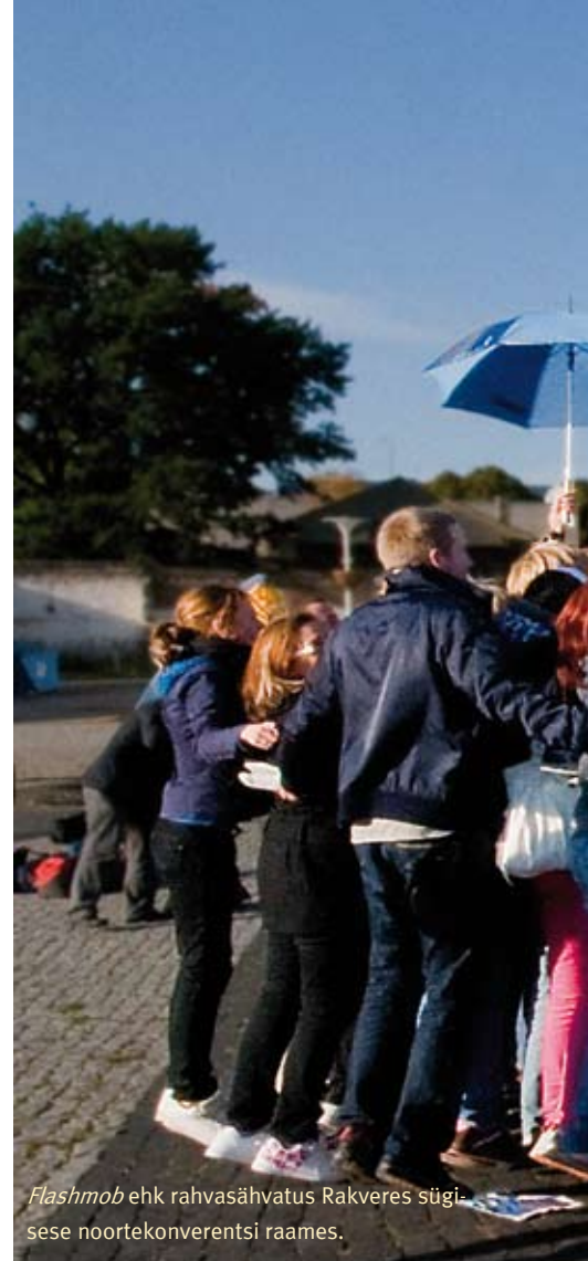
Flashmob ehk rahvasähvatus Rakveres sügisese noortekonverentsi raames.