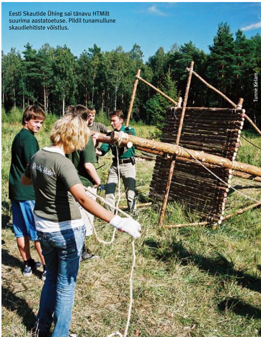
Eesti Skautide Ühing sai tänavu HTMilt suurima aastatoetuse. Pildil tunamullune skaudiehitiste võistlus.