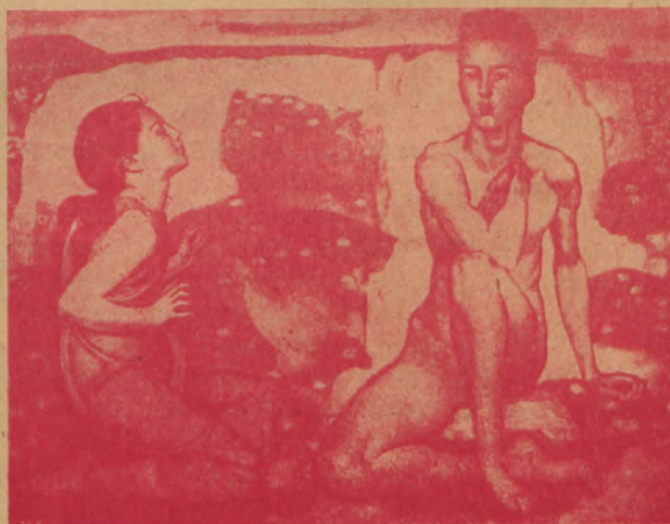
F. Hodler. Kevade ärkamine.