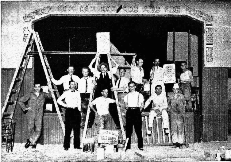
Seltsi ruume remonteerimisel

Võiks vaid soovida et sarnaseid õhtuid tihemini korraldatakse. Need aitaks palju kaasa, et süvendada suhteid kõigi siinsete eestlaste ja seltsi vahel.