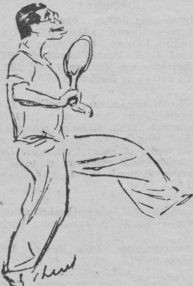
Abe, esindas Jaapani Davis-cupi võistlustel.

Borotra närvid elavad üle kriisi. Seda tunneb ka puupikkune yankee, kelle raudne nägu muu-