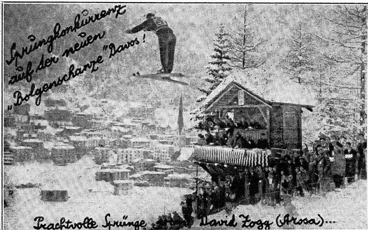
Zogg sooritab Schveitsi Alpides suusahüppeid.