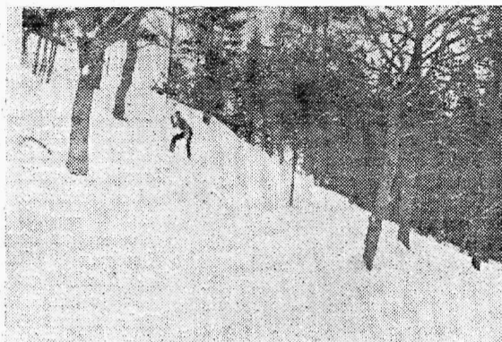
Kõrgem mägi esivõistluste rajal 25 km. võistlusmaal Rakveres. Mäe rektiivne kõrgus 25 mtr.

Nagu teada, ei noteerita ametlikult ilmarekorde murdmaa suusatamises. See on tingitud kahest asiolust: maa pikkus ei ole kunagi täpne, maastiku ja lume tingimused on alati erinevad. Sellepärast ei ole võistlusraja valikul tähtis ega ka mõtet kõige soodsamat rada ajada. Küll aga rohkem