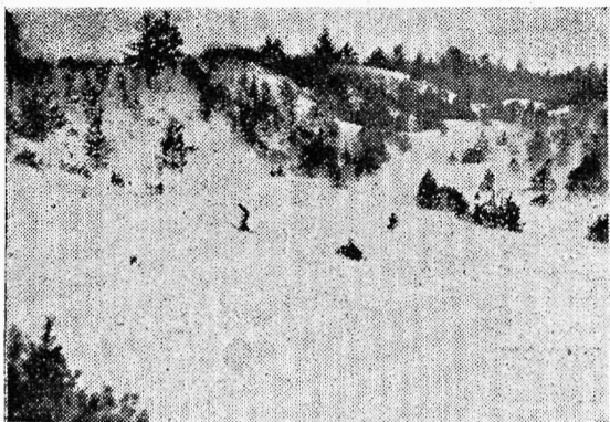
Maastik võistlusrajalt Rakvere lähedal.