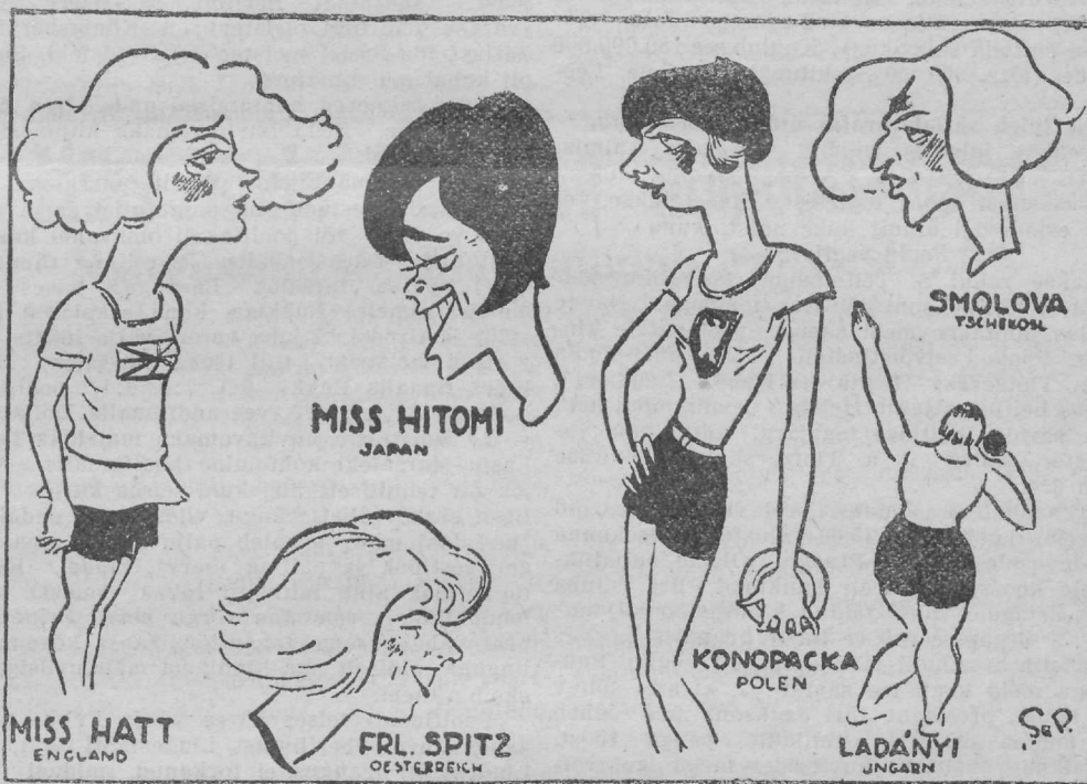
Mängude silmapaistvamad kujud.

4x100 mt. Inglise — 49,7; Austria — 52,6; Saksa — 50; Poola 51,9; Jaapan — 52,4; Prantsuse — 53,0.