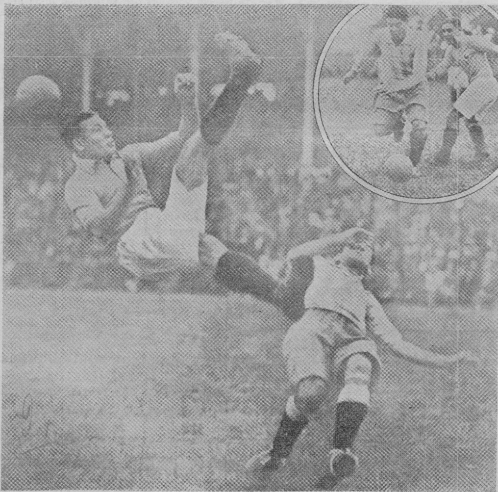
Silmapilk Prantsuse-Argentiina vahelisest jalgpallivõistlusest. Näeme lõunaameeriklast täiesti õhus olevat seisakus, mida raske kujutleda.

Et lõpp kujunes uruguaylaste võiduga, jäid tuhanded inimesed ilma sellest kahemeetrilisest