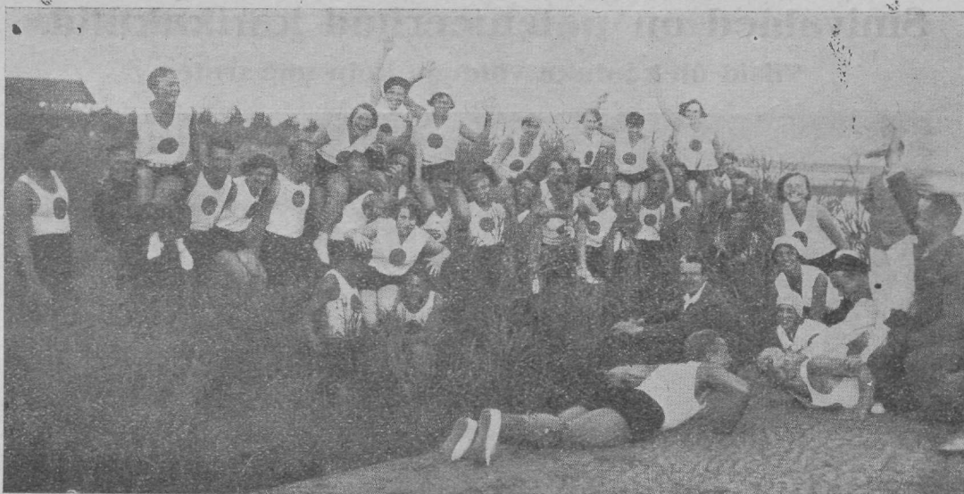
Lõbus grupp kehalise kasvatuses üliõpilasi Pärnus.