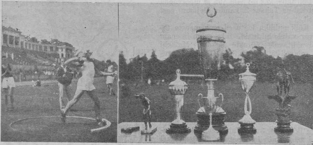
Miller tõukab kuuli hea tehnikaga. Paremalt: J. Lossmani ja teiste poolt muretsetud rikkalik auhindade kogu.

Tartu võitis Tallinna 369 punktiga 318 vastu.