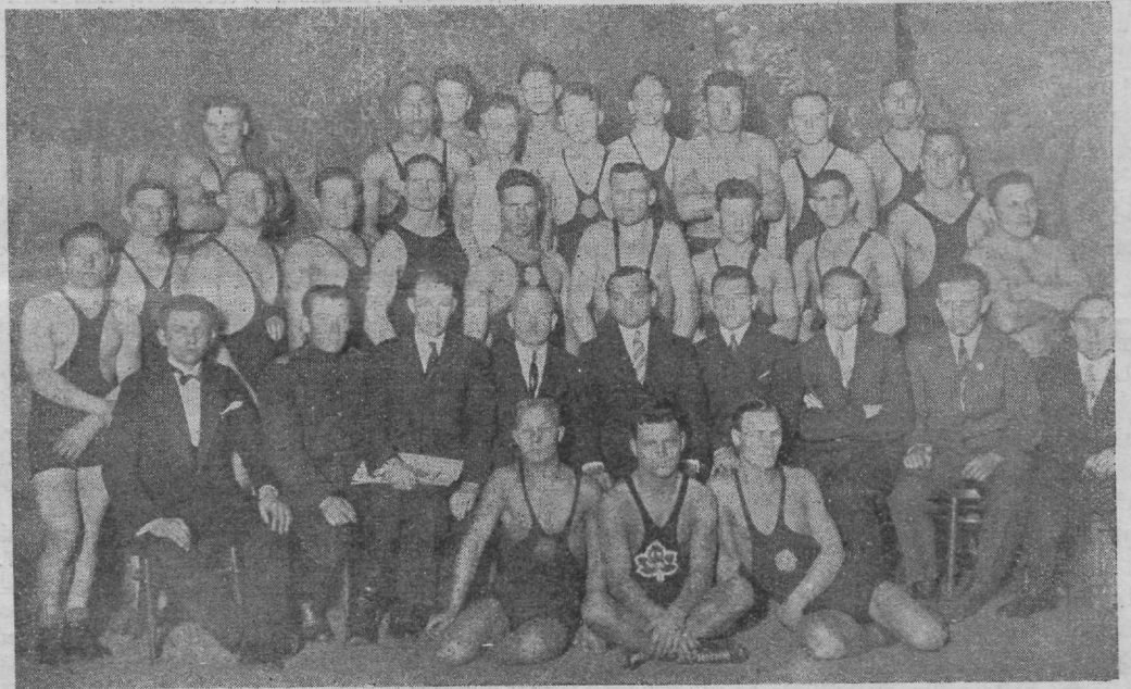
Tartu Kalevi maadlus- ja tõstevõistlustest osavõtjad ja kohtunikud 29. ja 30. novembril.