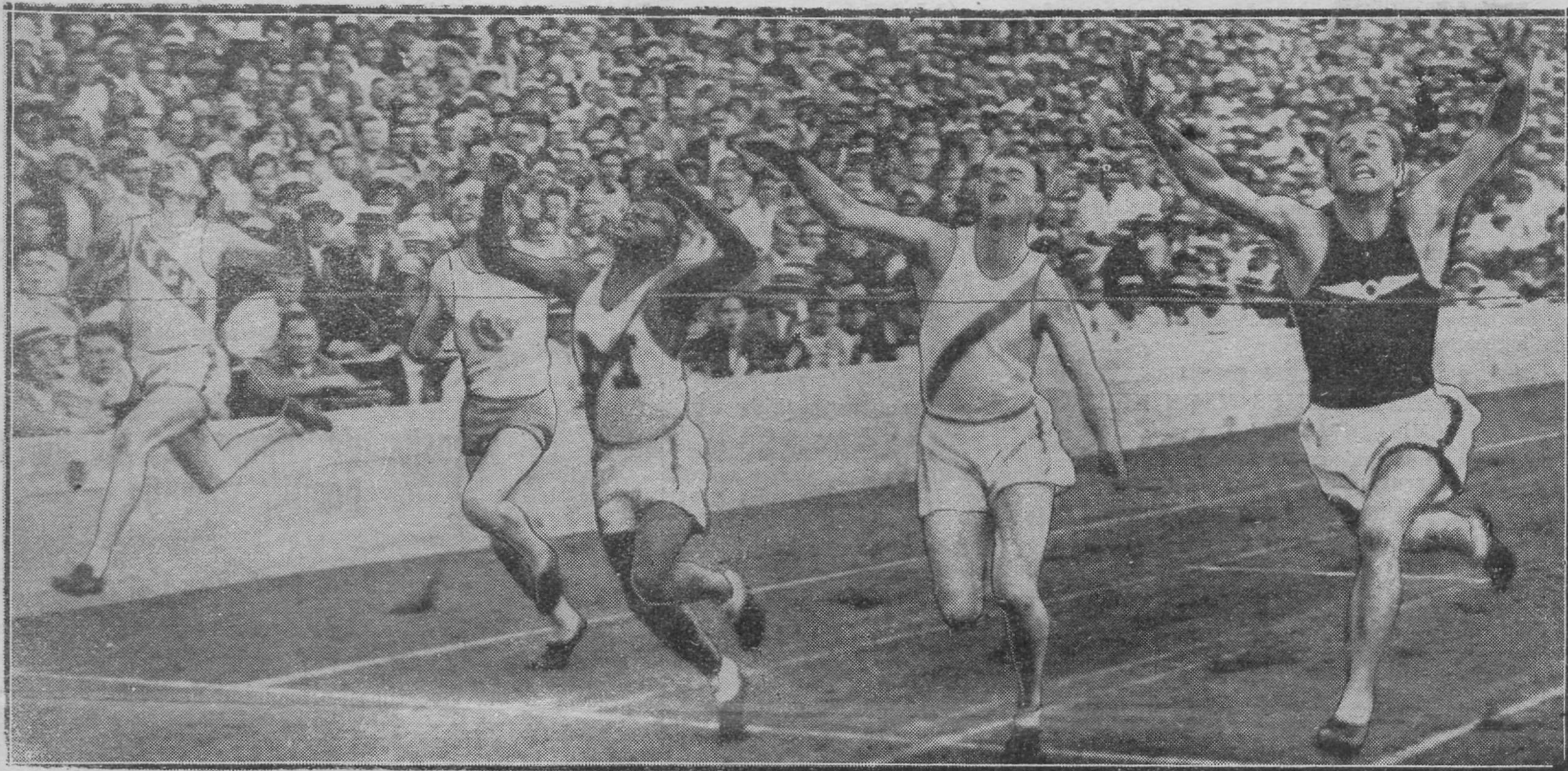
Nii jookstakse 100 mtr. Ameerika ülikoolide võistlustel esineb Ameerika kergejõustiku eliit, kelle tagajärgi meie tihti imetleme. Pildil lõpuspurt, kus meeste vahe vaid sentimeetreid. Keskel rekordi mees Tolan.