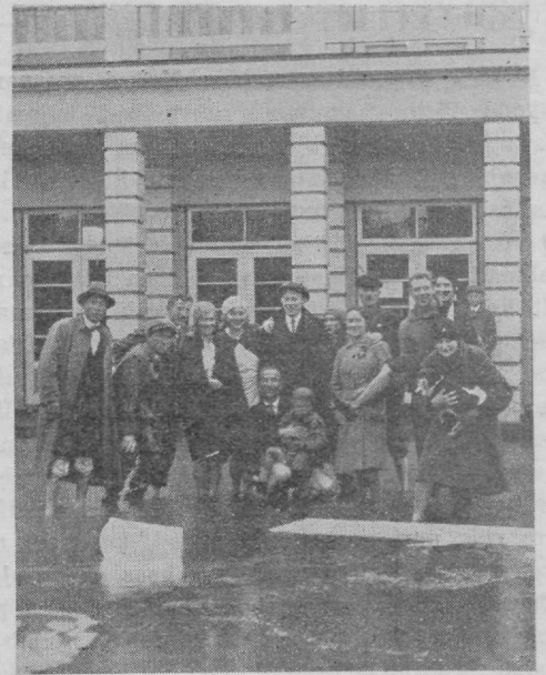
Pärnu staadioni esine on kaetud veega, mis tõuseb poolest säärest saadik.

Pärnu moodsal staadionil on riietusruumidel olemas dushid ja kraanid nagu kord ja kohus. Neist voolab ka vett — kuid missugust, või õi-