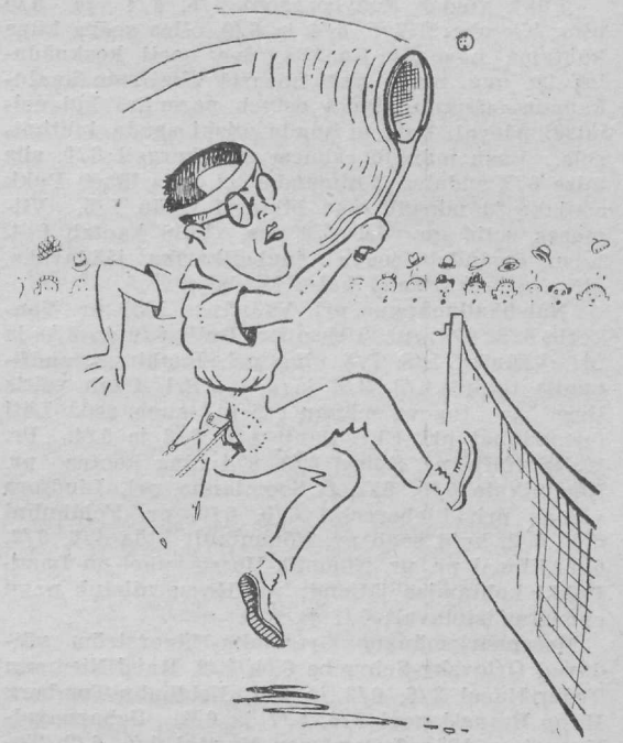
Arhitekt Lohk tugevam võrgus mängija.

Finaalis oodati kõva mängu. Pukk hilineb väljale ilmumisega ning alustades mängu, võib märgata ta harilikult muutmatust näos siiski äre-