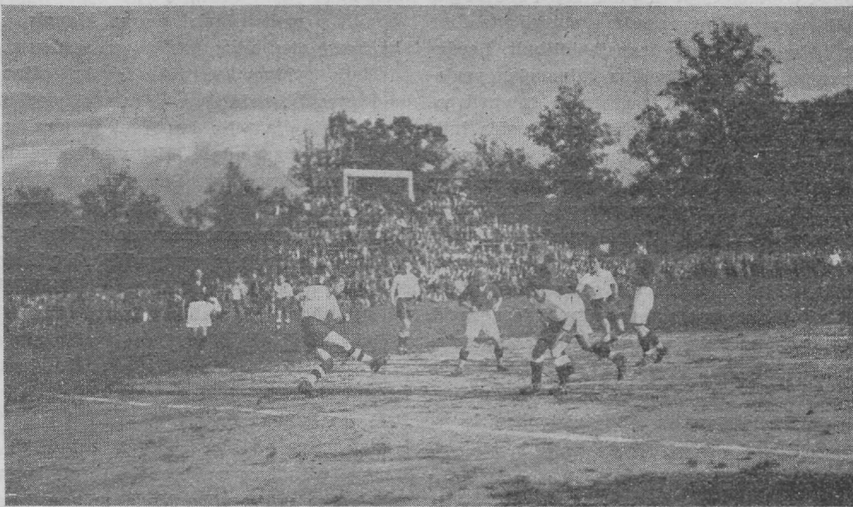
Silmapilk Läti-Leedu mängust. Lätlased tumedate särkidega pealetungil.

Ellmani vahetamine teisel poolajal ei olnud statuudiga kooskõlas ja see oli sündinud kahe meeskonna kapteni omavahelisel kokkuleppel, kusjuures lätlased oma meest ei julgenud sisse panna.