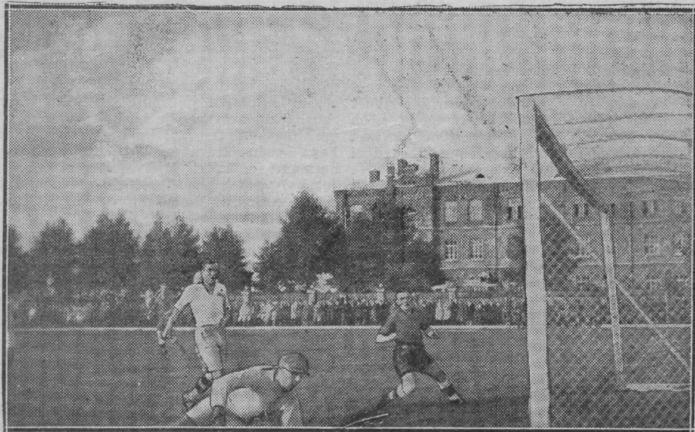
Silmapiik Eesti-Leedu mängu esimesest poolajast, kus likvideeritakse leedulaste soodne väravalöömise võimalus.

Eesti meeskond sõitis Tallinnast välja kesknädala õhtul. Ärgati Segevoldi jaamas, kus rong pikemat aega seisis. Kell oli pool 7 hommikul. Pikk seismine tekitas tähelepanu, Selgus, et kaks kilomeetrit jaamast Riia poole on tee lõhutud. Eelmise kaubarongi vagun oli roobastelt jooksunud, hulk liipreid rikkunud ja lõpuks teelt jooksunud. Koristamiseks kulus mitu tundi. Riias oli