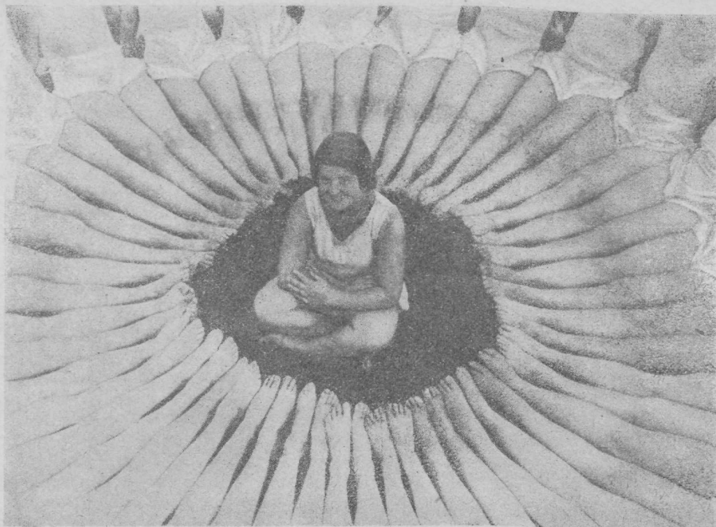
Moodne Buddha. Hannoveri mustervõ imlejate puhkepaus harjutuste vahel.