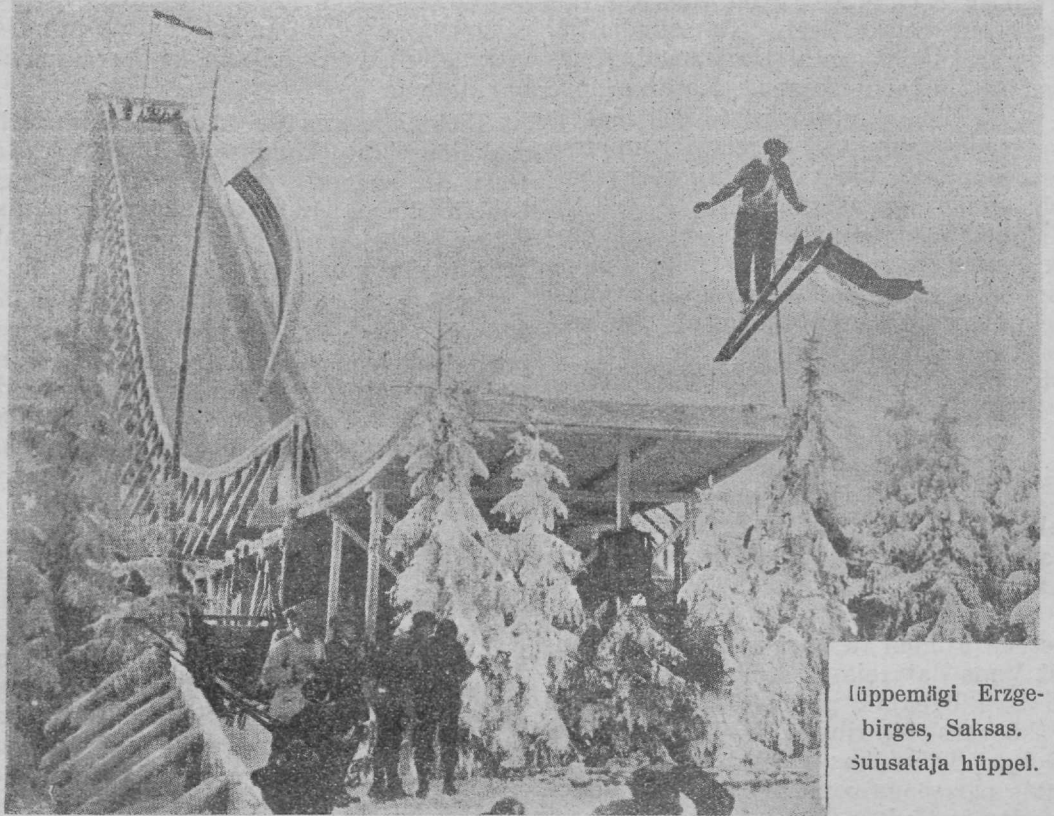
lüppemägi Erzgebirges, Saksas. Suusataja hüppel.