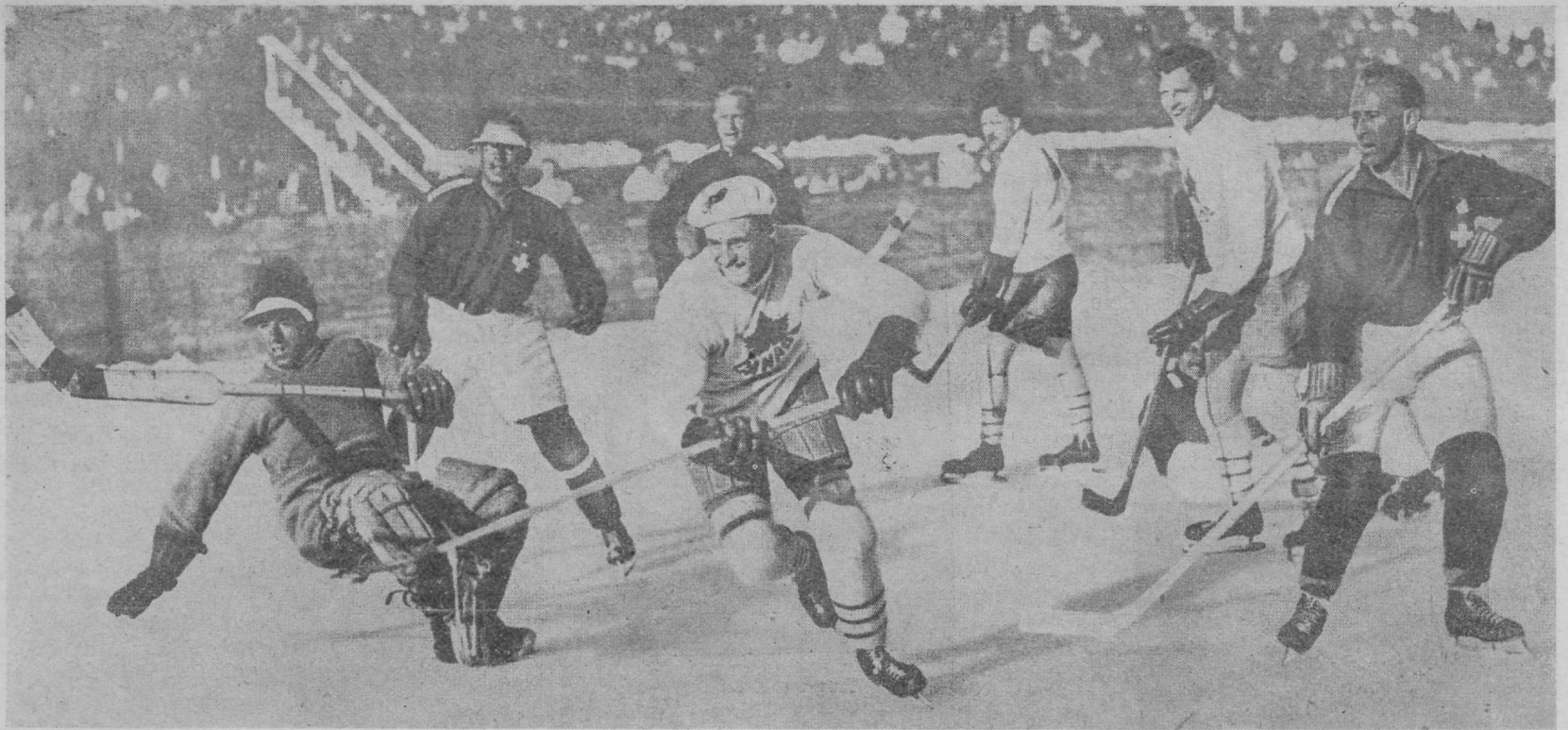
Moment olümpia hokivõistlustelt St. Moritzis. Kanada mängib Schveitsi vastu.