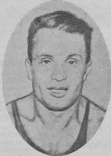
Toscani, Itaalia, keskkaal.