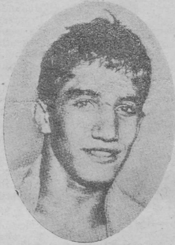
Tamagnini, Itaalia, kukk-kaal.