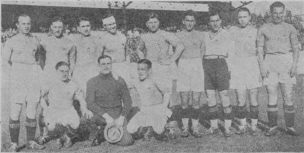
Itaalia rahvusmeeskond — maailma parimad 1928. a.?

1928. aastal on registreeritud maavõistlusi pidanud jalgpallis 34 rahvust. Igatahes on kõik paremad neil esinenud. Hea võimalus jõu mõõtmiseks oli Amsterdamis olümpiaad, millest aga kõik rahvused ei võtnud osa.