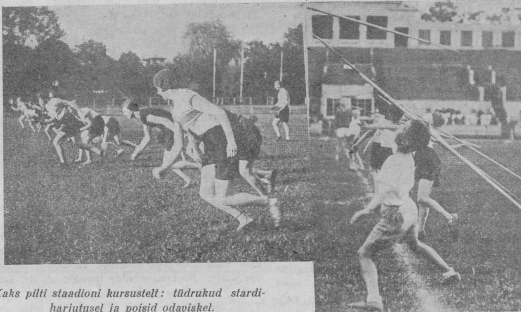
Kaks pilti staadioni kursustelt: tüdrukud stardiharjutusel ja poisid odaviskel.

— 33 meest on maailmas tänava oda heitnud üle 60 meetri. Neist on 14 ameeriklast ja 6 soomlast. Ameerika edu odaviskes on võrreldes endiste aegadega eriti silmatorkav.