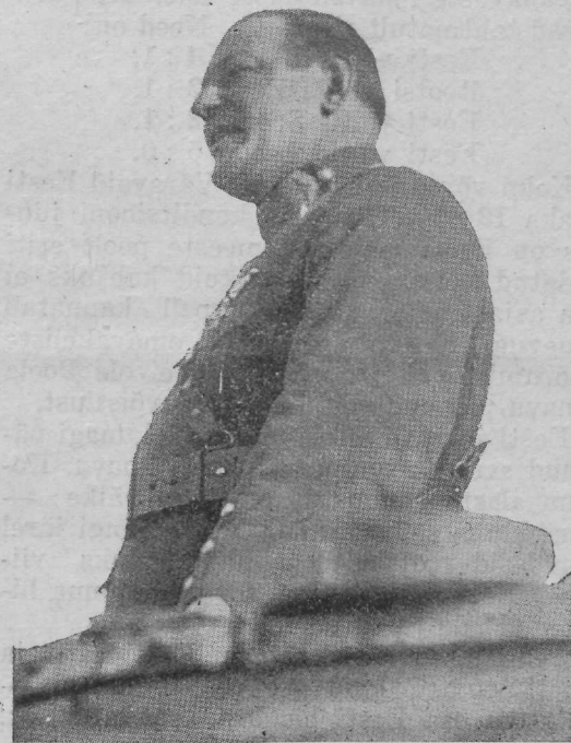
Vasakul võistlejate defilee staadionil kv. üleriiklikkudel võistlustel. Paremalt kaitseväge juht kindr. N. Reek, sõjaminister, kv. võistluste avamisel.

10.—14. aug. peeti Tallinnas üleriiklikud kaitseväge esivõistlused. Need on aastastasse edenenud nii oma osavõtult kui ka saavutustelt hiiglasammudega. Ilmekat keelt kõneleb järjest tõusnud osavõtjate arv: