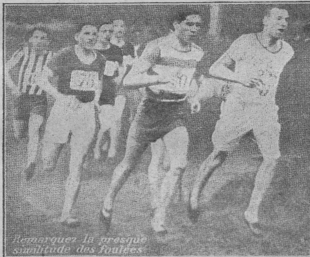
Vanarquer ja presque similitude des routes

publikul võimalus konkurentsi jälgida oleks, esiteks jooks osaliselt läbi rahvarikaste kohtade viia, mööda linnaäänavaidki ja siis suurem võistlejate mass välja panna. Püüda ühendust luua sõjaväe ja koolide organisatsioonidega, jooksu ühiselt korraldada, kuid eri gruppide viisi auhinnastada, tarbekorral handicape andes ine. Püüda mõningaid rändavaid auhinde murdmaajooksule välja panna, indi-