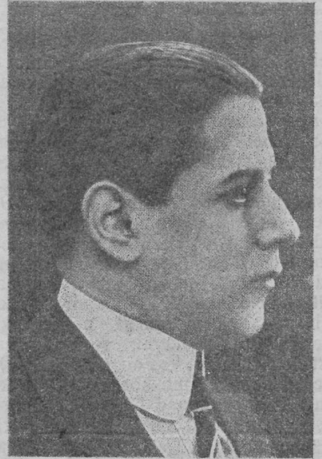
Jose Raoul Capablanca, ilmameister males.

Palju poliitilisi, rahalisi ja teistsuguseid ras-