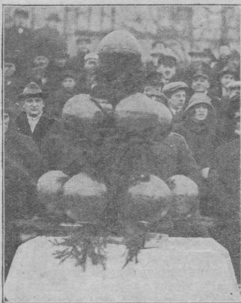
Kave shokoladi püramiid —