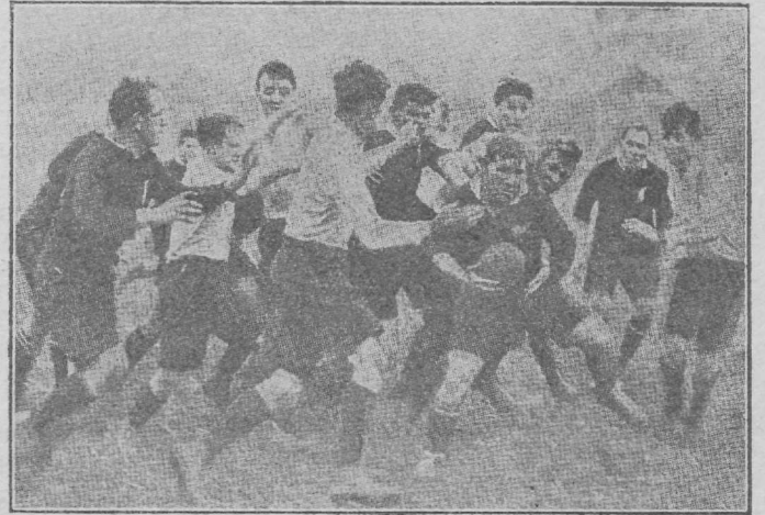
Võistlusmoment: Üks Täis-Mustadest palliga vastaste hulga seas.

Kõik: Katu te ihi i hi. Katu te vanavana. Kirunga te rangi. E tu iho nei. !! AU !! AU !! AU.