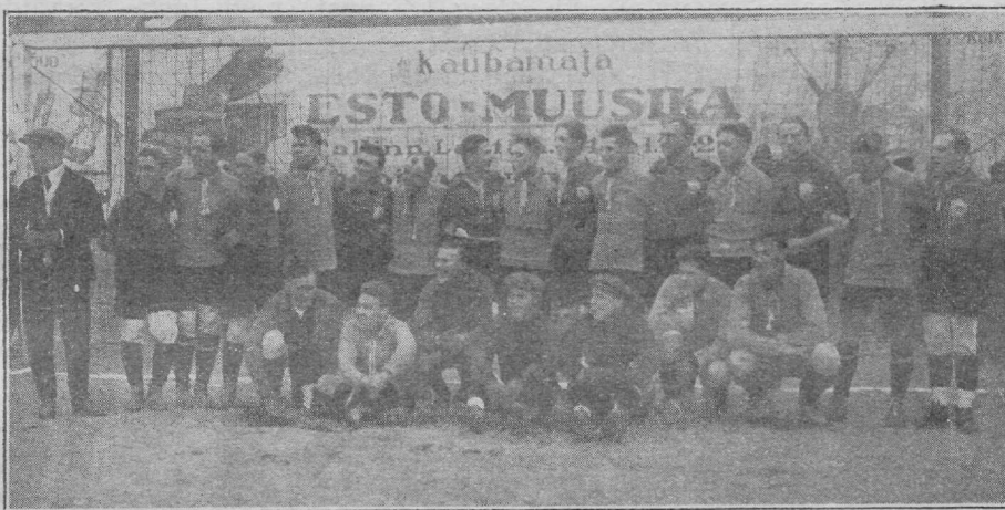
Meeskonnad võistluse eel.